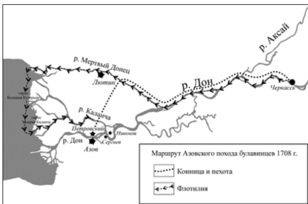
Ил. 1. Реконструкция маршрута Азовского похода булавинцев 1708 г.

намерение казаков» из Азова, вероятно, заключалось в создании иллюзорной надежды на успех операции 18 . Возможно, К.А. Булавин осознавал, что атаковать город «в лоб» бессмысленно, и рассчитывал захватить его при помощи предателей из числа местных жителей — так же, как он овладел Черкасском. Возвращение двадцати «переметчиков» в Черкасск для булавинцев должно было выглядеть вынужденным и казаться им вполне оправданным, если вспомнить предшествующую этому событию переписку К.А. Булавина с И.А. Толстым. Атаман требовал от губернатора, чтобы он не принимал тум с угнанным конским табуном в Азове и прислал его назад, гарантируя В.Ф. Фролову и его товарищам прощение и одновременно угрожая казнить их жен, детей и родственников 19 .