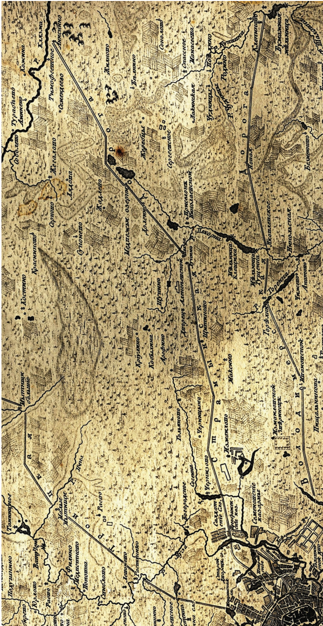
Ил. 2. Страмьинский тракт. Часть плана Царствующаго Града Москвы с показанием лежащих мест на тритцать верст округ. 1766 г.