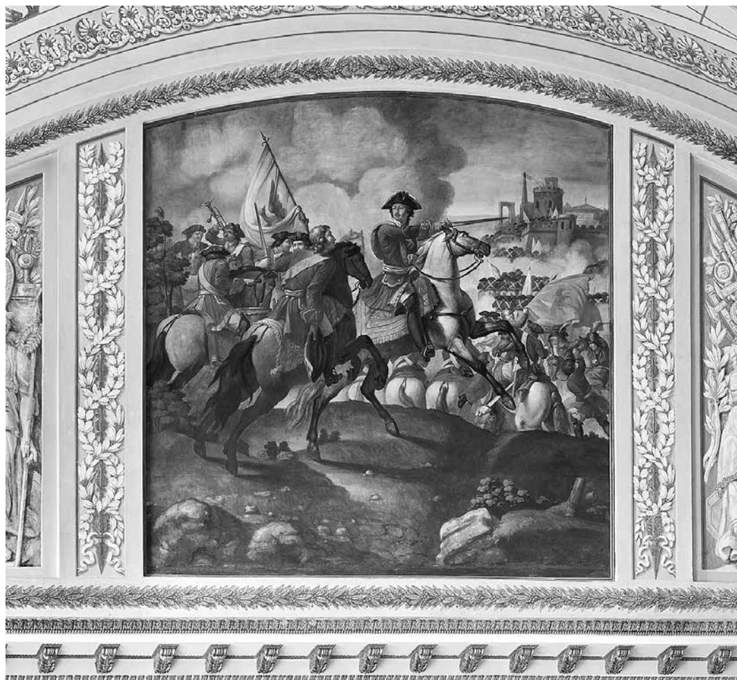
Ил. 5. Б. Медичи. Полтавская баталия. Живопись в люнете Петровского тронного зала Зимнего дворца. 1833 г., воссоздана в 1837 г.

к Эрмитажу» 32 . Поэтому его рекомендациями могли воспользоваться при выборе композиций на исторические сюжеты, к которым он ранее обращался в своем творчестве.