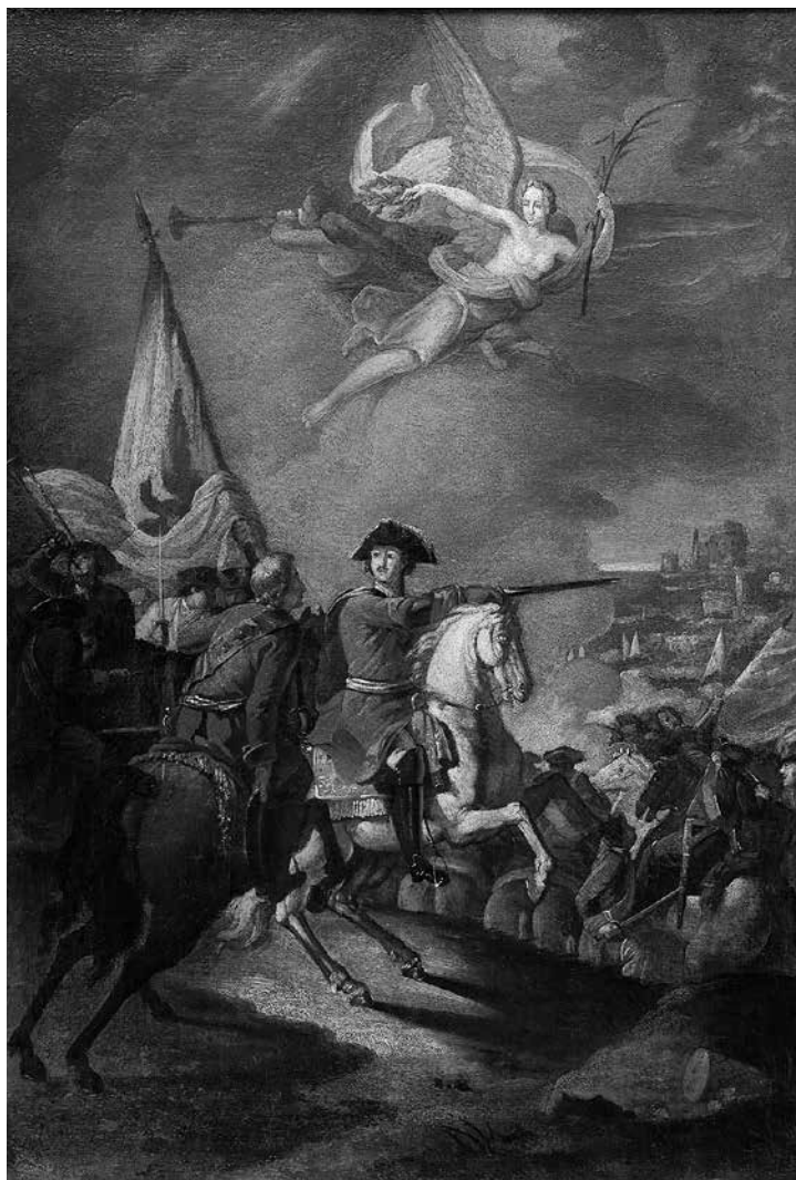
Ил. 2. В. К. Шебуев. Полтавская баталия. Эскиз. 1799–1800 гг. Государственный исторический музей. Инв. № ГИМ 17040щ/ИП – 1977

характерна для подготовительных эскизов как самого Шебуева, так и других мастеров XVIII – начала XIX в.