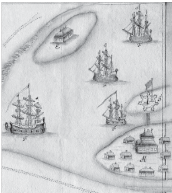
Чертеж Ниеншанца и Петербурга. 19 июля 1704 г. Фрагмент