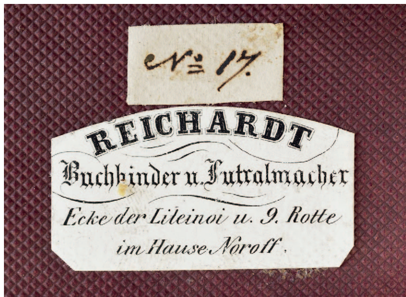
Ил. 2. Наклейка футлярных дел мастера Рейхардта