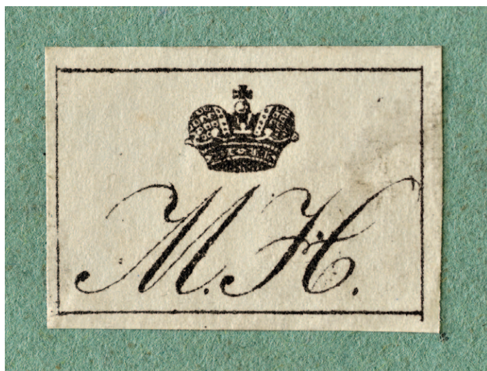
Ил. 3. Владельческая наклейка музея великого князя Михаила Николаевича