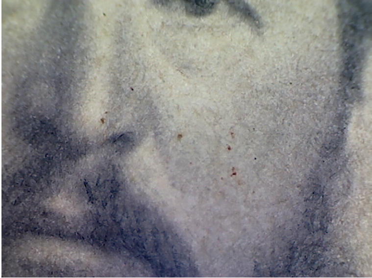
Ил. 9. ФФ 7/223. Включения в бумагу и пятна при увеличении в 200 x