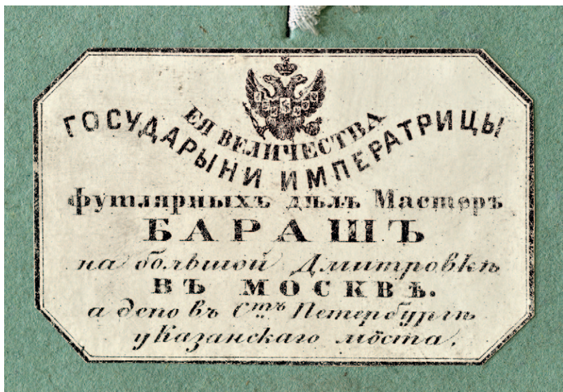
Ил. 1. Наклейка футлярных дел мастера Бараша

— проверить датировку, указанную на этикетках, сохранившихся с того времени, когда снимки находились в музее великого князя;