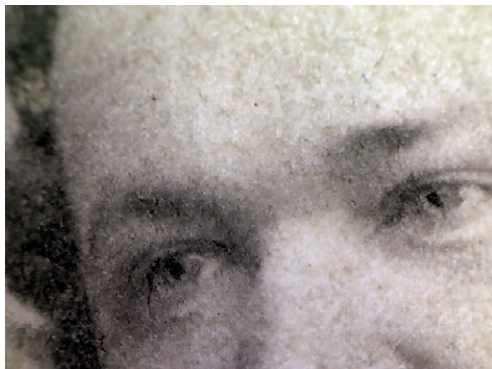
Ил. 11. ФФ 7/223. Прорисовка глаз

слой светочувствительного хлористого серебра. Бумагу высушивали и хранили в темноте. Срок хранения у такой бумаги недолгий, её должны были использовать в течение короткого времени. При получении фотографии бумагу экспонировали на солнечном свете, а позднее стали применять лампы для получения видимого изображения. Полученное изображение фиксировали гипосульфитом. Изображение формировалось в самих волокнах бумаги. Этим объясняется матовая, бархатистая поверхность отпечатков, нечёткость некоторых деталей изображения. То, что отпечатки на солёной бумаге имеют тенденцию к угасанию, было замечено с самого начала изготовления таких фотографий, так как поначалу фотографии не уделяли должного внимания процессам закрепления изображения и промывке. Позднее изображение стали вирировать солями золота, что придавало