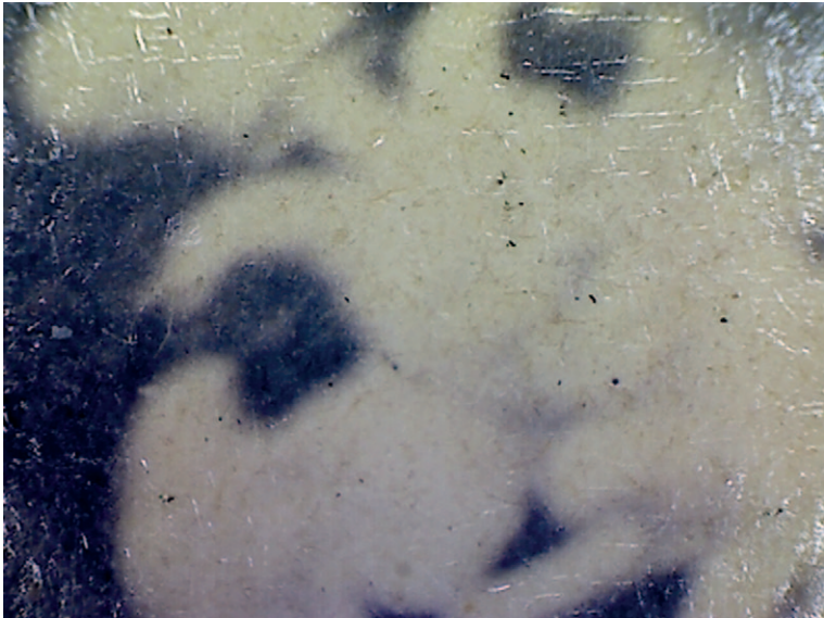
Ил. 10. ФФ 7/789. Волокна бумаги, включения и пятна. Увеличение в 200 x