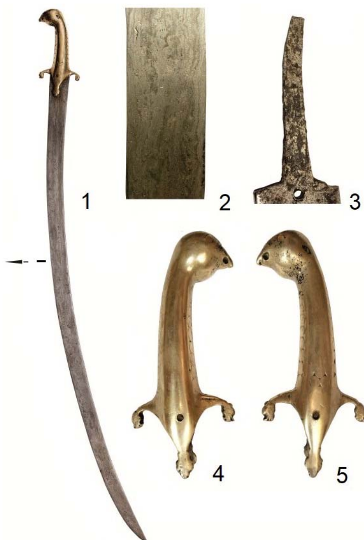
Рис. 1 (фото). Сабля из Самарканда: 1 – общий вид; 2 – фрагмент клинка; 3 – хвостовик; 4, 5 – эфес (без масштаба)

клинки прямые. Изгиб клинка – 48 мм (при замере от обуха). Отметим, что изгиб сабельной полосы начинается уже в верхней трети клинка, т. е. почти непосредственно под рукоятью. Ее общий вес (без бронзового эфеса) – 660 г.