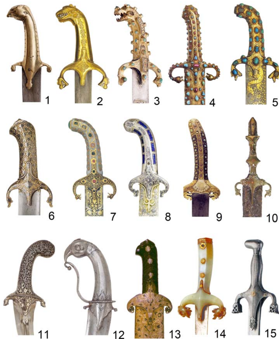
Рис. 2 (фото). Эфесы азиатского клинкового оружия XV–XIX вв.:

1 – сабля из Самарканда, XV–XVII вв. (частная коллекция); 2 – сабля, Иран, середина XVI – первая половина XVII в. (инв. № ОР-196/1-2, ММК); 3 – палаш, Турция, вторая половина XVI – XVII в. (инв. № В.О.-1643, ГЭ); 4 – палаш, Турция, вторая половина XVI – XVII в. (Inv. No: 21/129, Топкапы); 5 – палаш, Турция, до 1687 г. (иранский клинок XVI в.) (инв. № ОР-194/1-3, ММК); 6 – сабля, Турция, XVII в. (Inv. R-212, ФИФ); 7 – палаш, Иран, до 1645 г. (инв. № ОР-4443/ 1-3, ММК); 8 – палаш, Турция (европейский клинок), конец XVII в. (Inv. 36.25.1333 а, б, МИМ); 9 – сабля, Турция или Иран, XVII–XVIII вв. (Inv. No: 1/292; Топкапы); 10 – боевой нож, Средняя Азия (Бухара?), XVI–XVII вв. (Inv. R-403, ФИФ); 11 – нож, Южная Индия (Танджор?), XVII в. (Inv. R-403, ФИФ); 12 – нож, Индия (Деккан?), первая половина – середина XVII в. (Inv. R-20, ФИФ); 13 – сабля, Турция, XVII в. (ГИМ); 14 – сабля, Средняя Азия или Иран, первая половина – середина XV в. (Inv. № 1/220, 1/219, Топкапы); 15 – сабля, Южная Азия (Афганистан, Индия), Иран (среднеазиатские ножны) XVIII–XIX вв. (инв. В.О. 1941, ГЭ) (2, 5, 7 – по: [Государева Оружейная палата, 2002]; 3 – по: [Образцов, 2015]; 4, 9 – по: [Hilmi, 2012]; 6, 10–12 – по: [The Arts..., 2008]; 8 – по: [Alexander, 2015]; 13 – по: [Аствацатурян, 2002]; 14 – по: [Большой атлас..., 2008]; 15 – по: [Художественное оружие..., 2010]; без масштаба)