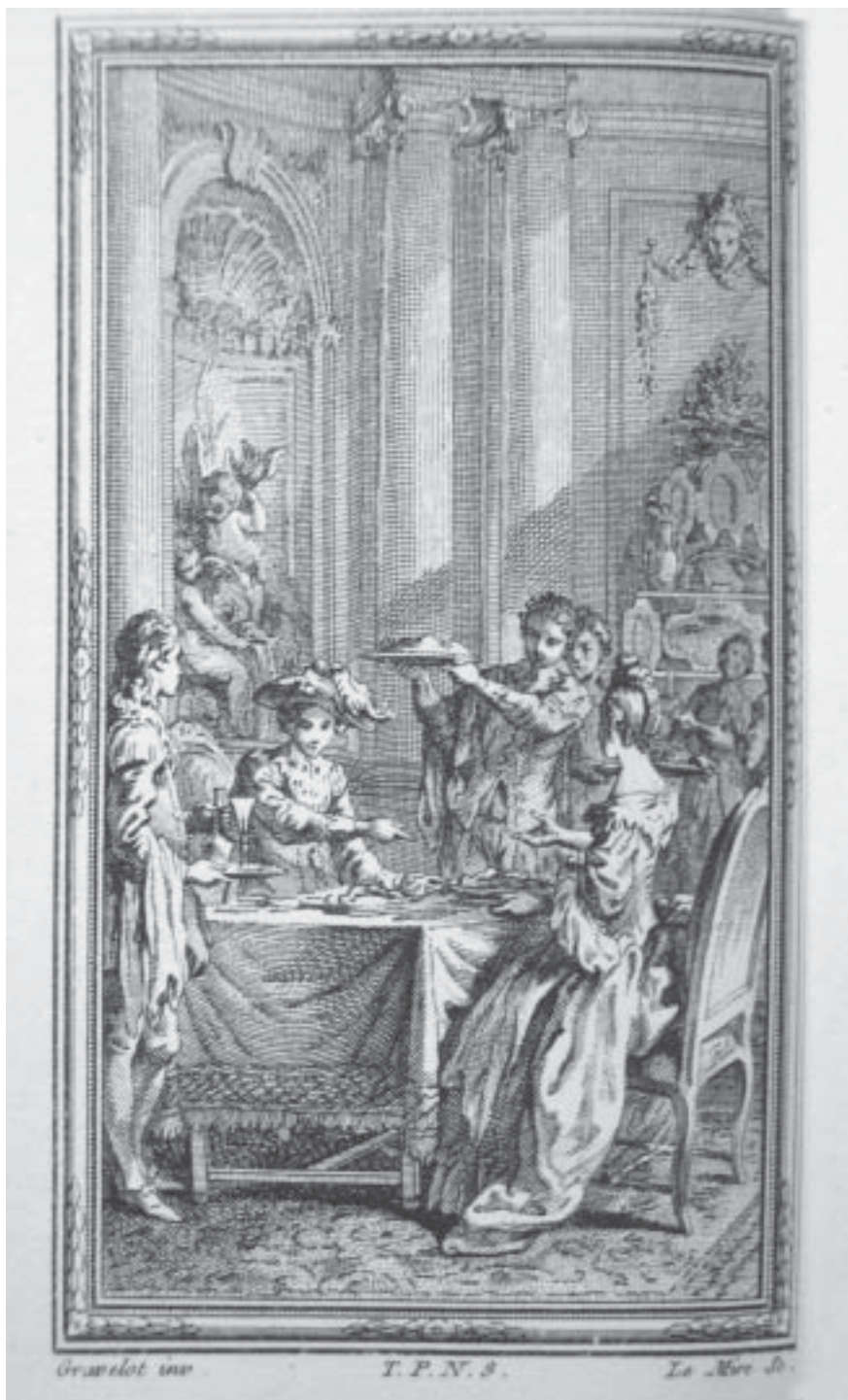
Ил. 3. Ю. Гравело. Иллюстрация к «Декамерону» Боккаччо. 1757