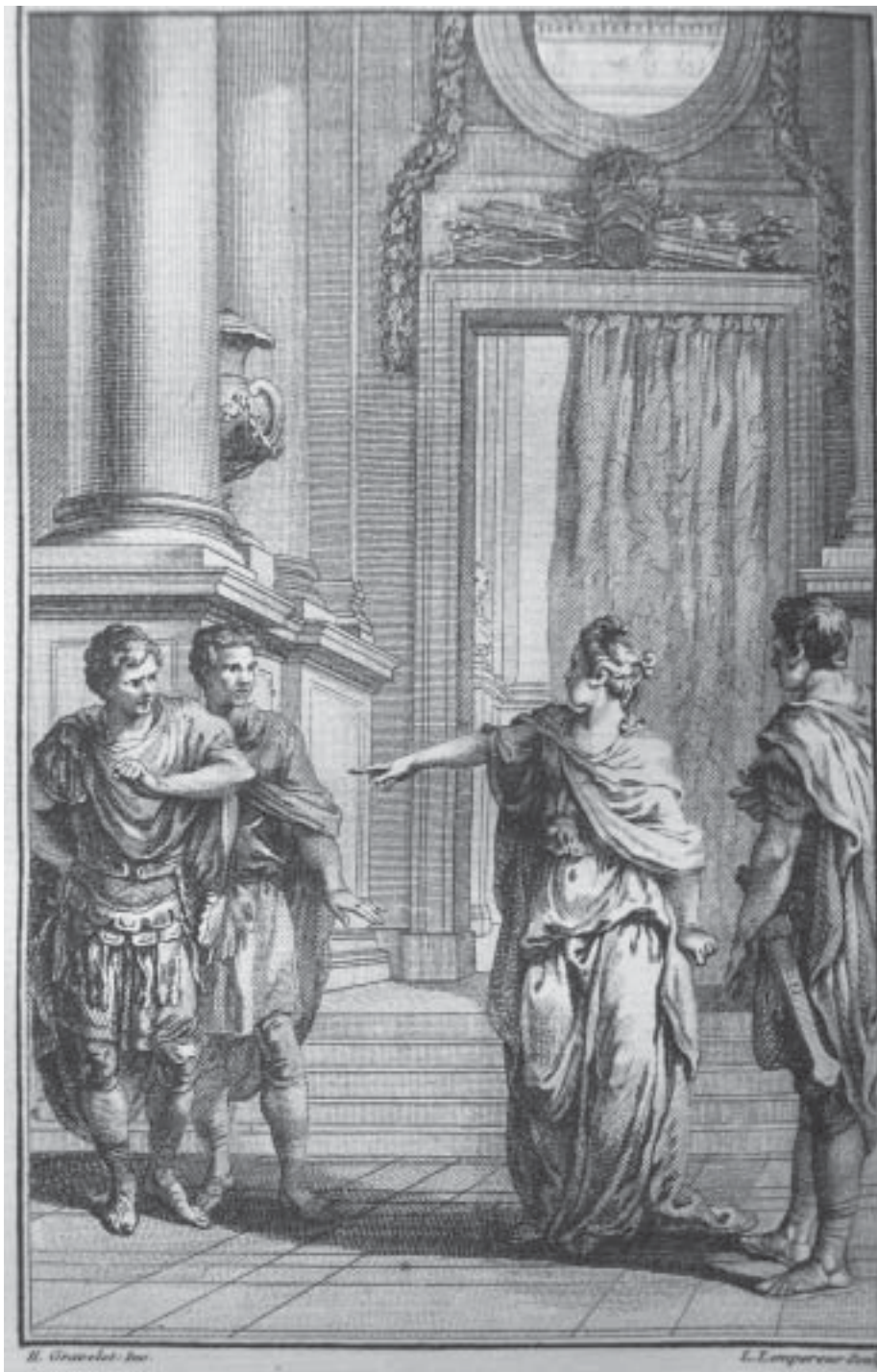
1. Ю. Гравело. Иллюстрация к «Британику» в «Сочинениях» Расина. 1768