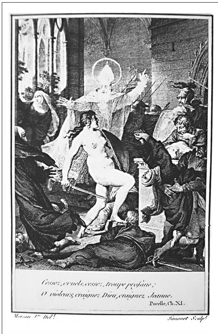
6. «Орлеанская девственница» Вольтера. Ж. М. Моро-младший. 1789. Ирбитский ГМИИ