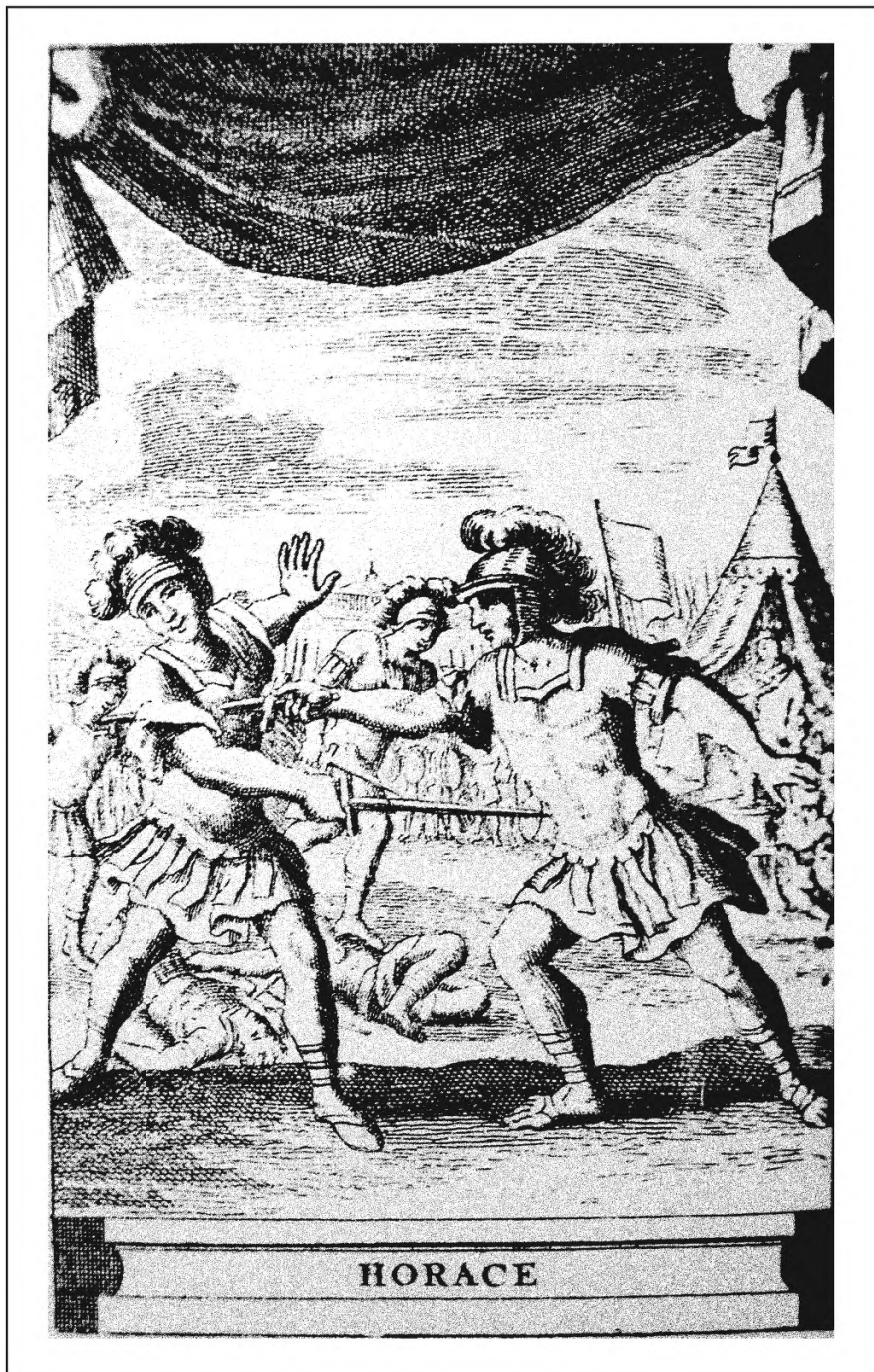
2. «Театр» П. Корнеля. 1723. НБ УрГУ