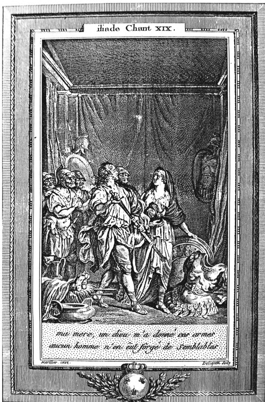
4. «Илиада» Гомера. К. П. Марилье. 1786—1788. СОУНБ им. В. Г. Белинского