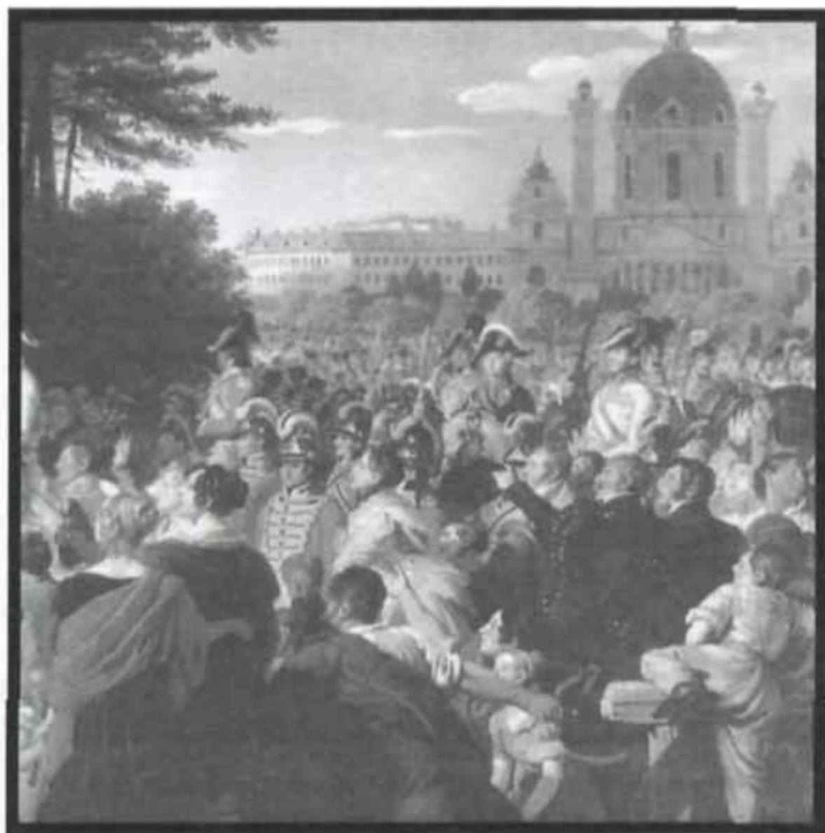
И.Р. Краффт. Возвращение императора Франца I после подписания Парижского мира. В центре процессии гвардейские драбанты и гвардейские лучники

получить подходящее для пенсионера место при дворе в случае наступления полной инвалидности. Драбанты несли службу в передних и в коридорах имп. дворца и с момента основания находились на казарменном положении. В штате числились: гв. капитан, из генералов, в 1808-1809 гг. фцм. кн. Карл де Линь, в 1816 г. фм. гр. Венцель Коллоредо; гв. капитан-лейт. (из п-ков армии), в то время п-к Йозеф фон Шмидт; гв. обер-лейт. (из п/п-ков), командир отряда этой гвардии, несущего службу в императорском загородном дворце (Mailand); гв. унтер-лейт. (м-р армии), в тот период м-р гр. Франц Хардегг, гв. премьер-вахмистр (из капитанов) - к-н Карл Оссенбург, а также обычные штабные чины. Полагался и один знаменщик.