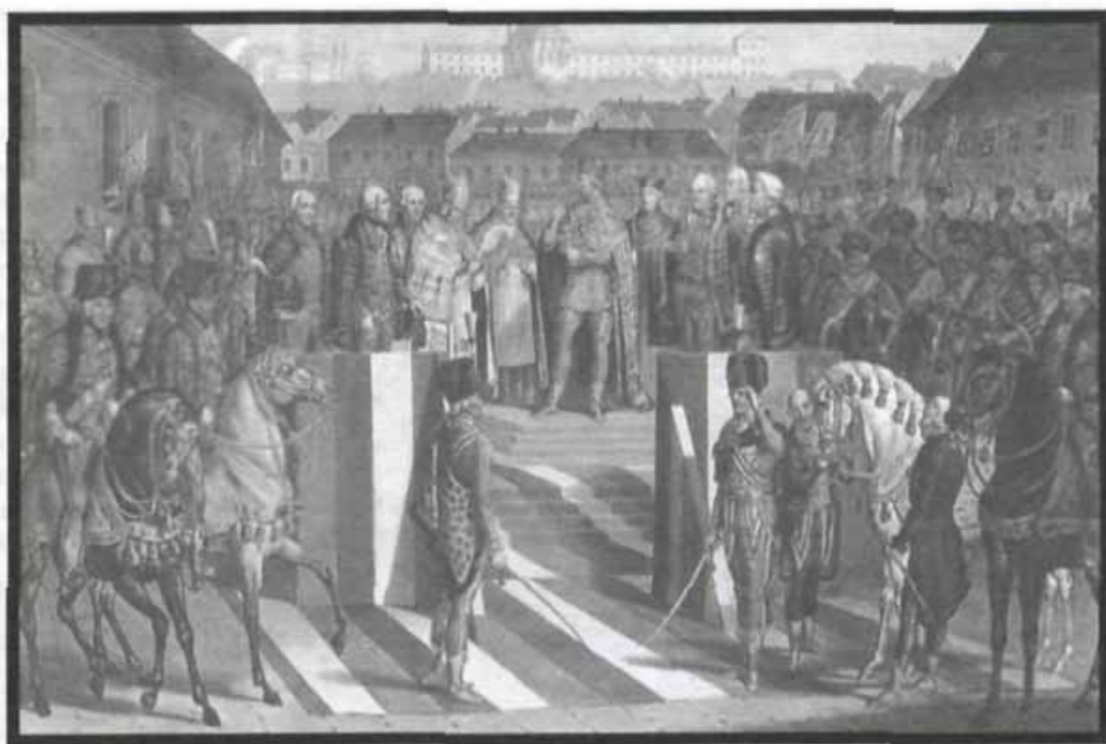
Император Священной Римской империи Франц II коронуется королём Венгрии. На переднем плане изображены венгерские гвардейцы

Внешний вид гвардии почти не изменился с момента её основания. Гусарская шапка из коричневого меха, с зеленым суконым шлыком; с правой стороны серебряные этишкеты, а спереди султан из белых перьев цапли. Венгерские узкие штаны и доломан