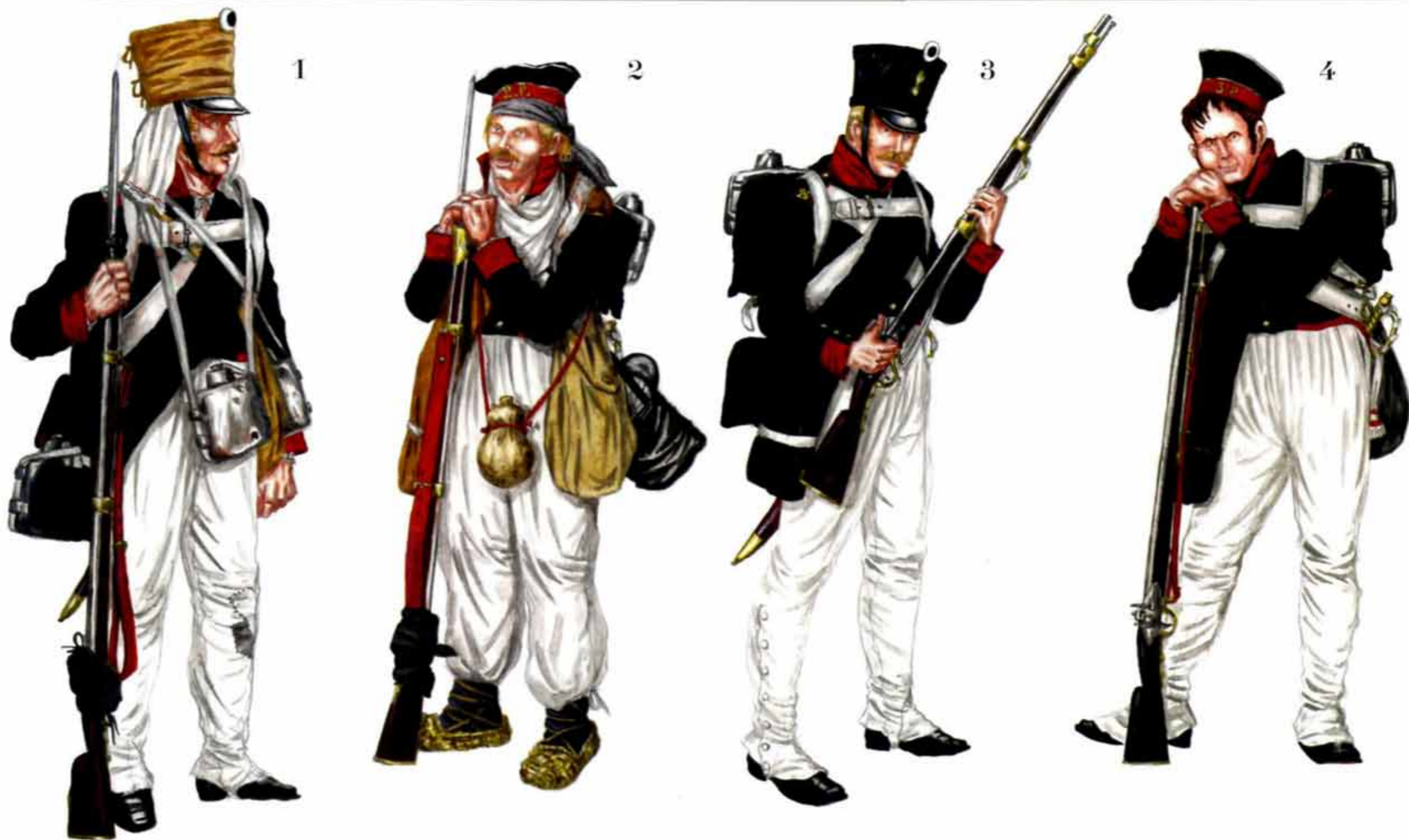
М. Борисов. 1 и 2. Рядовые пехотных полков на походе. 3. Рядовой мушкетёрской роты 1-го батальона Орловского пехотного полка. 4. Рядовой 3-й мушкетёрской роты 1-го батальона Тульского пехотного полка.