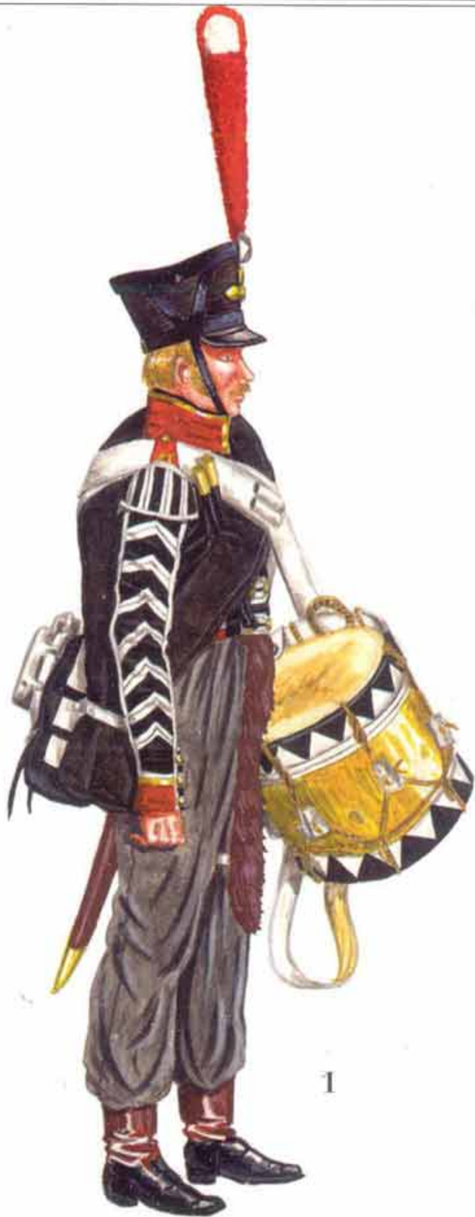
М.В. Борисов. Русская пехота в 1812 г. 1. Батальонный барабанщик Киевского гренадерского полка. 2. Музыкант 20-го егерского полка. 3. Рядовой 35-го егерского полка. 4. Унтер-офицер 38-го егерского полка.