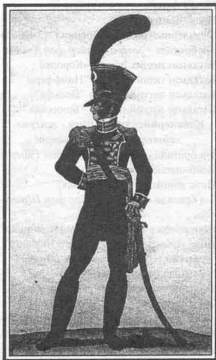
Офицер батальона пеших егерей Короля. Манускрипт Вайланда

Указом от 12 сентября 1805 г. был создан 2-й батальон пеших егерей. Кроме него, еще были созданы 2 батальона легкой пехоты. В ходе всех переформирований оба батальона пеших егерей стали насчитывать по 3 роты каждый. Штаб батальона состоял из командира баталь-