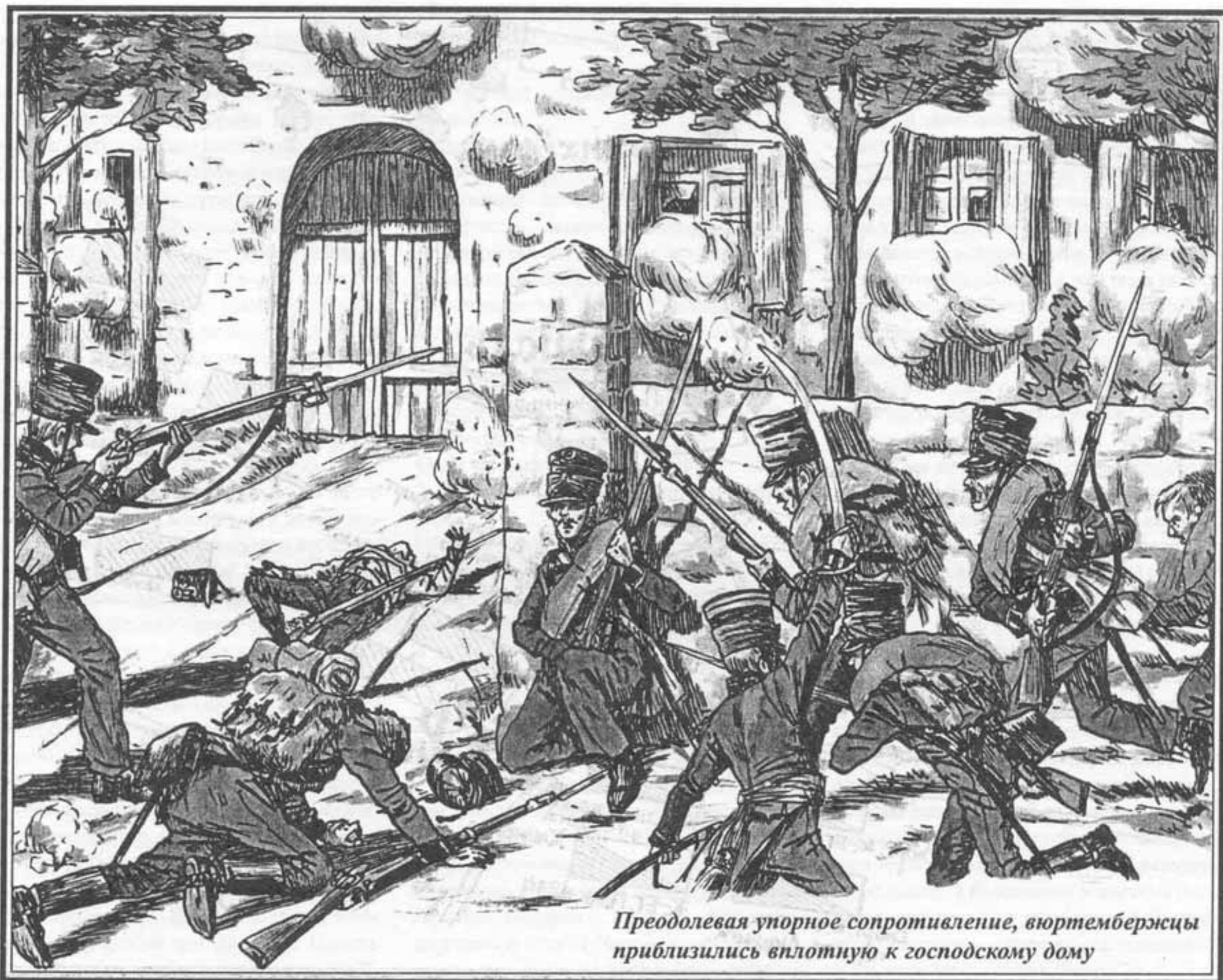
Преодолевая упорное сопротивление, вюртембергцы приблизились вплотную к господскому дому

обстрелу, зато представлял собою самый удобный пункт для обозрения битвы; здесь мне и удалось быть свидетелем самых изумительных передвижений за все время моих походов. Вправо, впереди нас лежала деревня Эггмюль, захвату которой Наполеон придавал большое значение, упорно на нем настаивая. Деревня лежала на пригорке, церковь же, окруженная двором и крепкой стеной, прочно занятая и обороняемая австрийцами, еще выше. Два приступа французов уже были отбиты; тогда Наполеон приказал вюртембергской легкой бригаде повторить приступ. Четыре батальона, которые на горе вместе с нами участвовали в нападении, одушевленные еще утренним успехом, со страшным криком быстрым маршем бросились на деревню; (в этой пехоте в ту пору введена была команда "рысью!") тысячи огненных жерл встретили их; послышался страшный треск, и вся деревня Эггмюль окутана была невероятно большим облаком дыма. Пустились в рукопашную. Мало-помалу наступила тишина, и когда дым рассеялся, мы увидели своих земляков, захвативших деревню и церковь. Тогда по всей нашей боевой линии раздался крик восторга, какого я никогда не слышал ни раньше, ни позже".