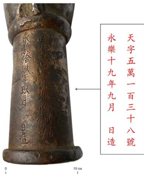
Рис. 2. Маркировка бронзовой китайской ручницы из долины р. Джиды в Бурятии

Перевод надписи: правая колонка – серия и серийный номер: «Серия 天 ([тянь] «небо»), номер 50138». Левая колонка – дата изготовления: «изготовлено ... дня, 9-го месяца, 19 года правления императора династии Мин Чэн-цзу (Чжу Ди)», правившего под девизом Юнлэ, что соответствует 1421 г. [Чжунго лиши..., 1994. С. 179].