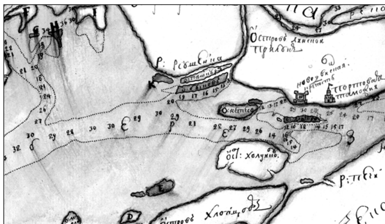
Рис. 2. Фрагмент карты дельты Северной Двины. 1735–1740 (?) гг. (РГАДА. Ф. 192. Оп. 1. Архангелогородская губерния. Д. 20)

На основе документов, посвященных сражению на речке Малой Двинке (Новодвинскому сражению), и приведенных картографических материалов можно с достаточной уверенностью говорить о местоположении «няши».