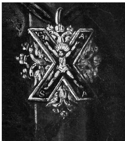
Ил. 3. Неизвестный художник. Портрет Петра I. Деталь

Изображение Андреевского креста с тремя орлами присутствует на портрете Петра I. Сохранился целый ряд живописных портретов XVIII–XIX вв. одного типа, который восходит к гравюру Шхонебека (1703–1705) с изображением Петра I в полный рост с арапчонком 52 . (В XIX–XX вв. моделью на этих портретах часто считался не российский царь, а его сподвижник – Франц Лефорт.) На одном из таких портретов (ГЭ) 53 (ил. 2, 3) на голубой ленте на груди царя изображен кавалерский золотой крест, близкий