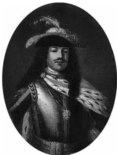
Ил. 2. Неизвестный художник. Портрет Петра I. XVIII в. Холст, масло. Государственный Эрмитаж. Инв. № ЭРЖ-536