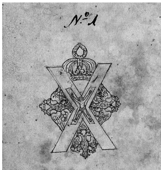
Ил. 4. Эскиз кавалерского креста ордена Андрея Первозванного. Лицевая сторона. 1709 г. Бумага, тушь. РГАДА. Ф. 158. 1709 г. Д. 40. Л. 3