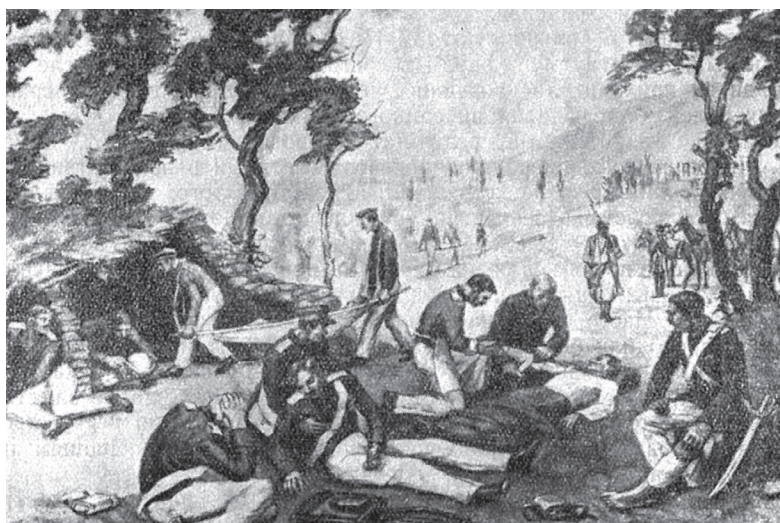
Ил. 4. Н. И. Пирогов на перевязочном пункте при осаде аула Салты. Художник П. Д. Бучкин

Сведения о взятии Салт содержатся в разных в официальных источниках, начиная с напечатанного в том же году издания