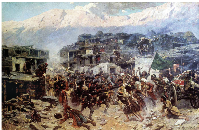
Ил. 1. Штурм аула Салты 14 сентября 1847 г. Художник Франц Рубо

В ИСТОРИИ КАВКАЗСКОЙ ВОЙНЫ 1847 год был временем, когда главнокомандующий кавказскими войсками кн. Михаил Семенович Воронцов и лидер горцев имам Шамиль уделяли особое внимание междуречью Казикумухского Койсу и Каракойсу в Нагорном Дагестане. Военно-стратегическое, политическое и экономическое значение этого района обусловили невероятное упорство обеих сторон в военном противостоянии 1 . Неслучайно кн. Воронцов лично возглавил войска, задачей которых было покорить верные Шамилю