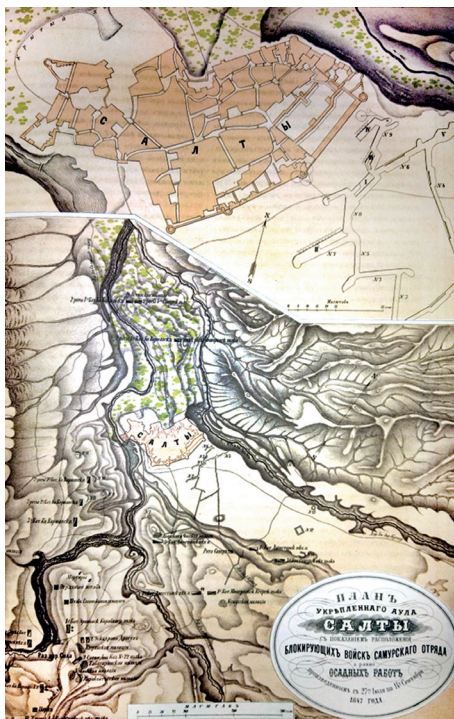
Ил. 3. Карта осады аула Салты

Из «Отчета» Пирогова и других источников известно, что медики выехали 8 июня 1847 г. из Санкт-Петербурга на сибирском тарантасе в направлении Кавказа. В конце июня – начале июля они были в Пятигорске, где Пирогов в госпитале провел