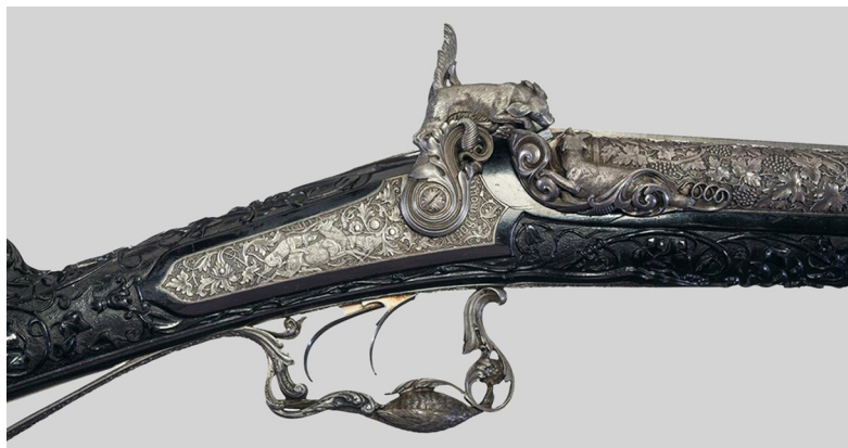
Ил. 7. Охотничье ружье Лепаж–Мутье. 1860. Подарок 1879 г. президенту Мексики от президента Французской республики

с французской интервенцией 1861–1867 гг., генералу, а впоследствии президенту Мексики Мануэлю Гонсалесу 25 от президента Французской республики Жюля Гриви 26 . Подарок был сделан в 1879 г. в ознаменование принципиально новой эры политических отношений между Мексикой и Францией, означавшей полное примирение и отрицание политики, проводимой Наполеоном III.