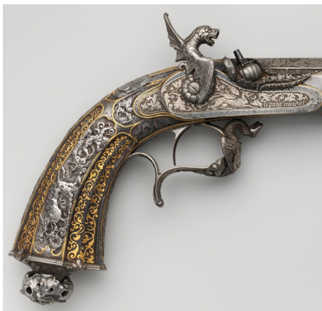
Ил. 8. Парные пистолеты. Франция, Париж; Великобритания, Лондон. 1851 г. Мастер Л. Лепаж-Мутье, А. Веште. Стволы: Л. Бернар. Сталь, золото; литье, резьба, чеканка, насечка (длина каждого пистолета 40,3 см)

Vita brevis ars longa... Ныне, в XXI в., armes de luxe мануфактуры Лепаж по праву заняли достойное место не только в истории оружия, но и мировой культуре, чего, пожалуй, не скажешь ни о каком ином оружейном доме.