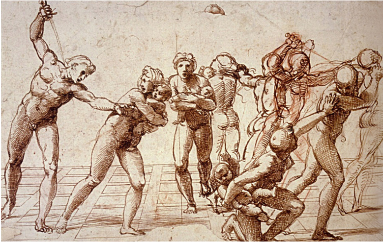
Ил. 4. Рафаэль. Избиение младенцев. Набросок. Перо, коричневые чернила. 1510–1514 гг. 23,2 x 37,7 см. Британский музей. Лондон

ненные им для экспозиции Лепаж, заслужили всеобщее признание и принесли ему призовую медаль Лондонской выставки 1851 г.