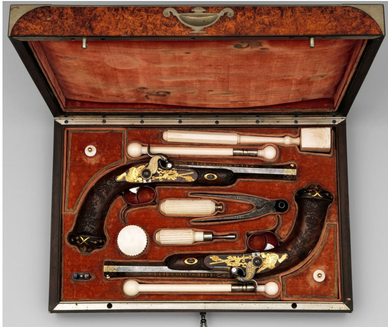
Ил. 2. Парные пистолеты для девятилетнего наследника престола графа Генриха (Анри) Шарля д'Артуа, герцога Бордо. Франция, Париж. 1829 г. Мастер А. Лепаж. Сталь, золото, дерево; литье, резьба, чеканка, насечка (длина каждого пистолета 28,6 см)

как геральдические лилии Бурбонов, лавровые и пальмовые ветви. На верхней части стволов нанесена золотой насечкой маркировка мастера «Лепаж, оружейник короля в Париже».