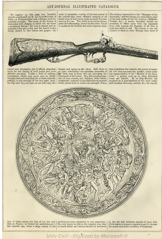
Ил. 3. Произведения из экспозиции Лепаж, воспроизведенные на с. 5 Иллюстрированного каталога Универсальной всемирной выставки 1851 г. в Лондоне

Виллюстрированном каталоге первой всемирной выставки 1851 г. в Лондоне экспозиции мануфактуры Лепаж–Мутье отведена полная страница 13 с гравированными воспроизведениями двух изделий: охотничьего ружья и щита (ил. 3). Над изготовлением последнего трудился крупнейший парижский мастер Антуан Веште (1799–1868) 14 , прежде сотрудничавший с Ф.-Д. Фроман-Меризом, а также и с английскими придворными серебряниками «Хант энд Роскелл» 15 . Он был не только превосходным художником-модельмейстером, но и чеканщиком, тяготевшим к стилистике позднего ренессанса и барокко. Благодаря виртуозному владению техникой чеканки, А. Веште в равной степени успешно работал как в серебре, так и в стали, что позволяло ему обращаться также и к декорированию парадного оружия. Произведения 16 , выпол-