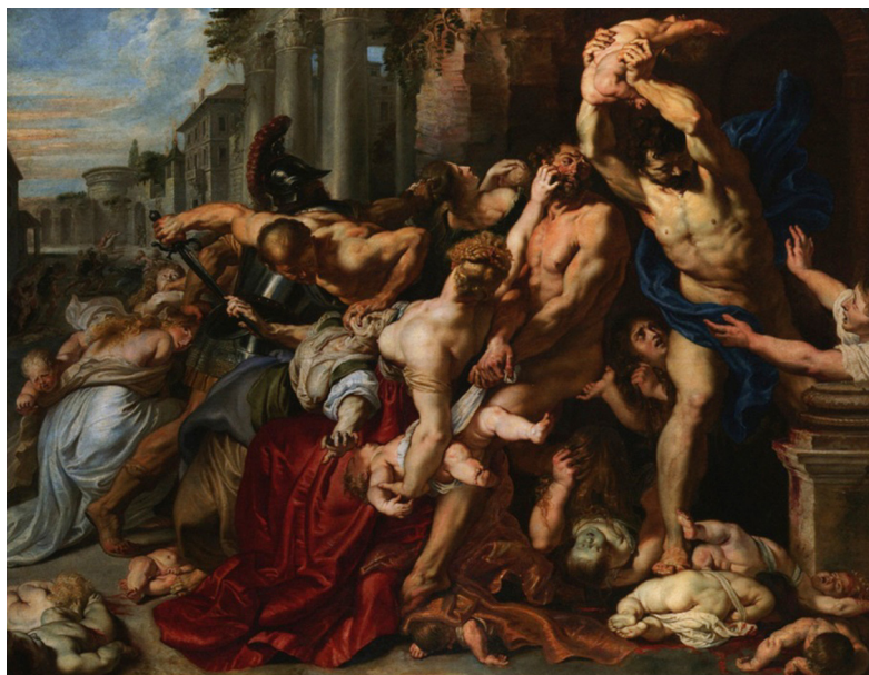
Ил. 5. П.-П. Рубенс. Избиение младенцев. Ок. 1611–1612 гг. Масло, дерево. Галерея искусств Онтарио. Торонто, Канада

«Щит итальянских поэтов» 21 , также выполненный А. Веште, входил в состав экспозиции Лепажа–Мутье на Лондонской выставке 1851 г. Именно тогда он был приобретен для музея Южного Кенсингтона (ныне музей Виктории и Альберта), где хранится по настоящее время. На этом примере можно не только увидеть «в материале» произведение столь высокого уровня, но и своеобразную визуализацию на темы итальянской ренессансной поэзии. Щит изготовлен из стали с помощью основных ювелирных техник – чеканки и гравировки. Орнаментация и фигуративные изображения покрывают всю его поверхность. Краевая часть щита выполнена в виде плоского кольца, декорированного чеканным растительным орнаментом и четырьмя медальонами с профильными портретами итальянских поэтов эпохи Ренессанса: Данте Алигьери (1265–1321), Франческо Петрарка (1304–1374), Лудовико Ариосто (1474–1533), Торквато Тассо (1544–1595). Основная часть щита представляет собой участок сферической поверхности, на котором выделяются четыре резерва, располагающиеся над портретными изображениями поэтов. В каждом из