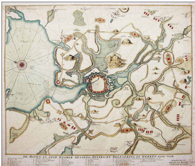
План осады Висмара. Гравюра 1716 г.

нии. Русский царь надеялся, что шведская империя, потерявшая в Северной Германии свою последнюю опору – Висмар, после перенесения войны на ее территорию вынуждена будет заключить мир. Мекленбург играл роль важного плацдарма для русских войск до тех пор, пока Карл XII не будет разбит на своей территории.