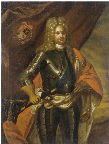
Генерал Н.И. Репнин

ре 1712 г. О стратегическом значении этой территории русского дипломата князя Б.И. Куракина в это же время предупреждал знаменитый имперский военачальник принц Евгений Савойский. Полководец заявил, что если шведские войска займут Мекленбург, то это приведет к их усилению. Поэтому неприятеля надо искать и принуждать к биталии. Когда, якобы, посланник прусского короля предупредил шведского генерала Стенбока, что вступление его армии в Мекленбург будет расце-