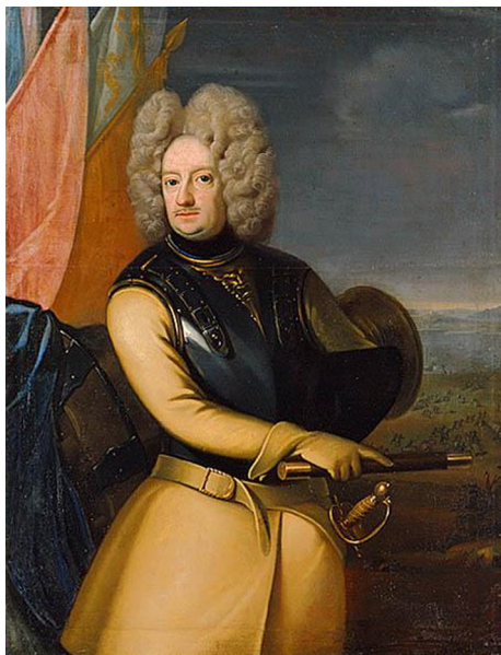
Шведский фельдмаршал Магнус Стенбок

ские войска занимали квартиры за реками Нёбель и Реквиц.