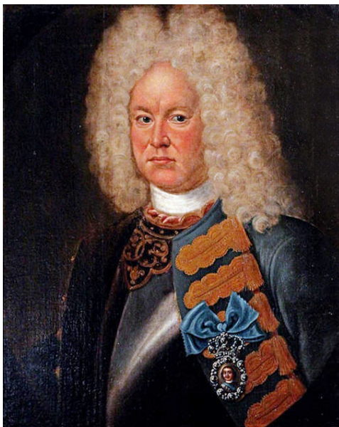
Генерал-поручик Р.Х. Боур

Параллельно с этими событиями велись переговоры о брачном союзе между новым мекленбургским герцогом Карлом Леопольдом и одной из племянниц царя. В 1714 г. к Петру I в Ревель прибыл герцогский посланник барон Г.Б. Габихтсталь с предложением заключить брачный договор между Карлом Леопольдом и вдовствующей курляндской герцогиней Анной Иоанновной (дочерью покойного брата и соправителя русского государя Иоанна V Алексеевича).