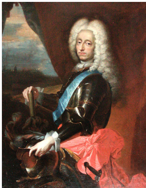
Датский король Фредерик IV

Отвлечение основных сил стран – участниц антишведской коалиции – России, Саксонии и Польши (Речи Посполитой) – на войну с Турцией весной – летом 1711 г. сказывалось и на обстановке в Германии. Датский король Фредерик IV, вновь вступивший в войну после Полтавской победы, был разбит шведами 28 февраля 1710 г. у Хельсингборга. Под предлогом отсутствия средств на формирование новой армии король всячески уклонялся от испол-