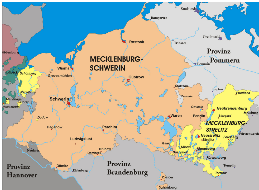
Мекленбург-Шверинское герцогство в начале XVIII в.