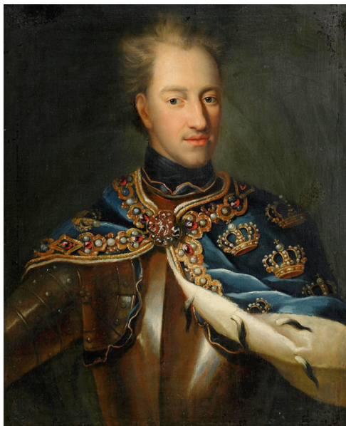
Шведский король Карл XII

Датский флот тем временем одержал победу у Фемарна, а затем у Бюлка. После этого Пруссия и Ганновер, захвативший шведские владения Бремен и Верден, заключили с Данией союзный договор. В конце декабря 1715 г. союзная русско-датско-саксонско-прусская армия под командованием прусского генерал-фельдмаршала Леопольда Анхальт-Дессау взяла Штральзунд.