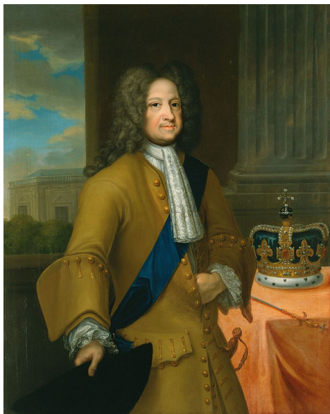
Король Великобритании и курфюрст Ганновера Георг I

ских торговых кораблей, примет участие в военных действиях и прикроет высадку десанта в Скании. Английский король Георг I одновременно являлся и ганноверским курфюрстом, поэтому его очень волновало, кто будет править в Северной Германии после изгнания оттуда шведов. Он был напуган возросшим русским влиянием в Мекленбурге, граничащем с Ганновером. Кроме того, воинственно настроенная мекленбургская знать пользовалась