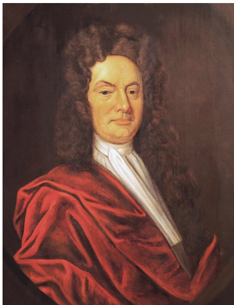
Премьер-министр по ганноверским делам А.Г. фон Бернсторф

Члены «хунты» распространяли слухи, что Петр намерен включить Мекленбург в состав России, хотя у царя не было планов присоединить герцогство к своим владениям. Напротив, мекленбургские порты хорошо вписывались в его планы на будущее России в качестве посредника в торговле между Востоком и Европой. Азиатские и российские товары со складов в мекленбургских портах было легко переправлять по Эльбе для продажи на огромном центральноевропейском рынке.