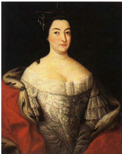
Герцогиня Екатерина Ивановна Мекленбург-Шверинская

Находившемуся в незавидном положении герцогу выбирать не приходилось. 22 января 1716 г. в Петербурге был составлен брачный договор. Герцог Карл Леопольд обязался предоставить своей супруге свободное отправле- ние веры греческо- го исповедания, также и всем ее служителям, и назначить место для построения « надворной капеллы » (т. е. домово- вой церкви); обязался еже- годно выплачивать ей по 6000 ефимков шка- тульных денег и давать содержание придвор- ными служителям; в