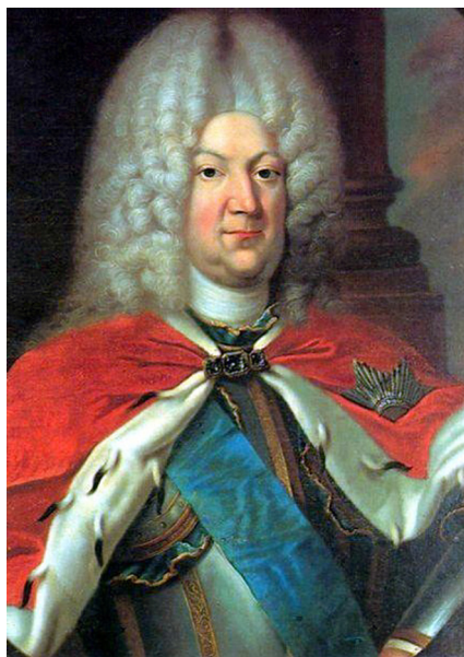
Герцог Карл Леопольд Мекленбург-Шверинский

На престол вззошел 35-летний младший брат покойного – Карл Леопольд 16 , который до этого принимал участие в военных походах шведского короля Карла XII. Мекленбуржец не только восхищался шведским абсолютным монархом, но и подражал ему в одежде, жестикуляции и манере речи. Вскоре он прослыл чудаком, за что принц Евгений Савойский называл его «обезьяной Карла XII». Кроме того, новый герцог