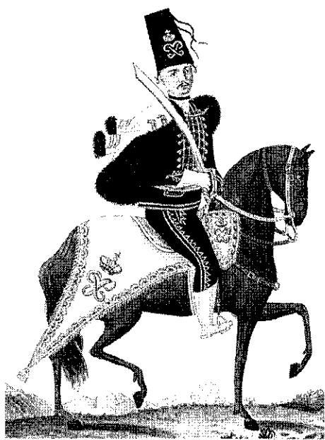
Офицер гусарского полка фон Цобельгитца. 1762. Раскрашенная литография 1820-х гг. Собрание ГЭ

за комплектом (поэтому их в будущем ихватило на все музеи и частные коллекции). А собственно лейб-драгунских гренадерок из белого и селадопового сукна не сохранилось, по-видимому, ни одной. То же относится и к офицерским патронным сумам из белого сукна с золотой вышивкой – это не лейб-драгунские вещи, а принадлежности экипировки гренадерского батальона, впоследствии – пехотного полка бригадира фон Цоймерна.