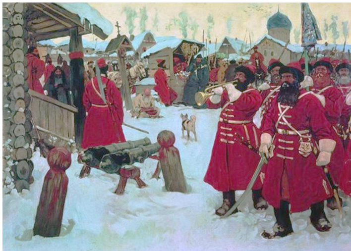
Ил. 6. Стрельцы. Художник С.В. Иванов, 1907 г.

героической обороной Псков «спас Россию от величайшей опасности, и память сей важной заслуги не изгладится в нашей истории, доколе мы не утратим любви к отечеству и своего имени» 6 .