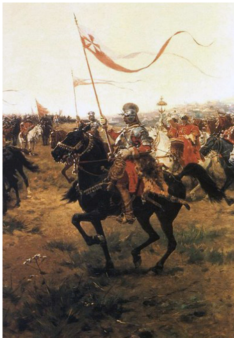
Ил. 3. Гусар. Художник Ю. Брандт, 1890 г.

Поместная русская конница оказалась меньше затронута военными преобразованиями царя Ивана IV, хотя после 1550 г. ее вооружение и обмундирование немного улучшились. Тем не менее, по своему содержанию она по-прежнему тяготела к татарскому типу легкой конницы, которая была вооружена луками, маленькими копьями и саблями. Отличительной чертой ее тактики являлись в основном быстрые налеты и неожиданные нападения, а не крупные сражения. Единственный крупный бой в ходе торопецкой операции показал неспособность помест-