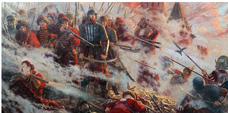
Ил. 1. Стрелецкий бой

сведениям польско-литовских очевидцев Ливонской войны, стрельцы и другие подразделения русской пехоты постоянно демонстрировали способность к упорному сопротивлению, особенно во время осад.