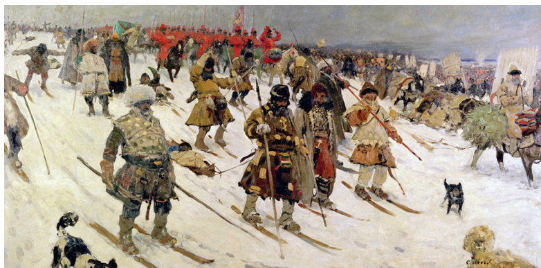
Ил. 4. Поход москвитян. XVI век. Художник С.В. Иванов, 1903 г.

В период Ливонской войны на боевые действия мало влияла и смена сезонов года. Хотя отдельные иностранные наблюдатели иногда пребывали в полной растерянности, не понимая, как в такой обстановке вообще можно вести войну. Например, изумленный посол Турции, оказавшийся в польском лагере под Псковом осенью-зимой 1581 г., советовал султану ни в коем случае не выводить свои войска и не испытывать их морозом. Но в период Ливонской войны такие операции для противоборствующих сторон были уже обычным делом.