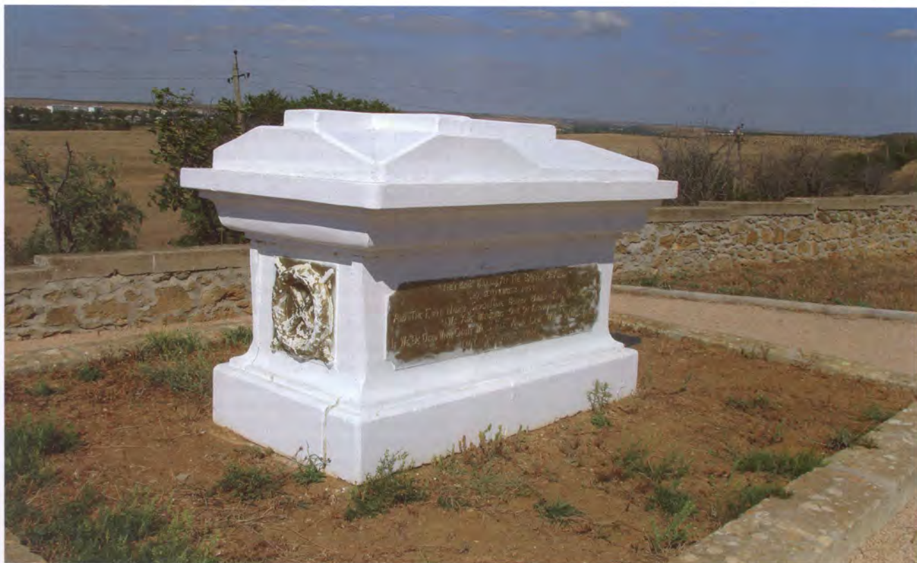
Мемориал, посвященный Альминскому сражению. Памятник-саркофаг павшим англичанам привезен из Англии и установлен на братской могиле в 1877 году. Фото С.Клименко. 2011