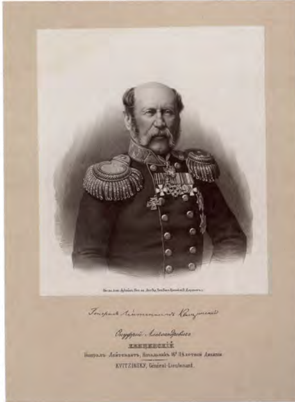
Генерал-лейтенант О.А.Квицинский, начальник 16-й пехотной дивизии. Литография конца 1850-х годов. ГМТ

21 Огонь французских войск был отвлечен тремя батареями, действовавшими под начальством генерал-лейтенанта Квицинского , и Углицкий полк, с того времени как достиг вершины горы, не подвергался выстрелам.