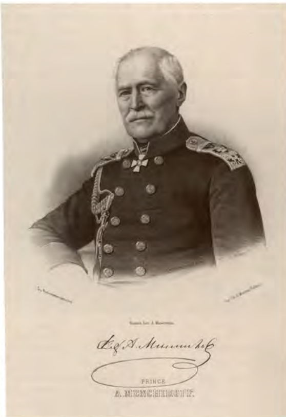
Адмирал, светлейший князь А.С.Меншиков, командующий русской армией. Литография конца 1850-х годов. ГМТ

Прежде ежедневно для наблюдения за неприятелем высылались на мыс Улукул один батальон с четырьмя орудиями, а к старому татарскому укреплению одна рота, но 8-го числа утром, когда стали приближаться неприятельские пароходы, эти посты были сняты и на место их послан 2-й батальон Минского полка к деревне Аклес, а мыс оставлен был вовсе без наблюдения.