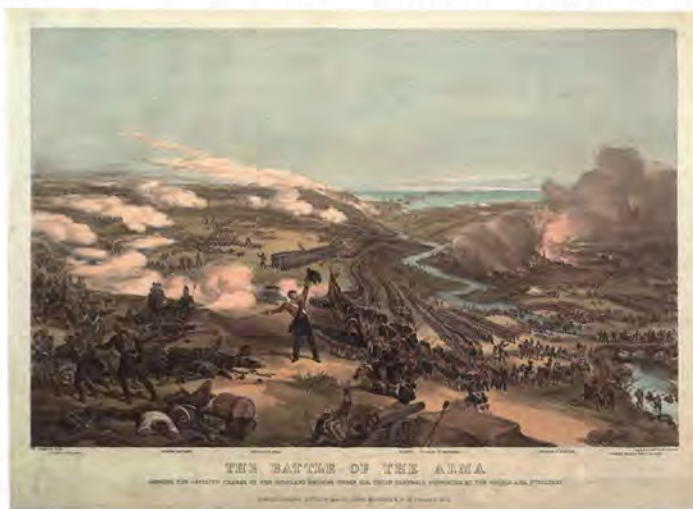
Битва на реке Альме. Атака шотландской пехоты. Гравюра

В некотором расстоянии, за телеграфом, были остановлены войска генерала Кирьякова , которые встретили дивизию Наполеона довольно сильным огнем, но не на подъеме, а уже на вершине горы. Тотчас же после этого последовала общая атака всех трех французских дивизий, бывших на высотах левого берега, что заставило отступить всю линию наших войск, расположенную от телеграфа до левого фланга включительно. Маршал Сент-Арно прибыл на высоты вслед за дивизией принца Наполеона и, как только войска овладели телеграфом, получил известие о том, что атака англичан отбита и что они находятся в затруднительном положении. Чтобы подать скорейшую помощь союзникам, французский главнокомандующий приказал одной из своих бата-