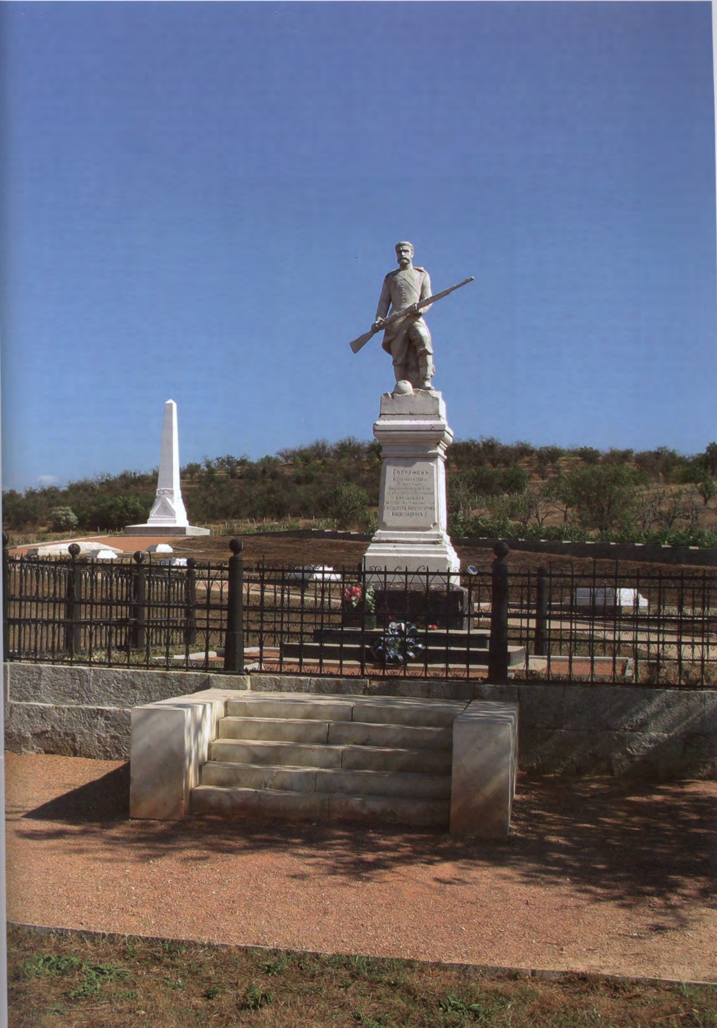
Мемориал на месте Альминского сражения. На первом плане — памятник воинам Владимирского полка. Сооружен в 1902 году. На втором плане — памятник-obelisk русским воинам, павшим в сражении. Выполнен в 1884 году. 2011