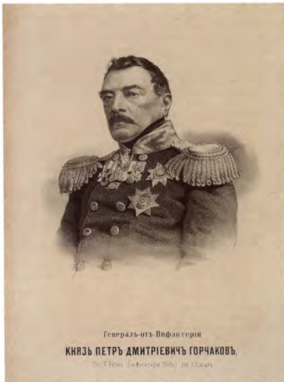
Генерал от инфантерии, князь П. Д. Горчаков. Литография конца 1850-х годов. ГМТ

Главкомандующий Сент-Арно медлил наступлением остальных войск, пока первый выстрел французской артиллерии, раздавшийся на вершине высот нашего берега, не убедил его в том, что обходное движение колонны Боске удалось вполне, сверх всякого ожидания. Тогда остальные неприятельские войска атаковали нас с фронта. Заметя удачу колонны Боске и не будучи в состоянии одновременно с французами совершить обход нашего правого фланга, а равно и потому,