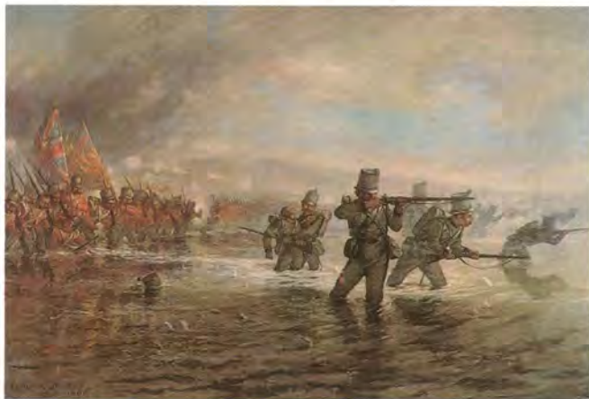
Англичане форсируют Альму. Литография с картины Л. Джонса

При первом взгляде, нас поражают три обстоятельства, которые и были главной причиной как неуспеха, так равно и большей потери с нашей стороны. Первое то, что