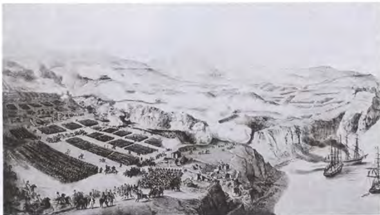
Сражение на реке Альме. Литография

Как было определено, в 5½ часов вдоль морского берега двинулась колонна Боске 8 . Более часа прошло после того, а в английском бивуаке не было заметно никакого движения. Французский главнокомандующий, послав узнать о причине промедления к лорду Раглану , оста-