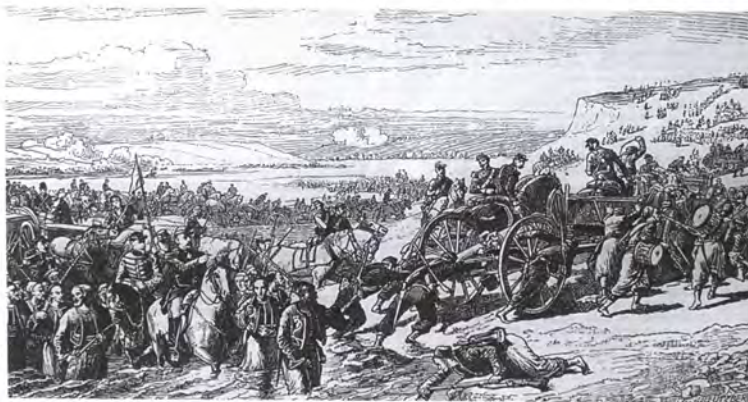
Французская дивизия генерала Боске форсирует Альму. Гравюра с картины И. Пилса

Англичане между тем снова устремились к мосту. Две английские бригады занимали уже сады между деревнями Бурлюк и Тарханлар и оттуда могли совершить переправу вброд тем удобнее, что в этом месте войска наши (Суздальский полк) были значительно удалены от реки, и только две роты 6-го стрелкового батальона могли встретить батальным огнем переправу за холмом. Переправясь здесь, а равно и ниже моста, где тоже были броды, англичане удобнее могли бы овладеть эполементом, но они упорствовали в намерении переправиться прямо через мост и тем дали