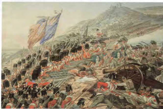
Победа при Альме. 1854. Литография с картины Э. Уолкера

Сады, окруженные каменными оградами, давали неприятелю столько удобств к защите, что мы лишены были