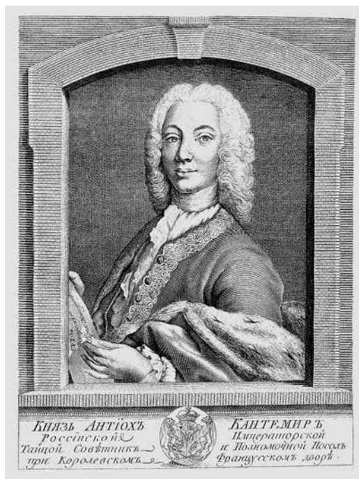
Ил. 4. Князь Антиох Кантемир. 1792 г. Гравюра с оригинала Я. Амигони 1735 г.

К началу XX в. легендарная надпись уже считалась утраченной. В «Путеводителе по Волге» за 1903 г. сообщалось, что петровский камень с датой «1720» уже не существует 31 . Автор другого волжского путеводителя уточнял, что виной тому туристы, которые разобрали весь камень «на память» 32 .