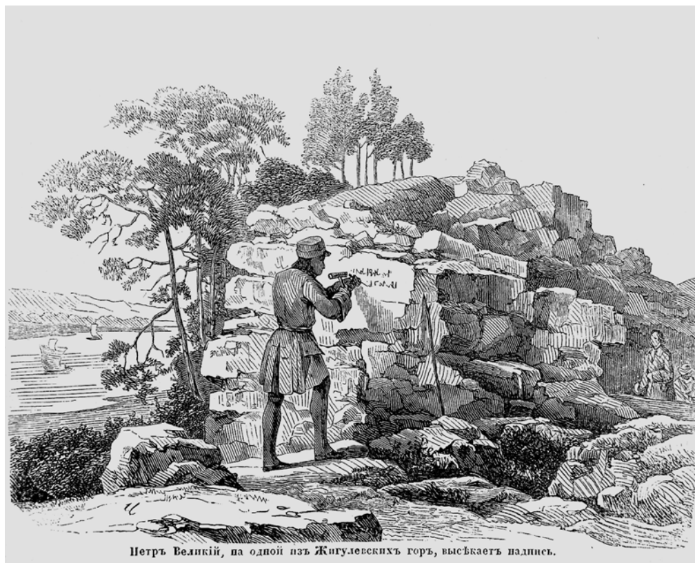
Ил. 2. Н. Г. и Г. Г. Чернецовы. Петр Великий на одной из Жигулевских гор. 1838 г. Рисунок. Из издания: Иллюстрация. 1845. Т. 1

надписи» 21 . Далее сообщалось, что по приказанию Симбирского губернатора надпись была скопирована и ныне хранится в его канцелярии. Увы, нам остается только сожалеть о том, что редакция журнала не получила из губернаторской канцелярии копии надписи с Лысой горы: публикация таковой дала бы ответ на многие вопросы.