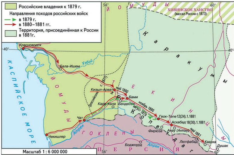
Ил. 2. Ахалтекинские экспедиции 1879 и 1880—1881 гг.

собой неправильный четырёхугольник, окружённый двумя рвами. Перед стенами крепости «близ наружного вала были установлены шесть рядов сплошных кибиток, наполненных землёй», позади которых «вновь ров и бруствер». Генерал Ломакин обращал внимание на то, что текинцы «даром выстрелы не пускают» и оказывают «невероятное сопротивление, вполне достойное лучших европейских армий», поэтому русский отряд (1804 штыка) при штурме крепости понёс большие потери, превысившие 25 % личного состава. По мнению Ломакина, неудача в Геок-Тепе была связана с отсутствием в русском отряде достаточного количества перевозочных средств, артиллерии и «всякого рода запасов», но положительным результатом похода стали «добытые, хотя и дорогою ценою», сведения, дававшие возможность предпринять новую «экспедицию на более точных данных» 18 .