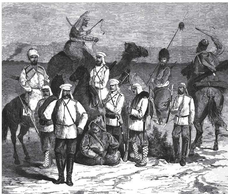
Ил. 4. Обмундирование участников экспедиции

недостаточно приспособленную к условиям местности пищу солдат, её дурное качество, отсутствие хорошей воды, сильную пыль и жар, недостатки санитарного надзора 31 . При заказе средств экспедиции было уделено внимание кухонной утвари для приготовления пищи и чая. Например, медные котлы должны были непременно иметь крышки 32 . Для выпечки хлеба были затребованы печи, отапливавшиеся нефтью 33 . Детально были рассмотрены вопросы, касающиеся особенностей обмундирования назначенных к походу частей. Например, для нижних чинов была признана необходимость наличия суконных фуражек с козырьком и белым чехлом с наатыльником, а кроме двух пар сапог, наличие одной пары поршней 34 «туземного образца» 35 . Для тёплого времени года «войска получили гимнастические рубашки из парусины, а на холодное время для них заготавливались фуфайки, полушубки, тёплые портянки и рукавицы» 36 (ил. 4).