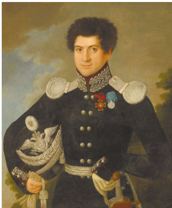
Лицевая сторона портрета после реставрации

В октябре 2020-го картина была передана в реставрацию художнику-реставратору Е. Е. Фремке.