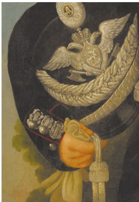
Фрагмент лицевой стороны после реставрации (изображение руки с перчаткой и с кивером)