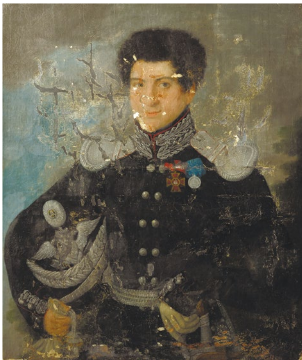
Лицевая сторона портрета до реставрации

Записи перекрывали сохранившиеся фрагменты авторской живописи и искажали авторский замысел, игнорируя и меняя границы изображения элементов. На участках с крупными утратами авторской живописи имела место ошибочная «реконструкция», а именно: свободное домысливание недостающих деталей. Примером воспроизведения на полотне несуществующих элементов военной формы может служить изображение двукратно удлинённых кисточек этишкета (длинного шнура кивера) и изображение перчатки в руке офицера, переиначенное до образа смятого обрывка ткани.