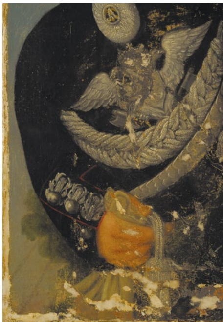
Фрагмент лицевой стороны в процессе реставрации (изображение руки с перчаткой и с кивером)