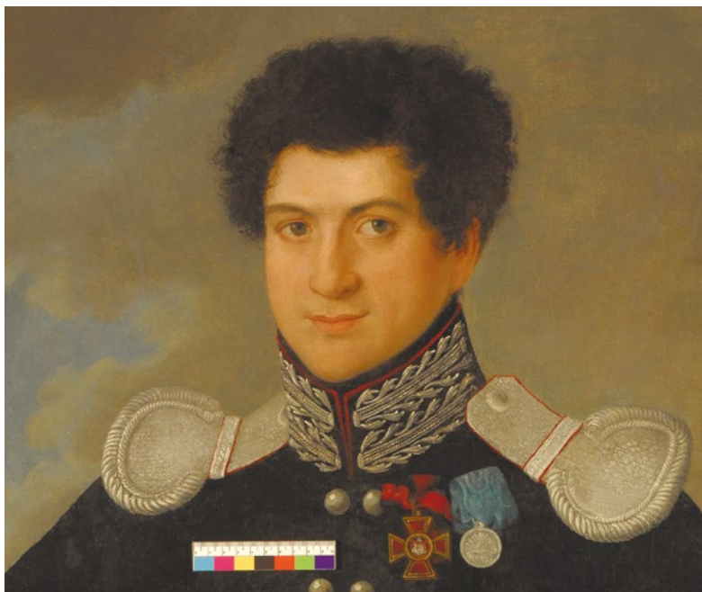
Фрагмент лицевой стороны после реставрации (изображение лица)

по уровню старые разноцветные перегрунтовки. Далее в рамках художественной реставрации было выполнено удаление остаточных записей с поверхности авторской живописи и покрытие картины лаком. Следующим и наиболее сложным этапом было восполнение утрат авторского красочного слоя с элементами реконструкции.