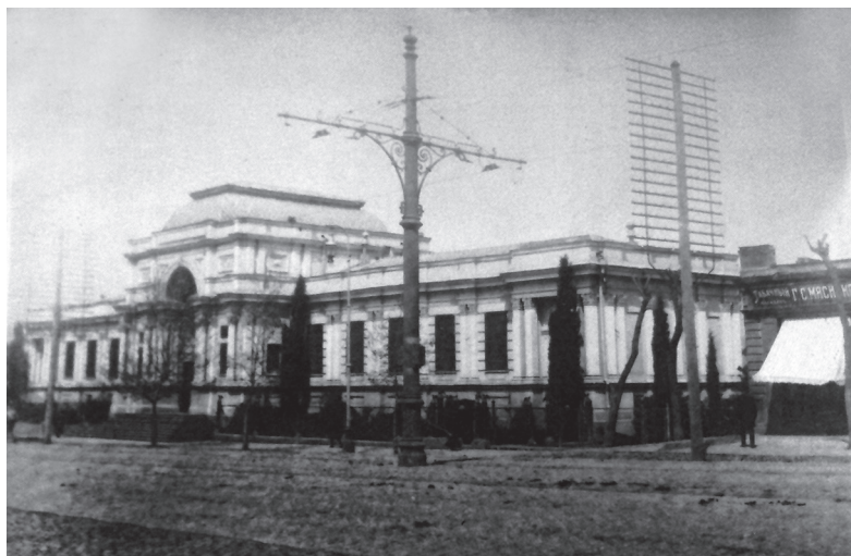
Ил. 1. Кавказский Военно-исторический музей (он же Храм Славы). 1885 г.

происходивший из рода бакинских ханов, так и не смог получить подтверждения своих прав на ханский титул, хотя верой и правдой служил России, был удостоен звания полковника русской армии, награжден орденами и медалями империи). С ликвидацией ханств Северного Азербайджана их знамена превратились лишь в исторический памятник, в качестве трофея подтверждающий могущество Российской империи.