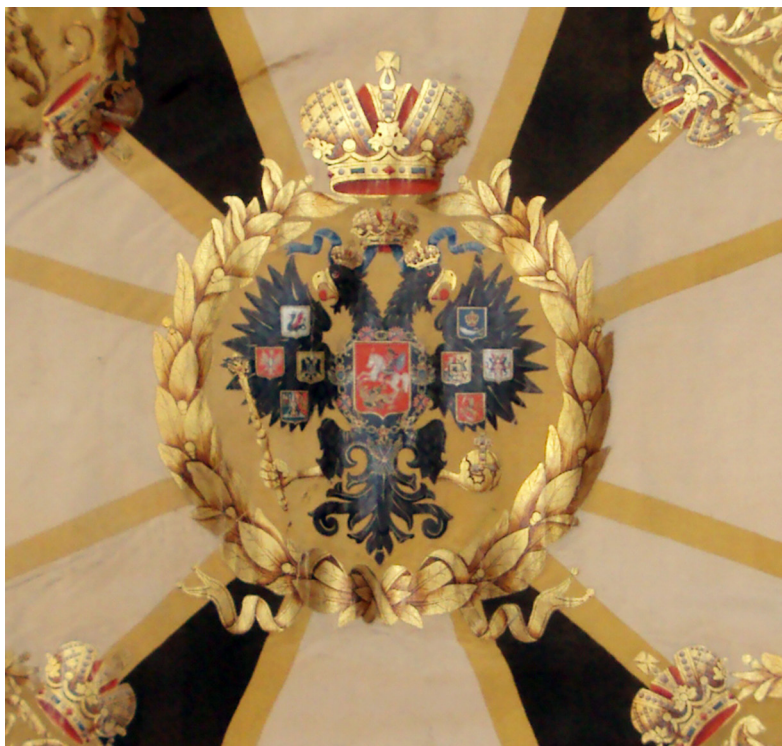
Ил. 9. Георгиевское знамя Закатальского иррегулярного конно-мусульманского полка. 1877–1878-е гг. (Азербайджан). Фрагмент

держит символ монархической власти, в правой лапе — скипетр и в левой — державу. На крыльях у орла изображены восемь гербов крупных царств и княжеств в составе Российской империи. На правом крыле размещены гербы Царства Астраханского, Польского, Херсонеса Таврического и соединенные гербы Киевского, Владимирского, Новгородского великих. На левом крыле изображены гербы царства Казанского, Сибирского, Грузинского, Великого княжества Финляндского. На груди орла изображен герб Москвы. От центра к краям полотна проходят черные и белые полосы, образуя крест. На четырех сторонах полотна, по частям размещена надпись «ЗА ОТЛИЧИЕ ВЪ ТУРЕЦКУЮ ВОЙНУ 1877 И 1878 ГОДОВЪ». В углах полотна изображен венок с короной, в котором размещен вензель императора Александра II.