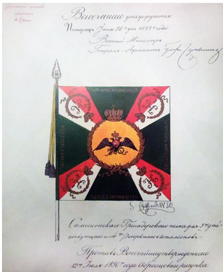
Ил. 5. Георгиевское знамя Самогитского гренадерского полка для 3-го действующего и 4-го резервного батальонов

атрибуты государственности, а также упомянутые знамена расформированных конно-мусульманских полков.