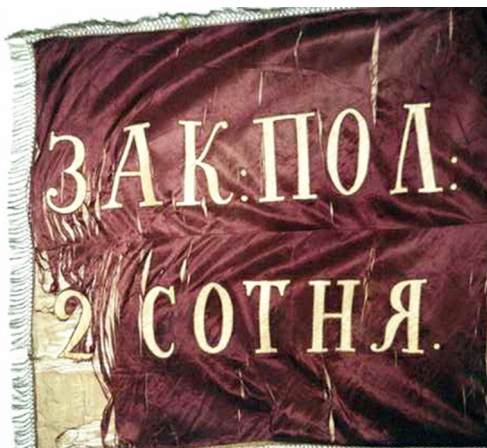
Ил. 8. Знамя 2-й сотни Закатальского конно-мусульманского иррегулярного полка

Вниманию читателей представляем краткое описание Георгиевских знамен. Первое полотно (ил. 5) четырехугольной формы, по центру в медальоне (венке) с короной на желтом фоне изображен двуглавый орел, увенчанный одной короной, на груди размещен герб Москвы. На полотне зеленого цвета от центрального медальона к углам проходят красно-белые полосы, образуя на полотне георгиевский крест. На зеленой части четырех сторон полотна по частям размещена надпись «За отличие въ 1807 году Противъ Французовъ и за Варшаву 25 и 26 августа 1831 года». В углах полотна изображен венок с короной, в котором размещен вензель императора Николая I. Навершие знамени имеет пикообразную форму, с размещенным внутри Георгиевским крестом.