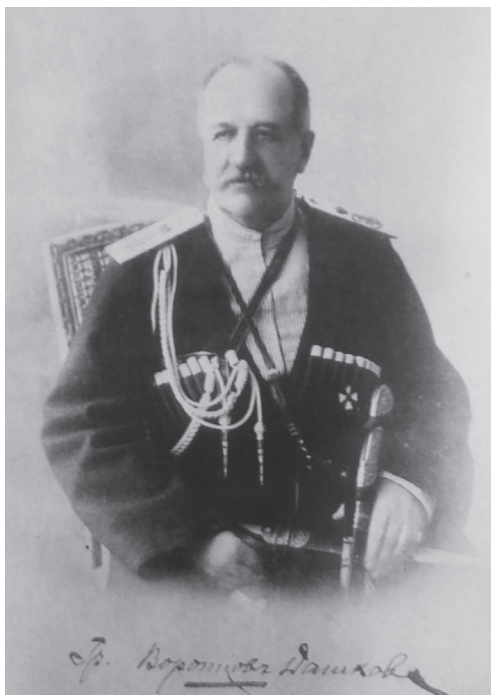
Ил. 3. Граф И.И. Воронцов-Дашков

Национальный совет принял Декларацию о независимости. За короткий период своего существования (23 месяца) республика добилась очень многого. Преобразования в области государственного строительства, экономики, образования, военного строительства были направлены на укрепление независимости страны. Одним из первых мероприятий было принятие атрибутов государственности. 21 июня 1918 г. был принят Государственный флаг Азербайджанской республики, с изображением