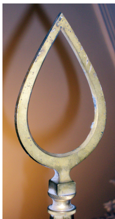
Ил. 7. Навершие Георгиевского знамени иррегулярного конно- мусульманского полка