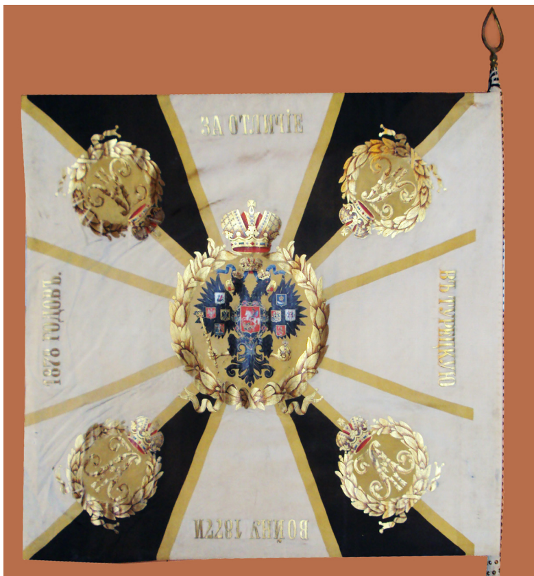
Ил. 6. Георгиевское знамя Закатальского иррегулярного конно-мусульманского полка. 1877–1878-е гг. (Азербайджан)

Вторая реликвия — Георгиевское знамя, врученное Закатальскому иррегулярному конно-мусульманскому полку за проявленную отвагу в годы русско-турецкой войны. Подразделение было сформировано в 1877–1878 гг. из мусульманского населения Закатальского округа. С той поры знамя хранится в знаменной коллекции Азербайджана, Музея истории Азербайджана, инв. № 470. Также в собрании имеются четыре знамени сотенных батальонов, входивших в состав вышеотмеченного полка. Знамя представляет собой одноцветное полотно бордового цвета с бахромой с трех сторон и надписью «ЗАК. ПОЛ. 2 СОТНЯ».