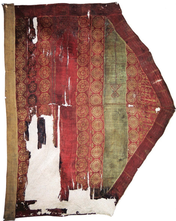
Ил. 6. Знамя Гянджинского ханства. Национальный музей истории Азербайджана. Фонд оружия и знамен. Инв. № 471

сельджуков давние традиции изображать животных на полотнищах и навершиях были вновь возрождены, поэтому на миниатюрах Азербайджана XIII–XVI вв. изображения фантастических и реальных животных не редкость.