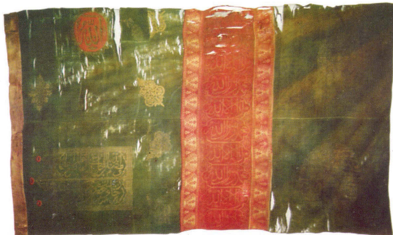
Ил. 7. Знамя Гянджинского ханства. Национальный музей истории Азербайджана. Фонд оружия и знамен. Инв. № 446

цветочные орнаменты с бордовыми контурами. Вторая, третья, четвертая и пятые полосы также имеют малиновое основание, на котором в синих восьмиугольниках восьмилепестковые орнаменты. Шестая, седьмая и восьмая полосы зеленовато-белого цвета украшены орнаментами и изображением подвешенной на цепях лампы. В раме из обрывистых линий размещены окантованные малиновой линией 16-лепестковые цветочные орнаменты бежевого цвета. На бордовом основании последней, девятой полосы бежевыми нитями вышито дерево, на симметрично расставленных ветвях которого изображены цветы и плоды граната. На верхушке дерева – две птицы. Древяно знамени изготовлено из дерева, его длина составляет 275 см, диаметр в разрезе 9,5 см. На древяно надето составное металлическое навершие, состоящее из двух приваренных друг к другу частей. Высота навершия 40,5 см, оно изготовлено из металла способом чеканки. Верхняя часть навершия представляет собой четырехгранное копые.