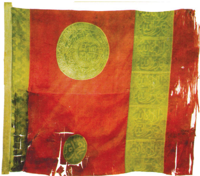
Ил. 8. Знамя Гянджинского ханства. Национальный музей истории Азербайджана. Фонд оружия и знамен. Инв. № 447

полосу пришиты два овальных картуша в виде медальона. Они состоят из различных орнаментов и надписей на арабском языке. Верхний медальон состоит из трех полумесяцев, концы которых, смыкаясь, образуют в центре круг. Расположенные по центру полумесяц и круг содержат арабские надписи, остальные два полумесяца украшены противоположно направленными пшеничными колосьями. В центральном круге и полумесяце имеются надписи на арабском языке (нанесенные репсовой вязкой) следующего содержания: «Помощь от Аллаха и близкая победа»; «Аллах оберегает»; «Аллах помогает»; «Мухаммед, награди верующих». В нижнем овальном картуше по-арабски надписано имя пророка Мухаммеда. Крайний полумесяц состоит из двух колосьев, четырех полумесяцев и четырех пятилепестковых цветов. Самый малый полумесяц состоит из повторяющихся четырежды четырехлепестковых цветов и одного полумесяца, а изображенные колосья повторяются, как у предыдущего. Следующая зеленая полоса, составленная из золотистой колонны на зеленом фоне, содержит вертикально выстроенные 10 картушей с фигурными