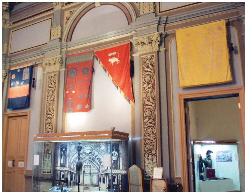
Ил. 1. Экспонирование знамен Азербайджанских ханств XVIII–XIX вв. в Европейском зале на втором этаже Национального музея истории Азербайджана. 2015 г.

знамени Гянджинского ханства, а еще одно – в Гянджинском историко-краеведческом музее имени Низами Гянджеви 3 .