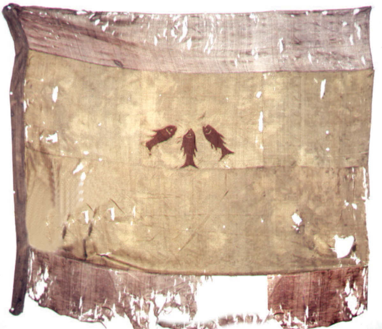
Ил. 2. Штандарт Джавад хана Гянджинского. Национальный музей истории Азербайджана. Фонд оружия и знамен. Инв. № 448

6-ти фальконетах, в 1-м штандарте, 8-ми знаменах, в 55-ти пудах пороху и в большом хлебном запасе» 6 . Таким образом, становится ясно, что русскими войсками в Гяндже были взяты один штандарт и восемь знамен. Далее ознакомимся с их описанием 7 . (7) Знамя Гянджинского ханства (штандарт Джавад хана) из коллекции Национального музея истории Азербайджана (НМИ) (фонд оружия и знамен, инв. № 448) (ил. 2) состоит из полотнища, древка и наверхия. Полотнище имеет прямоугольную форму с размерами 155 × 119 см и состоит из горизонтальных полос трех цветов, изготовленных из шелковой ткани типа ткани «саржа». По центру верхней части пришиты аппликации из трех рыб, изготовленные из коричневого льна. Рыбы размещены так, что смотрят вверх в разные стороны, веером. Древко изготовлено из дерева, длина его 232 см, диаметр в разрезе 2,9 см. На древко надето серебряное наверхие, верхняя часть в форме «хамсы» – раскрытой ладони – приварена к конусообразной втулке (ил. 3, 4).