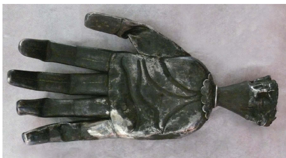
Ил. 3, 4. Серебряное навершие штандарта Джавад хана Гянджинского. Национальный музей истории Азербайджана

Наружная часть руки украшена клетчатым узором. Ладонь содержит узоры человеческой руки 8 .