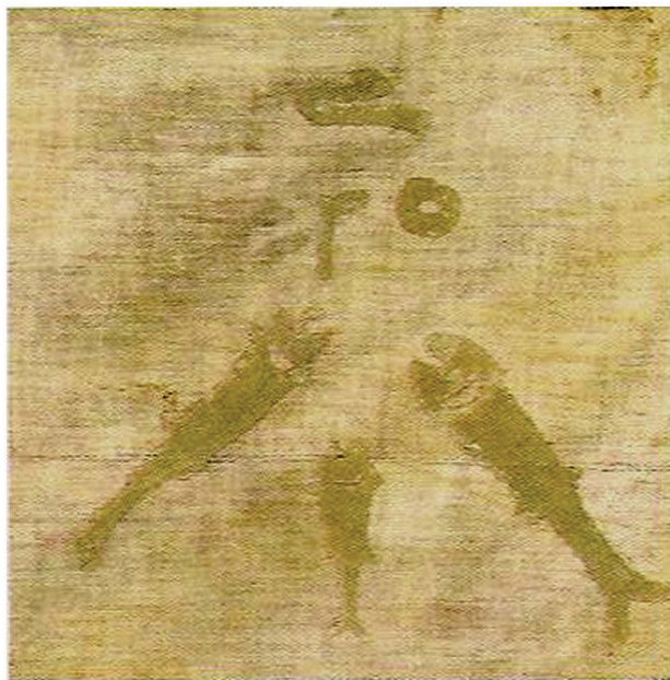
Ил. 5. Знамя 25-го османского пехотного полка. Мемориальный музей А. В. Суворова, Санкт-Петербург

живых существ на коврах, подушках, тарелках считалось допустимым (исключение – фигуры людей и животных), а к некоторым праздникам разрешалось изготавливать фигурки животных, но после праздников запрет вновь вступал в силу. Допускалось изображение животного с каким-либо дефектом (например, если изображать льва на ткани или ковре в профиль, он выглядит одноголазым, и такое изображение не запрещалось, так как было далеко от реальности). Таким образом, тезис советской историографии о том, что, изображая живые существа, средневековый художник якобы протестовал против господства ислама, не выдерживает критики. Изображения зверей восходят к древним тотемистическим верованиям как кочевых, так и земледельческих народов, но с течением времени их восприятие изменялось 15 . Уже в ранние периоды ислама изображения потеряли свое специфическое культовое значение тотема и божественного символа. Однако определенная идеологическая нагрузка сохранилась, не случайно имам Али сравнивался со львом. С приходом