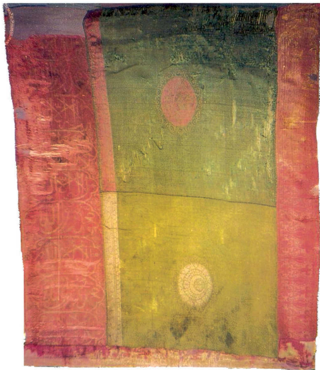
Ил. 9. Знамя Гянджинского ханства. Гянджинский историко-краеведческий музе им. Низами Гянджеви. Инв. № 2988

куполов, вершины которых устремлены к древку. Вершины куполов завершаются красными полумесяцем и звездой, которая условно обозначена как шар 19 . В верхнем картуше арабской графикой золотистыми буквами написано: «Аллах бойцов во время битвы ставит выше сидящих дома». В нижнем картуше тем же шрифтом и цветом написано: «Аллах, не разделяя их, простит им грехи и дарует им степени для приближения к Аллаху. Аллах милостливый, прощающий». На полотнище отдельно вышиты золотистые круги, составленные из различных растительных орнаментов, арабских надписей и полумесяца. На изображенном полумесяце имеется следующий текст: «Помощь от Аллаха и близкая победа»; «Аллах оберегает»; «Аллах помогает»; «Мухаммед, награди верующих».