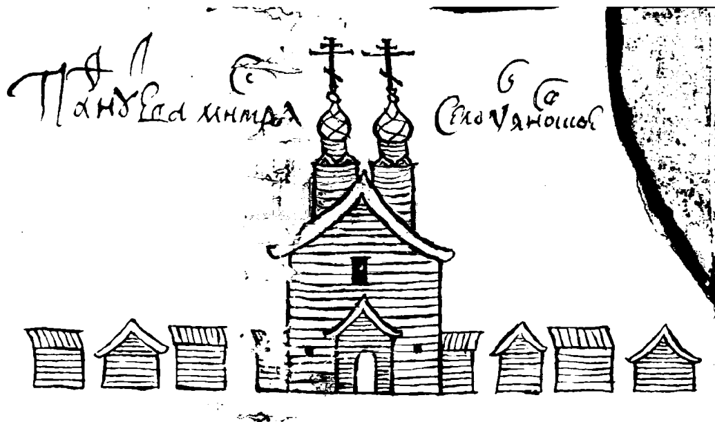
Рис. 1. Фрагмент чертежа территории Пафнутьева монастыря села Ульяновское (РГАДА, ф. 1209, оп. 77, Тверь, ед. хр. 40875, ч. 2, л. 74).

ческое представление? Очевидно, нет. Изготовление чертежа как элемента, необходимого для рассмотрения определённого рода споров о земле (когда права на землю подтверждаются «третейскими записями», сделанными после валового письма 1620-х гг. и не зарегистрированными в Поместном приказе, при том, что «третьи померли»), стало обязательным только в 1686 г., и то лишь в случаях невозможности разобрать спор на месте («а буде им зачем в таких землях указу чинить немочно, и о том писать, и розыски и чертежи тем землям присылать к Москве») 12 . Они не имели строго определённого места внутри столбца, их исполнение было разнообразным, полнота представляемой информации неравномерна. Законодательные документы — писцовые указы — также не сохранили в себе соответствующих инструкций и пояснений. Наличие весьма различающихся элементов изображения зданий, масштабов, приёмов — всё это говорит о том, что разработка шаблона графического отображения местности находилась ещё в начальной стадии. Шаблон не приобрел того стандартизованного вида, который мы видим несколько позже — в середине XVIII в., во время Генерального межевания.