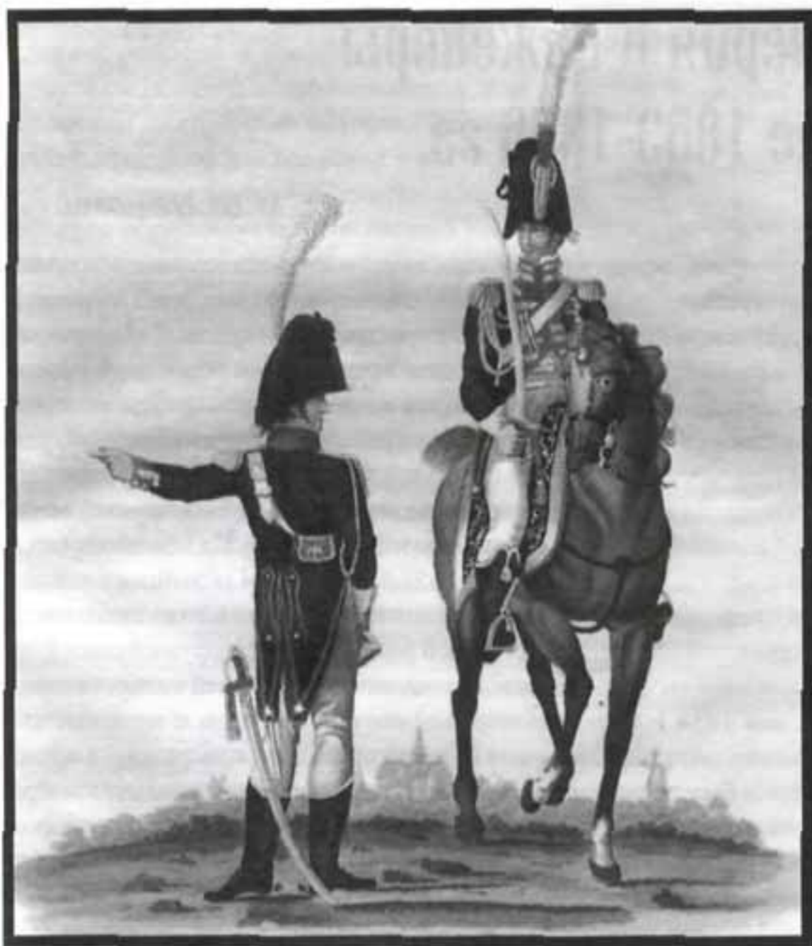
Почетная гвардия в Дордрехте (планшет № 5)

мандовал Жакоб. В пехоту Почетной гвардии Роттердама входили: лейтенант; 2 су-лейтенанта; старший сержант; 3 сержанта; 4 капрала; барабанщик и 46 гвардейцев.