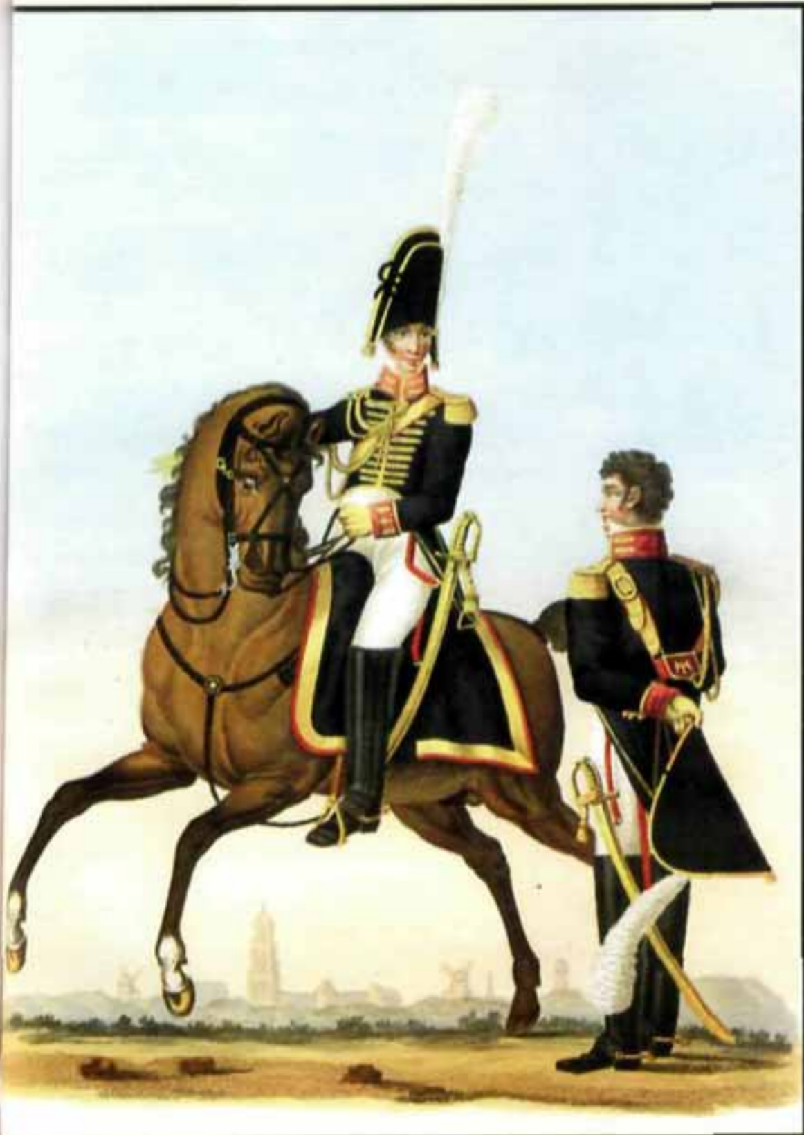
Почетная гвардия в Утрехте. Кавалерия