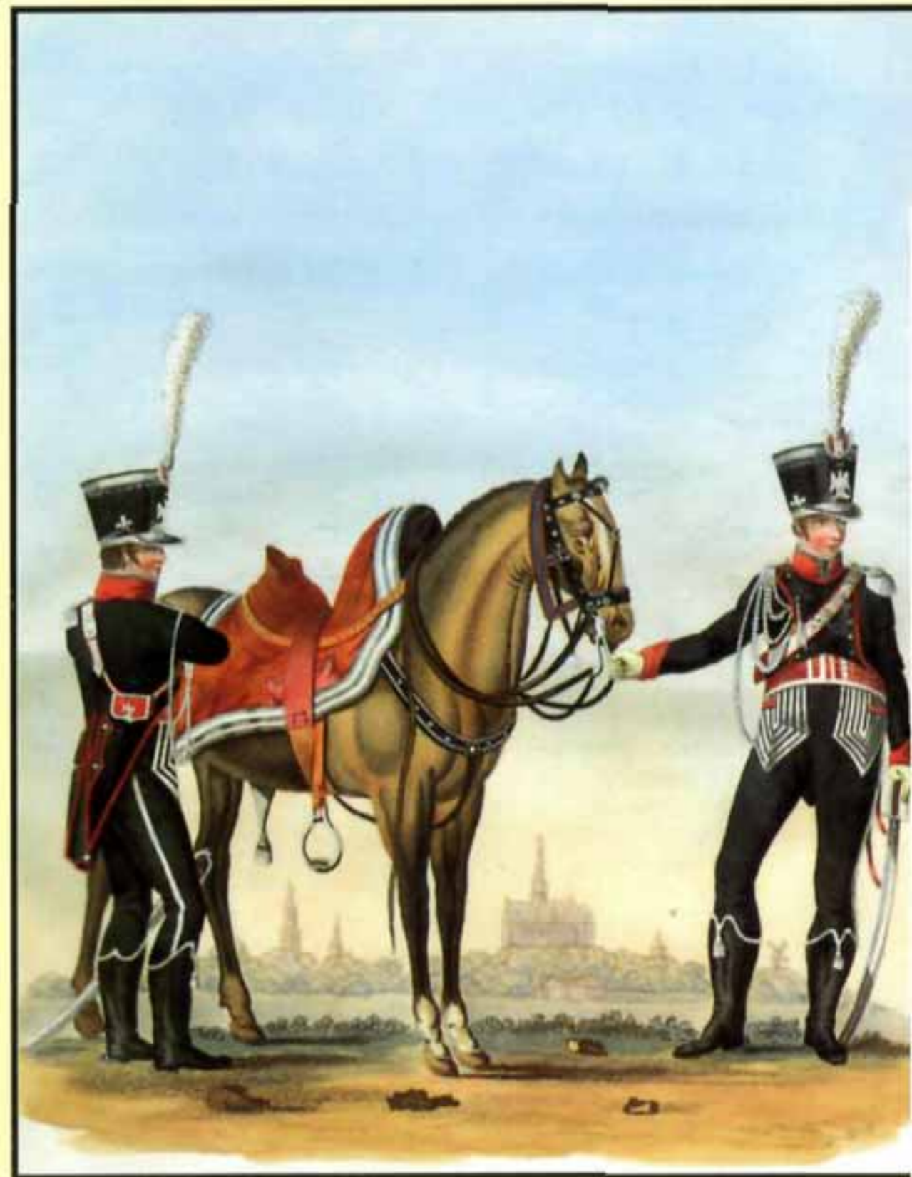
Почетная гвардия в Харлеме. Кавалерия