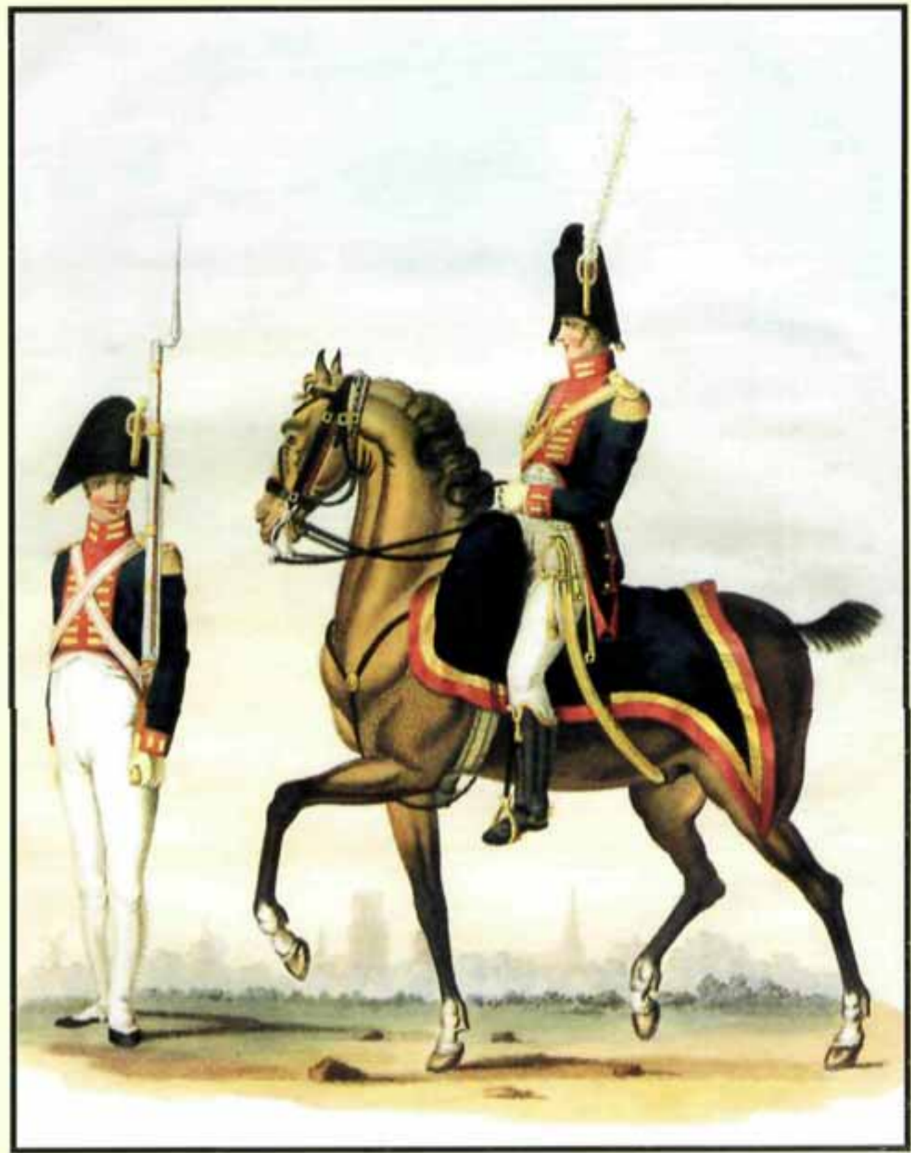
Почетная гвардия в Роттердаме. Кавалерия и пехота