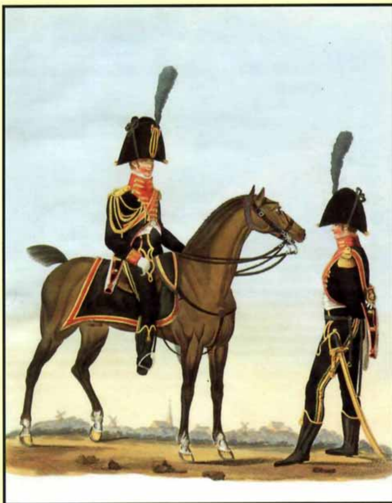
Почетная гвардия в Дрентхе. Кавалерия