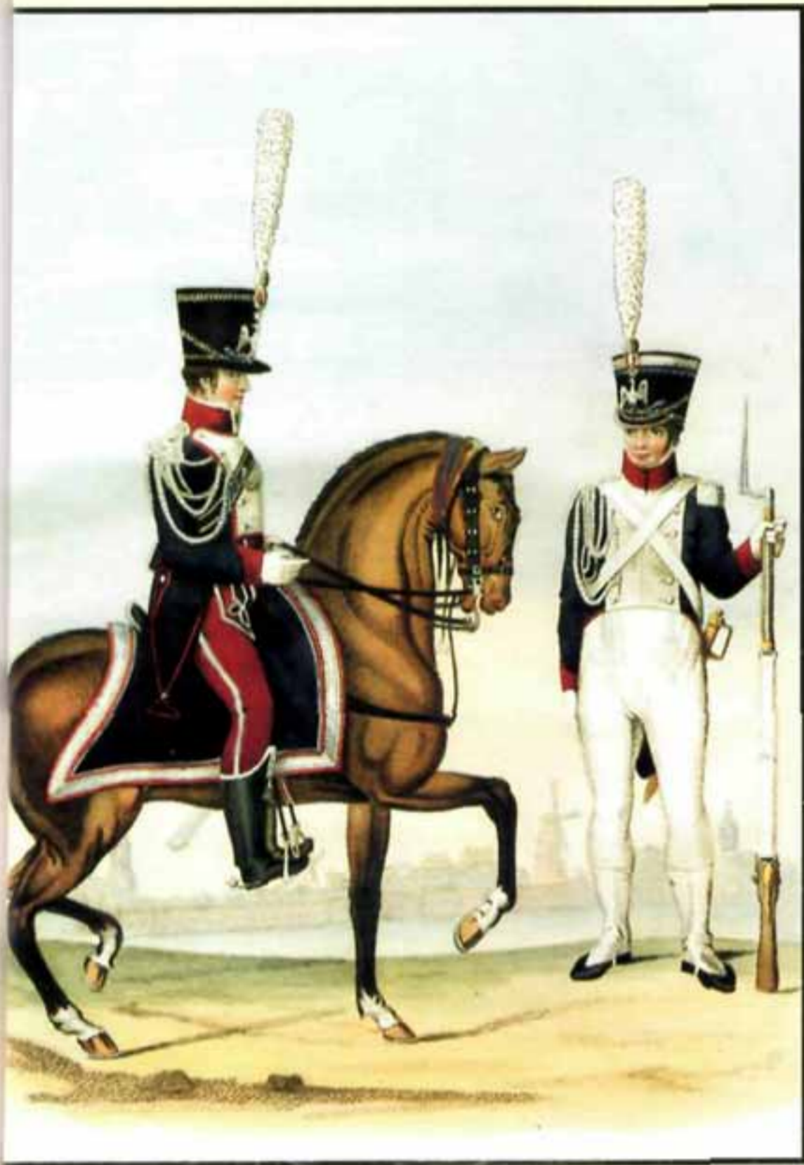
Почетная гвардия в Амстердаме. Кавалерия и пехота