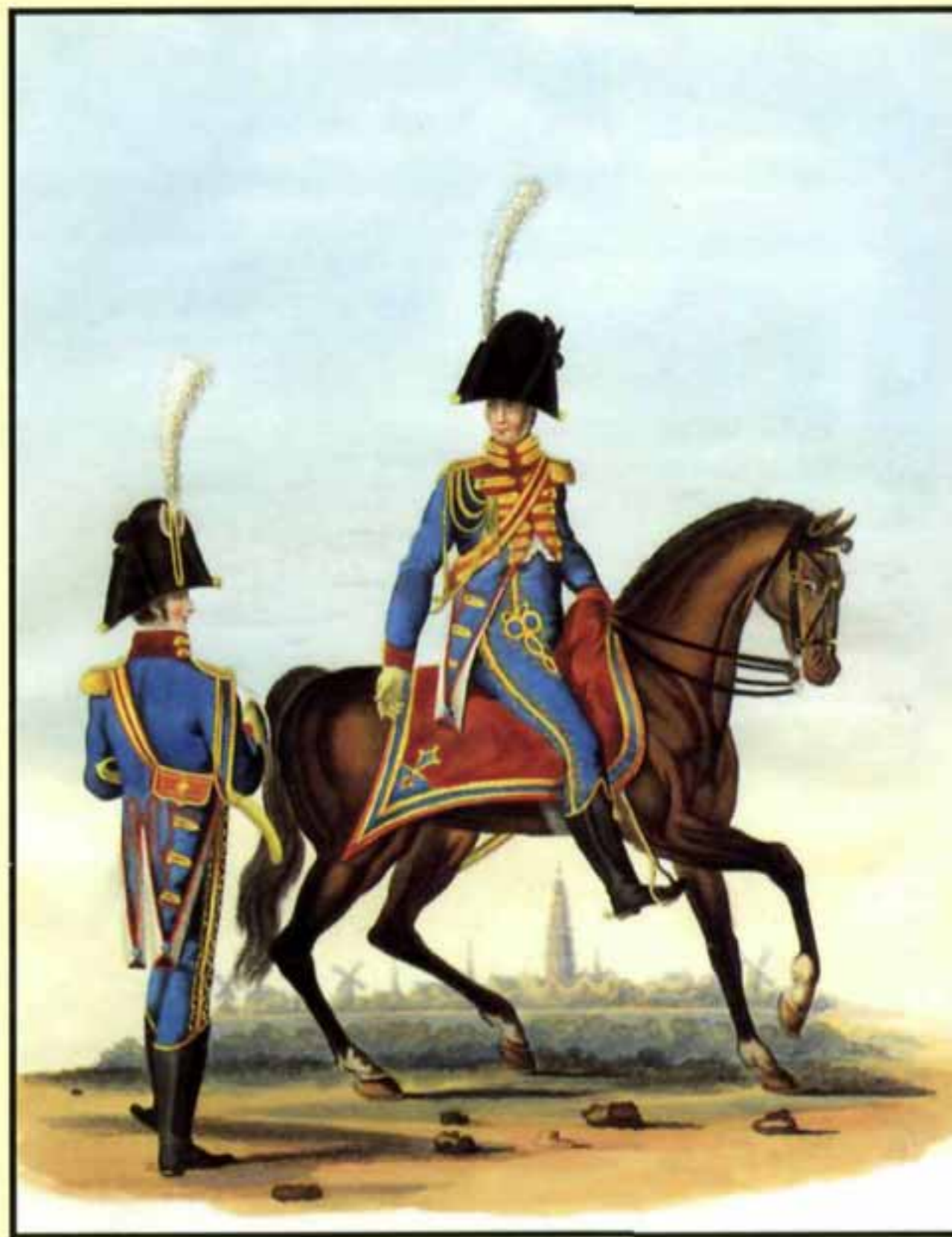
Почетная гвардия в Гронингене. Кавалерия