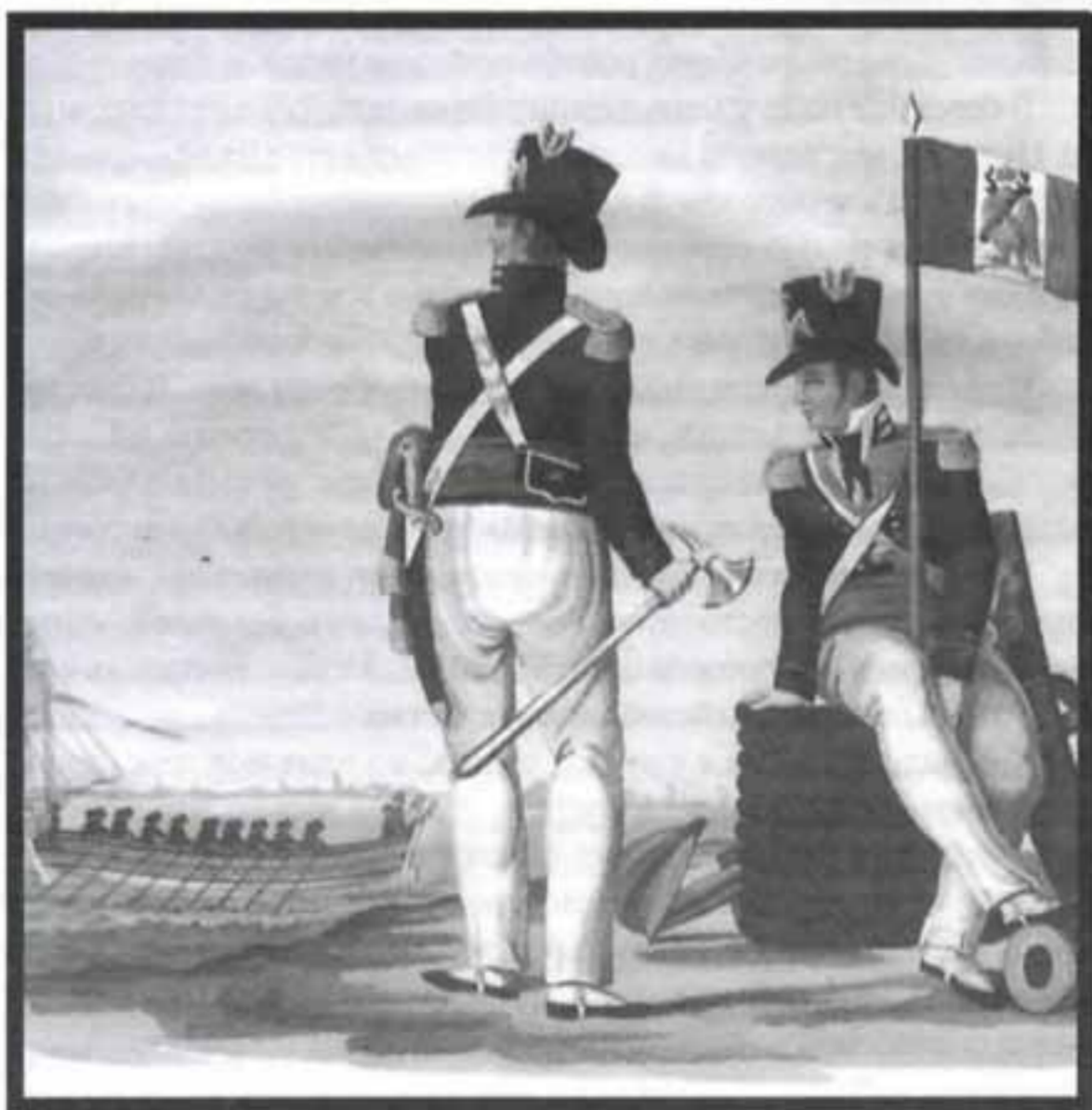
Морская Почетная гвардия в Амстердаме (планшет № 1)