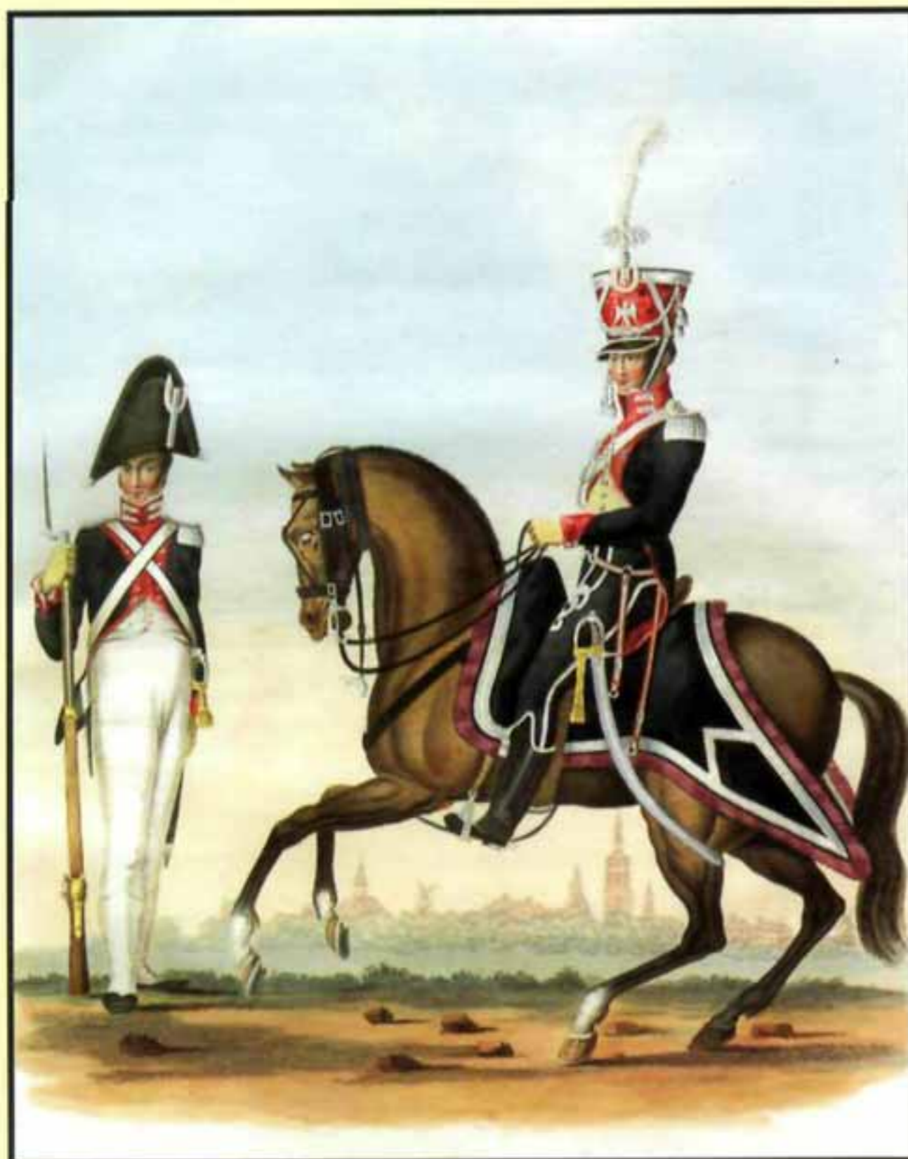
Почетная гвардия в Гааге. Кавалерия и пехота