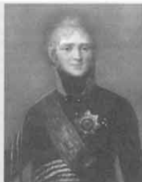
Российский император Александр I

дос. Самому же адмиралу приказали возвращаться с флотом в Россию.