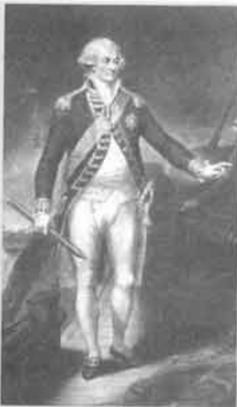
Адмирал британского флота А. Дункан, которому контр-адмирал М.К. Макаров оказал содействие по усмирению бунта английских моряков у острова Тексель

верном море у о. Тексель. Кроме совместных операций против французов и голландцев, Макаров оказал британскому правительству важные услуги — он поддержал действия адмирала А. Дункана во время вспыхнувшего бунта матросов. Волнения перекинулись на все британские суда, стоявшие на рейдах