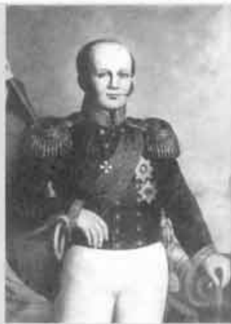
Вице-адмирал Д.Н. Сенявин, возглавлявший в 1805–1807 годах все морские и сухопутные силы России на Средиземном море

Примечательно, что на обратном переходе происходило нечто невероятное: по пути следования мимо балканских и итальянских берегов русские неоднократно встречались с англичанами, но те даже и не думали напасть на них.