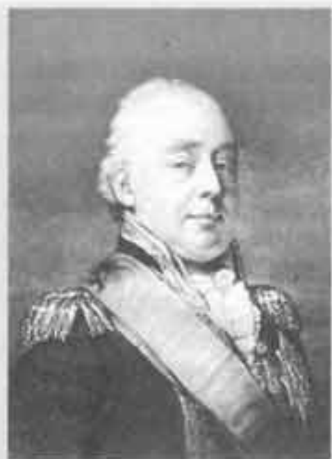
Контр-адмирал Дж. Сумарец, командовавший английской эскадрой, направленной в 1808 году в Балтийское море для совместных действий со шведским флотом против русского

действовал и как военный моряк, и как дипломат, отстаивавший честь флага и отечества. Команды смогли вернуться на родину осенью 1809 года. Что же касалось кораблей, то большинство из них так и осталось в Англии, где некоторые просто сгнили, а остальные продали с торгов. Спустя пять лет, в 1813 году, Россию вернулось лишь два корабля: 74-пушечный «Сильный» и 66-пушечный «Мощный».