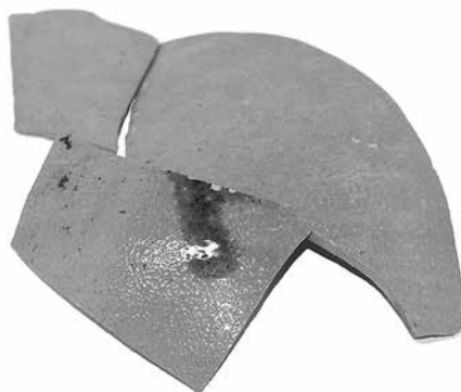
Ил. 5. Фрагменты бутылки из каменной массы для минеральной воды из Большого двора Зимнего дворца Государственного Эрмитажа. Государственный Эрмитаж