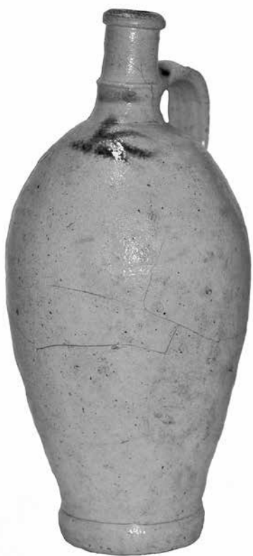
Ил. 1. Бутылка для минеральной воды. Каменная масса. Высота 27,5 см. Инв. № АСП-1110. Государственный Эрмитаж

их вторичное использование и, соответственно, более позднее время данной надстройки. «...Заполнение фундаментных траншей состояло из мешаного слоя битого кирпича с известкой. Там же были найдены отдельные фрагменты глиняной черепицы, возможно, обнаруженное здание имело кирпичные стены и черепичную крышу. Обнаруженный фундамент, предположительно, являлся остатками небольшого хозяйственного здания, возможно, каретника или конюшни конца XVIII в., находившегося здесь до постройки здания Восточного крыла Главного штаба...» 6