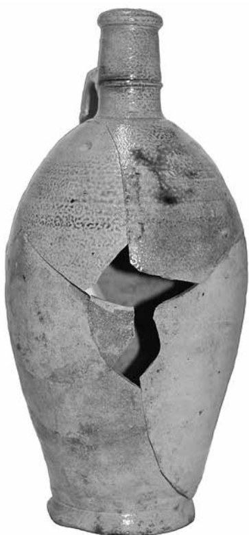
Ил. 2. Бутылка для минеральной воды АСП-1111. Каменная масса. Высота 29 см. Инв. № АСП-1111. Государственный Эрмитаж