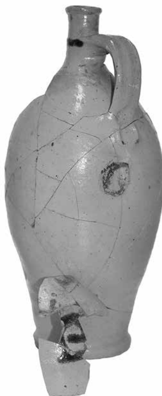
Ил. 3. Бутылка для минеральной воды. Каменная масса. Высота 29 см. Инв. № АСП-1112, АСП-1113. Государственный Эрмитаж