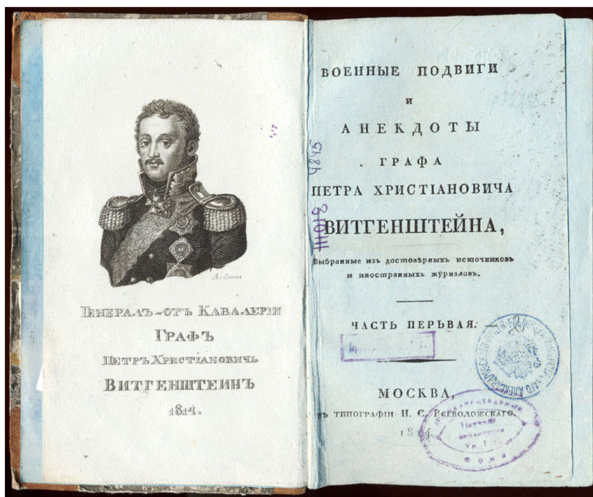
4. Титульный лист сочинения графа Витгенштейна