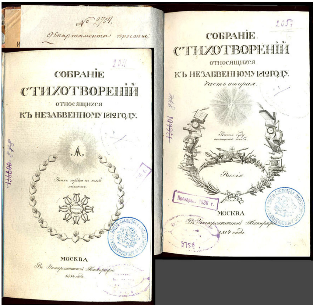
6. Титульные листы двухтомного «Собрания стихотворений...»

Рассматриваемые все вместе, сотни поэтических сочинений войны 1812 г. представляют литературный ландшафт эпохи, отражая уровень развития поэзии и литературного языка начала XIX в. Стихи, рассыпанные по журналам и напечатанные отдельными книжками, будучи собранными вместе, могли бы создать литературный памятник Отечественной войне 1812 г., и такой памятник появился в 1814 г.: это было двухтомное «Собрание стихотворений, относящихся к незабвенному 1812 году» (ил. 6) — именно «собрание» всего написанного к 1814 г.: 500 страниц текста, 153 стихотворения и около 70 авторов (точнее сказать трудно, т. к. некоторые стихи опубликованы без подписи, но могли принадлежать и известным авторам). Сборник давно известен исследователям: еще в год 100-летия Отечественной войны (1912) стихи из этого сборника цитировались в юбилейном издании «Отечественная война и русское