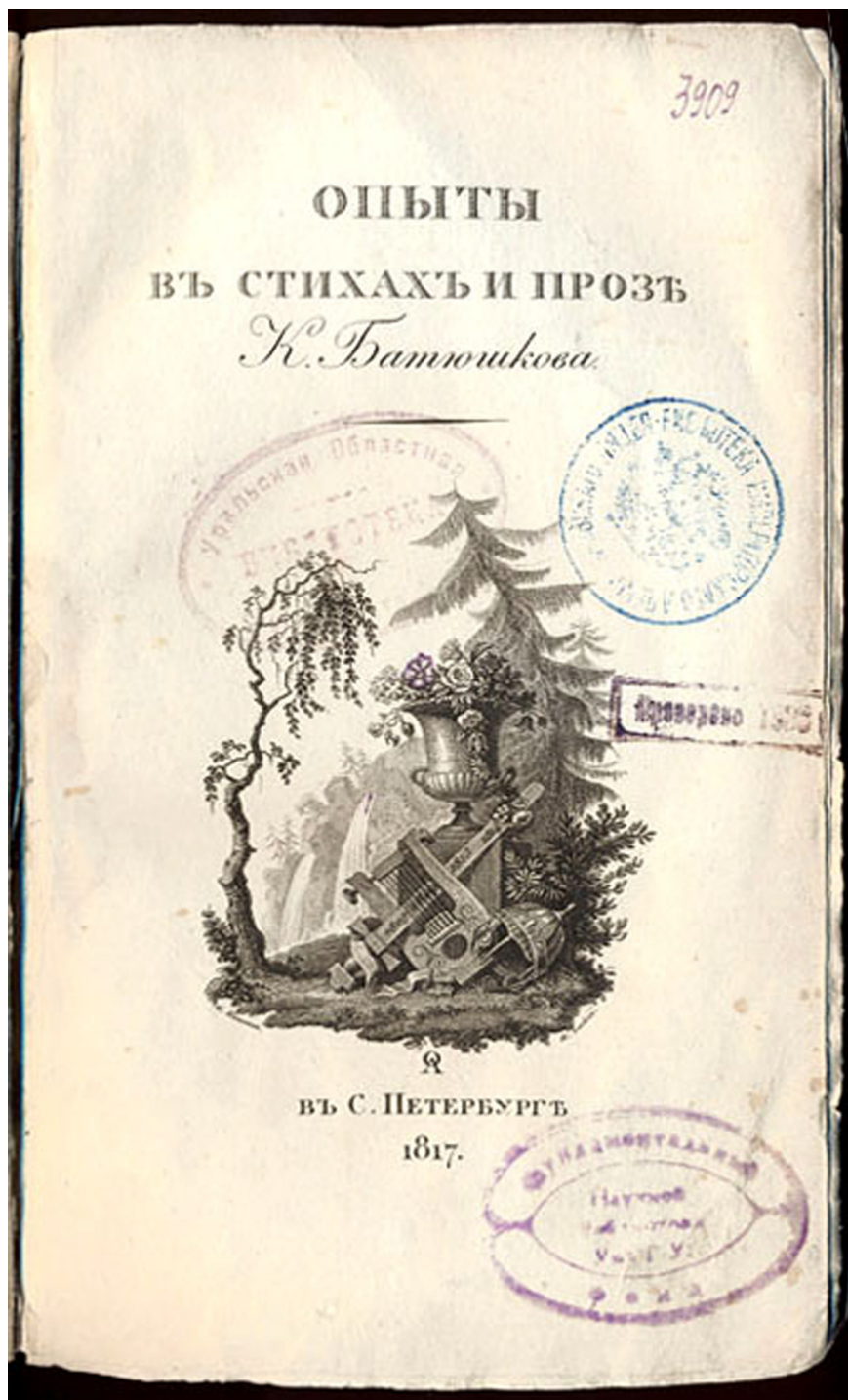
2. Гравированный титульный лист к сочинению К. Н. Батюшкова