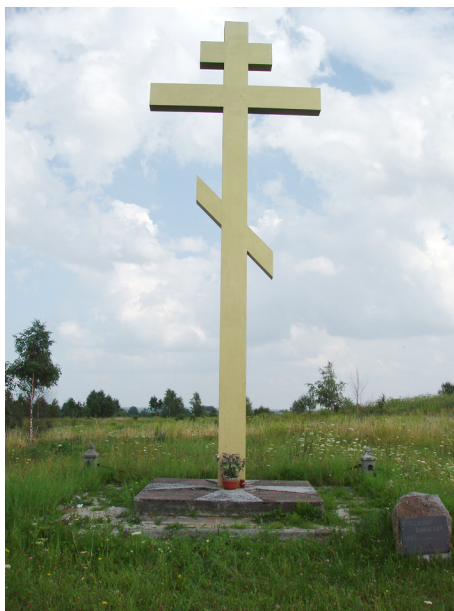
Ил. 4. Багратионовск (Прейсиш-Эйлау). Памятный крест на месте сражения. 2016 г.

свои знамена в бою защищали геройски, независимо от того, были ли на них орлы или нет. Да и русские, видя перед собой неприятельское знамя, стремились захватить его любой ценой. В бою было не до наблюдений за наличием или отсутствием на древках орлов. А вот чтобы отбить каждое знамя, требовалось совершить поистине подвиг, превозмогающий доблесть врага, даже ценой своей жизни. Поэтому-то и хранились все трофейные полотнища в Петропавловском соборе в том виде, в каком их доставляли с полей сражений. И орлы с них в 1812 г. не снимались, а сами знамена никакой «реконструкции» не подвергались. Лишь в октябре 1906 г. они были перевезены в АИМ для реставрации и бережного хранения, чему помешали сначала Великая война, затем революционные смуты. Из шести французских знамен четыре погибли, как солдаты в бою, сгорев в ярославском пожаре 1918 г., а остатки двух переданы в Государственный Эрмитаж как молчаливые свидетели боевой славы наших предков (ил. 4).