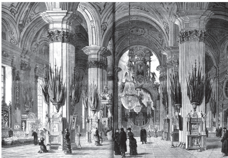
Ил. 2. Неизвестный художник. «Санкт-Петербург. Внутренность Петропавловского собора. Усыпальницы Особ Императорской Фамилии». 1880-е гг.

В 1906 г. комендант крепости генерал от инфантерии А.В. Эллис забил тревогу в связи с ветхостью полотнищ 26 . К этому времени император Николай II уже принял решение о строительстве в столице Военно-исторического музея (ВИМ), и в октябре 1906 г. последовало высочайшее повеление о незамедлительной передаче всех трофеев из Петропавловского собора на временное хранение в Артиллерийский исторический музей (АИМ) 27 . Так французские знамена, взятые у Прейсиш-Эйлау, в числе других 1228 знамен из Петропавловского собора, 25 октября 1906 г. оказались в АИМ 28 . Предполагалось, что до окончания строительства ВИМ знамена будут храниться в приспособленных для этого помещениях с постоянной температурой и влажностью, на попечении специалистов, обеспечивающих надлежащий уход и реставрацию 29 .