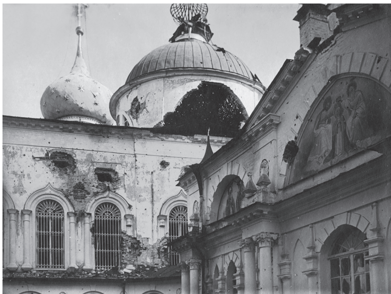
Ил. 3. Ярославль. Спасо-Преображенский монастырь после артиллерийского обстрела. 1918 г.

из столицы 30 . Но лишь в мае 1918 г. ящики со знаменами из АИМ по железной дороге были доставлены в Ярославль и помещены в каменном здании Крестовской церкви и сухом деревянном каретном сарае на территории Спасо-Преображенского монастыря.