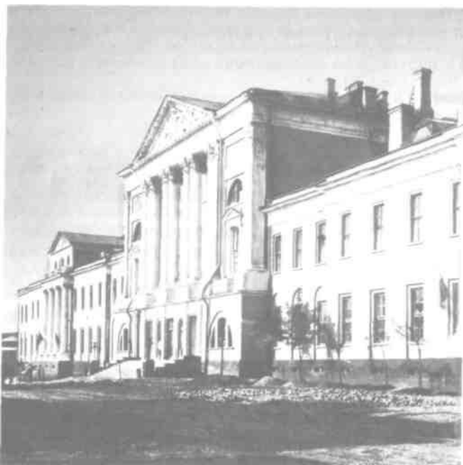
2. Госпиталь в Лефортове в начале XX в. Фотография. ГНИМА

Не раз госпиталь становился действующим лицом исторических событий, сыграв, например, важную роль в ликвидации эпидемии чумы 1770-1771 гг. В нем оказывалась помощь раненым и больным в Отечественную войну 1812 г., русско-турецкую войну 1877-1878 гг., русско-японскую войну 1904-1905 гг., в Первую мировую и гражданскую войны. Подготовленным встретил госпиталь Великую Отечественную войну. С октября 1941 по март 1943 г. он находился в эвакуации в городе Горьком (Нижегород), где продолжал функционировать в качестве головного медицинского учреждения сражающейся Красной Армии.