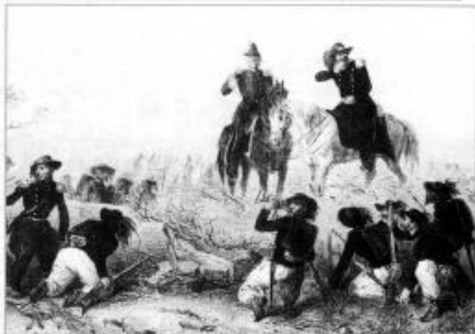
Берсальеры в сражении на р. Черной 16 августа 1855 г. Французские литографии XIX в.