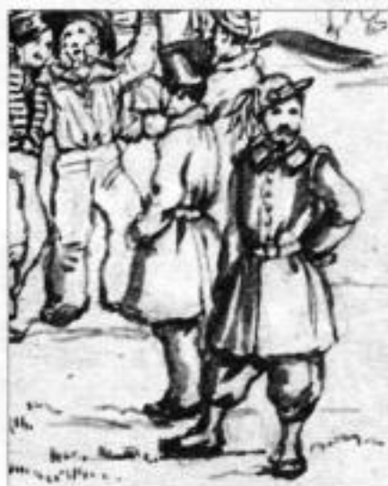
Акварель полковника Джорджа Кэдогана (Colonel Sir George Cadogan) на которой он показывает берсальера на скачке 1856 году после подписания мира. Полковник Кэдоган в Крыму служил в должности представителя командующего британской армии в штабе сардинского экспедиционного корпуса с апреля 1855 г. и по май 1856 г.