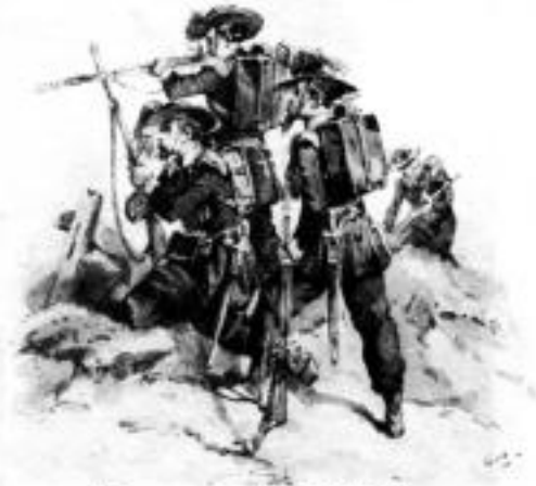
Берсальеры в биву. Рис. Раффе.

Офицеры всех подразделений были уполномочены брать с собой все предметы, перечисленные в предписании. Все подразделения были снабжены жестяными бидонами [bidoni di fatta] для хранения дополнительной порции вина (Приказ № 2493 от 4 апреля). Всем солдатам, сержантам и офицерам был дан приказ заточить палаш и сабли, но только на один сантиметр на концах лезвий. Всему пешему личному составу были выданы кожаные рейтузы и соответствующие запасные ремни и шнурки. (Приказ № 2559 от 6 апреля). Были введены два деревянных шеста, которые можно было разбирать на три