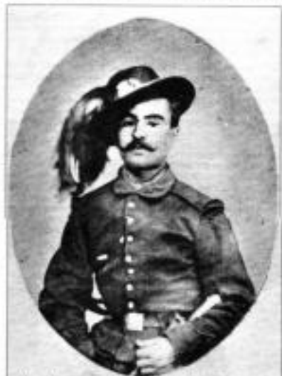
Это фотография молодого берсальера в солдатской рабочей куртке образца 1850 г. из Museo Storico (Office of History) итальянской армии и опубликованная в книге Dall'Armaio Savoia.

Специальными имуществом и снаряжением у берсальеров были лопатки, молотки с рукоятками из ясеня, формы для отливки пуль; кирки, кошки, ножи для подрезки ветвей, долото, топоры и лопаты.