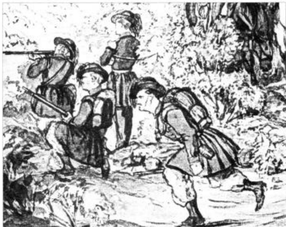
Берсальеры во время сражения на Черной реке. Дж. Кадогана. 1855 г.

черный цвет. Имелись четыре внутренних кармана, вертикальный в каждой передней поле и под каждой из полсади.