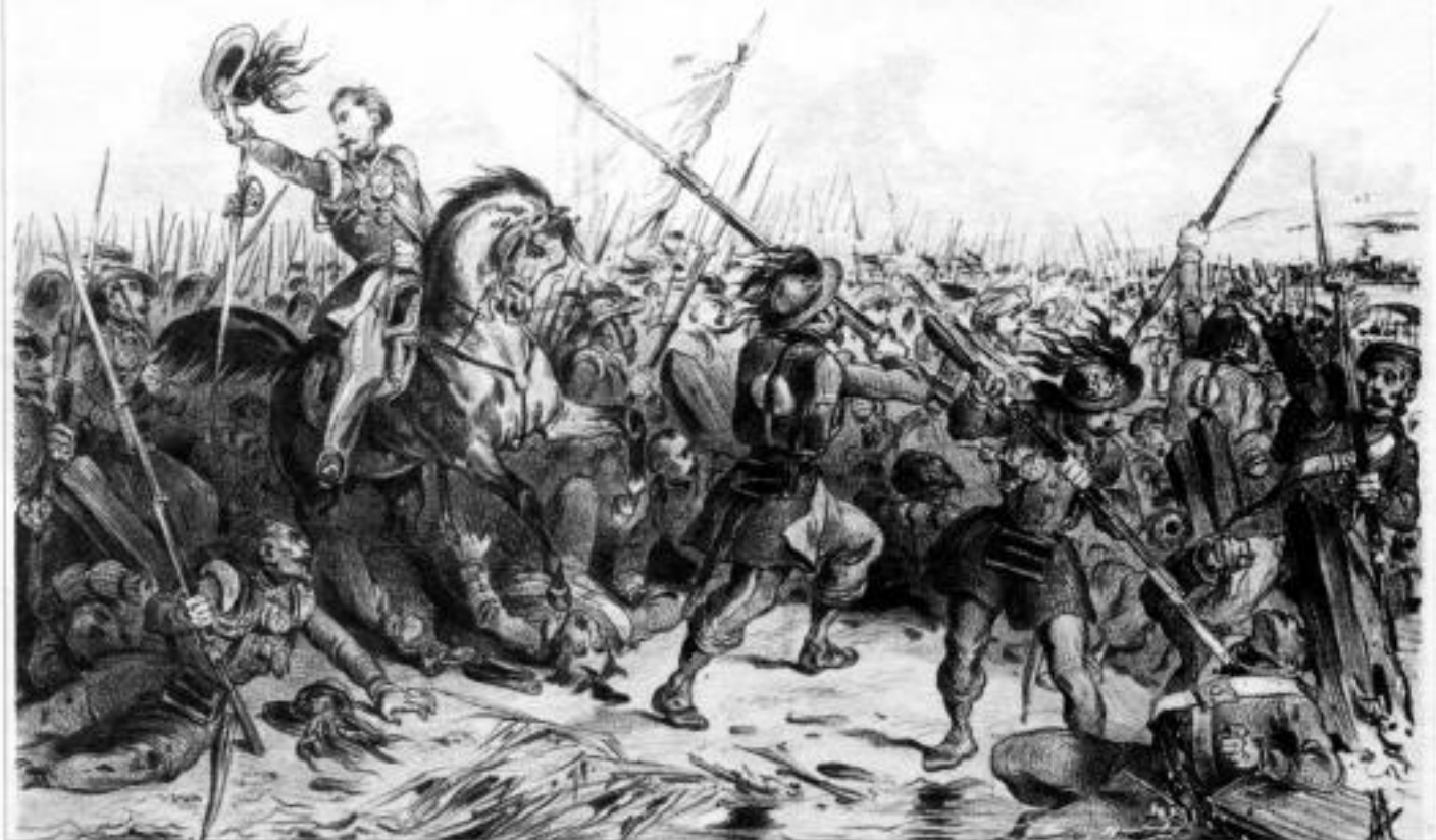
Берсальеры в сражении на р. Черной 16 августа 1855 г. Французская литография XIX в.