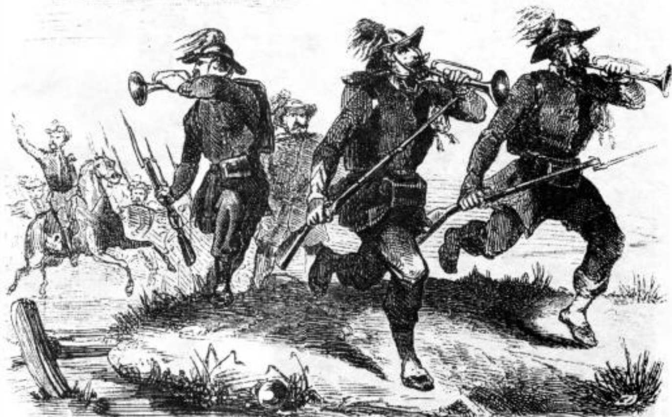
Берсальеры в сражении на р. Черной 16 августа 1855 г. Французская литография XIX в.