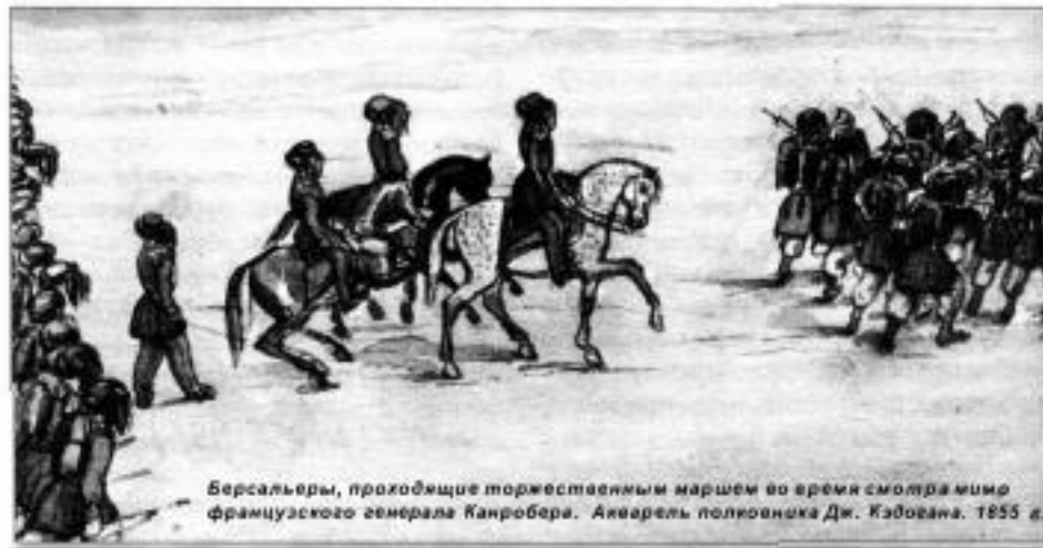
Берсальеры, проходящие торжественным маршем во время осмотра войск французского генерала Канробера. Акварель полковника Дж. Кэбогана. 1855 г.

Туника имела воротник, остроконечные обшлаги из ткани малинового цвета и позолоченными пуговицами. На ней носились плечевые эпюлеты [passante], которые изготовлялись из кожи, отделялись золотым галуном, и имели подкладку из шелка или другого дорого материала, покрашенного в