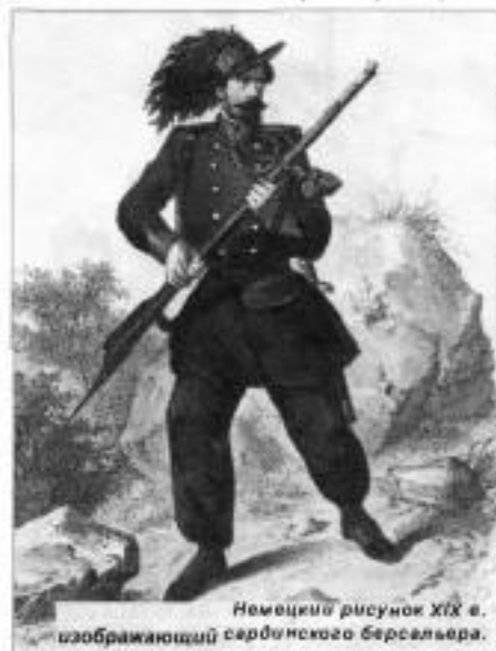
Немецкий рисунок XIX в. изображающий сербского берсальера.