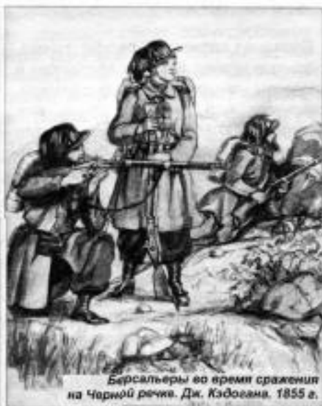
Берсальеры во время сражения на Черной реке. Дж. Кэдогана. 1855 г.

В начале сентября 1855 г. войска познакомились с русской зимой, которая, хоть ее и нельзя было сравнить с зимой в удалённых от моря районах в центре империи, все же была очень суровой, особенно в ночное время. Административный аппарат начал действовать: выдавал офицерам, в обмен за плату, носки, свитера, перчатки шерстяное нижнее бельё и фланелевые пояса, в то время как войска получали бесплатно следующие