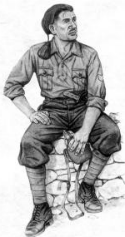
старшина берсальеров во время второй мировой войны с орденом на голову красной Федоровой феской - память о Крымской войне. 1943 г.