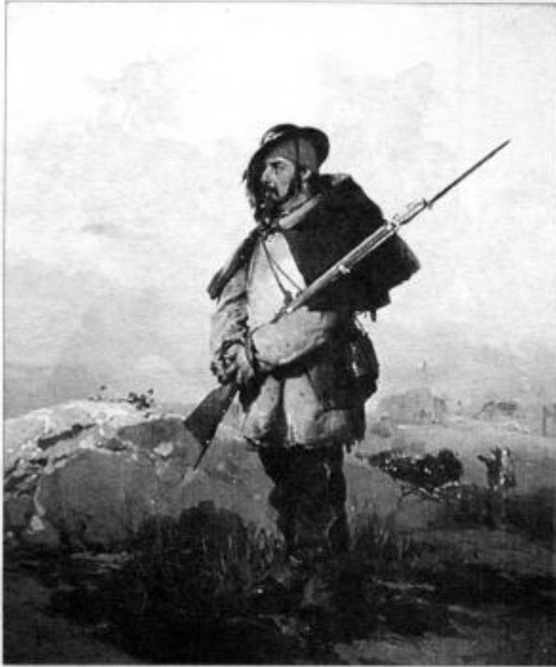
Берсальеры в Крыму. Рис. Дж. Индуно. 1858 г.