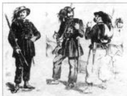
Берсальеры. Крым. 1855 г.