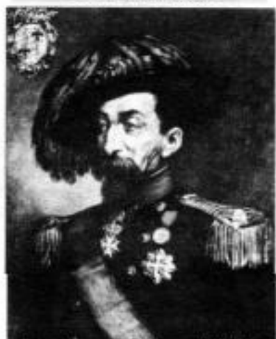
Генерал Алессандро Ла Мармора (1799-1855 гг.) Создатель корпуса берсальеров. В Крыму командовал 24 павозонной батареей. Также он участвовал в составе каждой из пяти павозонных бригад ордена, своего эскадронного корпуса, был включен батальон берсальеров. Умер в 1855 г. Не смотрите на это, что замалчивают некоторые источники, как редчайшие берсальеры всегда носил их форму.

Униформа, снаряжение и оружие офицеров; форма для офицеров и новиков.