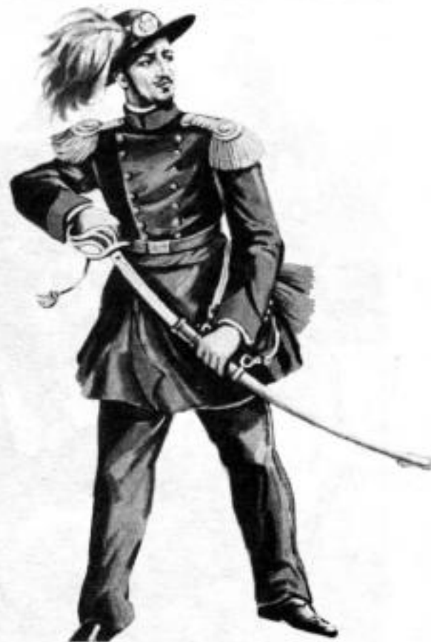
Офицер берсальеров в униформе 1856 г.

предстояло присоединиться к англо-французскому контингенту, союзному с Турцией в конфликте с Россией. Соответствующие циркуляры регламентировали, что именно войска должны были брать с собой, включая и различные виды униформы для ношения согласно обстоятельствам. Эти предписания по отношению к берсальерам (Приказ № 2096 от 26 марта 1855 г.) были таковы: