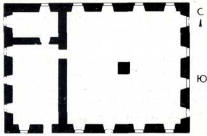
2. План Грановитой палаты и сеней. 1742