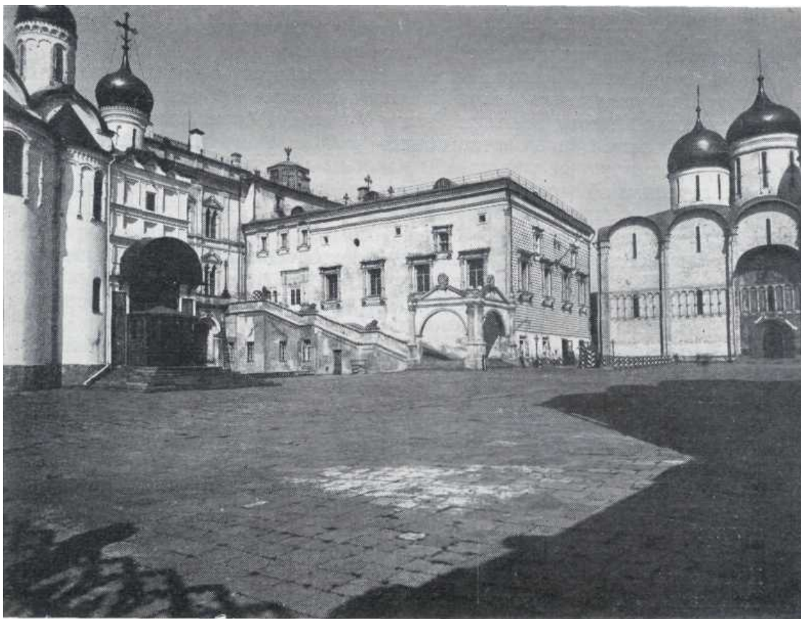
1. Грановитая палата. Фотография 1916 г.

Таким образом, с одной стороны, настоятельные распоряжения царя возобновить стенопись, с другой — сопротивление иконописцев, желание задержать работу до более благоприятного времени.