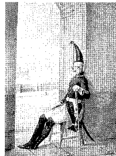
Гренадерский унтер-офицер мушкетерского полка, 1797—1801 гг.

История взаимоотношений императора Павла I и полководца А. В. Суворова, двух самых неординарных личностей российской истории последних лет XVIII в., всегда пользовалась особым вниманием их биографов. Согласно схеме, сложившейся в русской историографии 2-й половины XIX—начала XX вв., эти отношения прошли три этапа. Первый, от воцарения императора до возвращения Суворова на службу в феврале 1799 г., в целом характеризуется срывавшимися попытками достичь взаимопонимания и взаимным неприятием. Второй, до конца марта 1800 г., является фактической идиллией, полной гармонией между государем и его генералиссимусом. Наконец последние полтора месяца жизни А. В. Суворова омрачены сколь тяжелой, столь и неожиданной опалой, по поводу причин которой среди исследователей до сих пор нет единого мнения 1 .