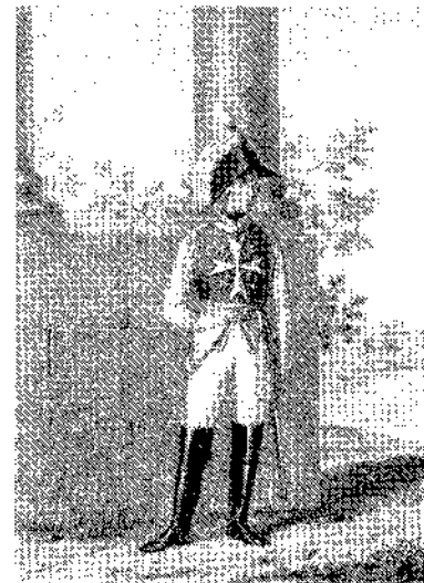
Офицер Кавалергардского полка, 1800—1801 гг.

Среди пожалований и почестей, оказанных Павлом I А. В. Суворову в 1799 году, выделяется уникальный для Российской империи замысел — установить прижизненный памятник полководцу. Высочайшее повеление о разработке проекта статуи было объявлено президенту Академии художеств графу О. Г. Шуазель-Гуффе 1 ноября 1799 г. в письме вице-президента Адмиралтейств-коллегии вице-адмирала графа Г. Г. Кушелева 1 . Через четыре дня Ф. В. Растопчин сообщил об этом самому Суворову 2 . Уже 30 ноября президент Академии известил Кушелева о готовности представить императору эскизы вариантов монумента 3 . Высочайшее разрешение последовало 7 декабря 4 . Рассмотрев рисунки и модели Павел остановил свой выбор на проекте скульптора М. И. Козловского, где полководец был представлен в виде древнеримского бога войны Марса. Это случилось под Новый год 5 . Все тот же