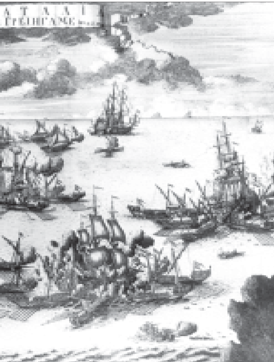
Модель русской 18-баночной полугалеры «турецкого манера» «Фивра» (1714–1723). Первая половина XVIII в. ЦВММ