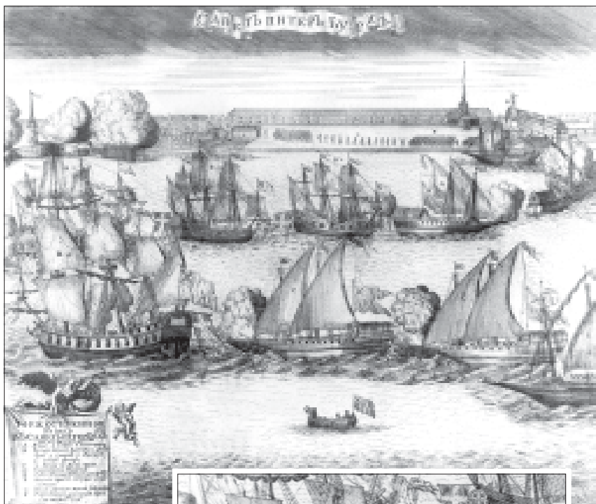
Гравюра А.Ф. Зубова «Торжественный ввод в Санкт-Петер- бург четырех швед- ских фрегатов». 1720 г.