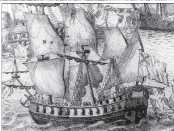
34-пушечный фрегат «Стор Феникс». Фрагмент гравюры