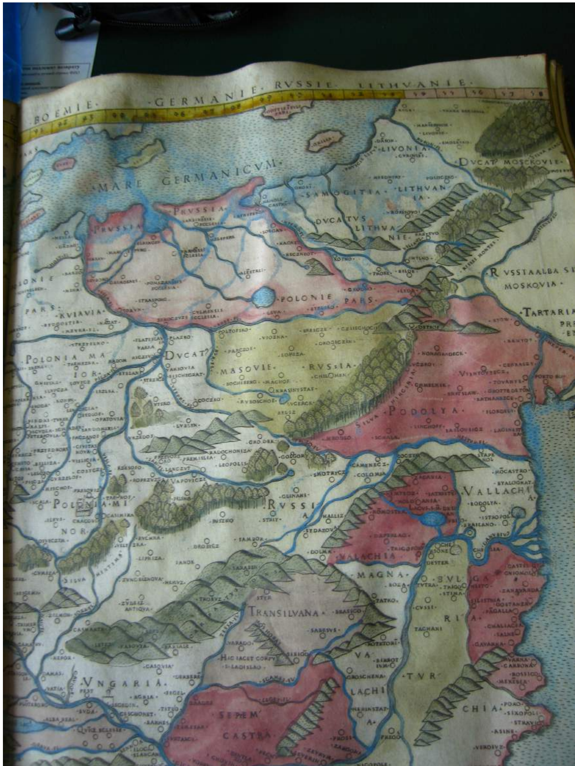
Рис. 1. Марк Бенвенуан. Современная карта Польши, Венгрии, Богемии, Германии, Руси, Литвы. 1507/1508 г. Фрагмент.