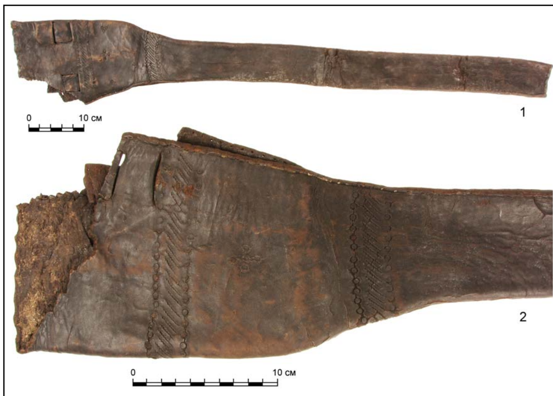
Рис. 1. Чехол для карабина из раскопок Березовского кремля в 2018 г.: 1 — общий вид; 2 — деталь.