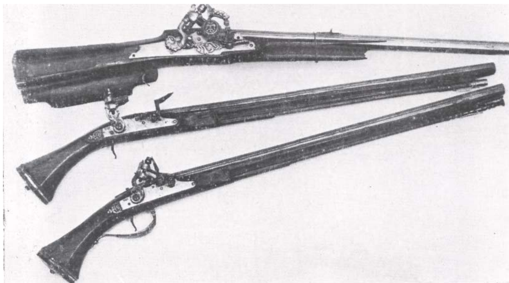
2. Бартар Киннеман. Пищаль и пара пистолетов. 60-е гг. XVII в. Музеи Кремля

альностей получали от двадцати до тридцати рублей, средней квалификации - одиннадцать - двенадцать рублей, низший оклад русских чистильщиков оружия составлял четыре рубля 18 . Видимо, среди вновь прибывших оружейников не было специалистов, достигавших уровня известных русских мастеров Н. Давыдова, Г. Вяткина, В. Титова, чьи годовые оклады составляли двадцать пять - тридцать рублей. Приезжих оружейников низшей квалификации считали необходимым поддерживать более высокими, чем у местных, окладами.