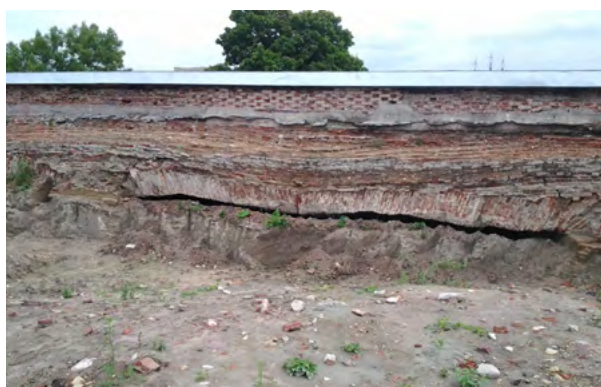
Меншиков бастион Петропавловской крепости. Обрушившиеся опорные арки и контрфорсы каменной крепости, возводимой в 1706 г. 2014 г.