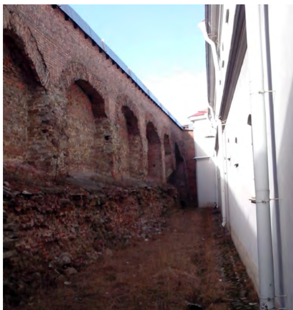
Внешний двор Тюрмы Трубецкого бастиона. Вид на эскарповую стену с опорными арками, потерной, контрфорсами и пр. элементами кладки стен. 2015 г.