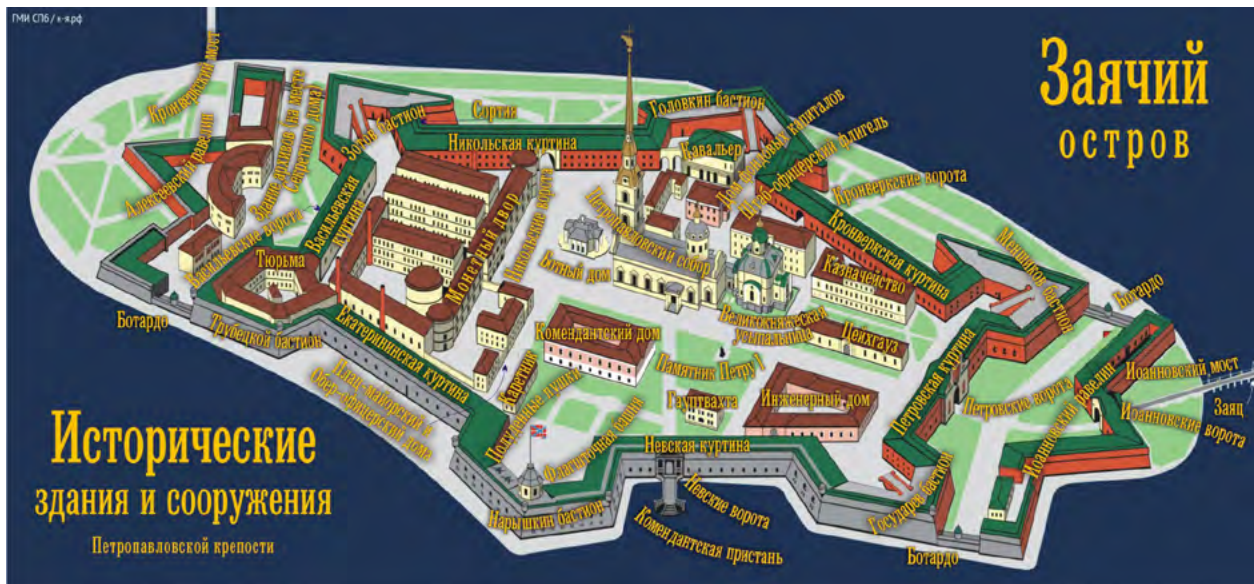
План Петропавловской крепости с экспликацией объектов. 2016.