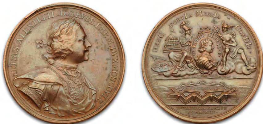
Медаль «В память основания Петербурга». Аверс / Реверс

В тот момент, когда начиналось строительство дерево-земляной крепости ситуация с развитием Северной войны пребывала далеко от ясности. Еще было непонятно, достанутся ли эти земли России или нет. Шведы считали приневские земли своими,