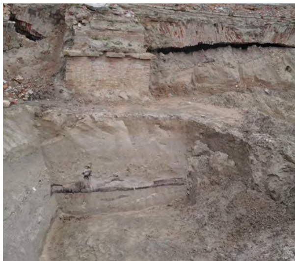
Меншиков бастион Петропавловской крепости. Отчетливо видны провалившиеся опорные арки и элементы деревянных ряжей первой дерево-земляной Санкт-Петербургской крепости. 2014 г.

Еще один памятный знак, посвященный не отдельному строению, а таких много на территории Петропавловской крепости, а всему городу в целом появился во время четвертого Международного культурного форум, проводившегося в Петербурге в де-