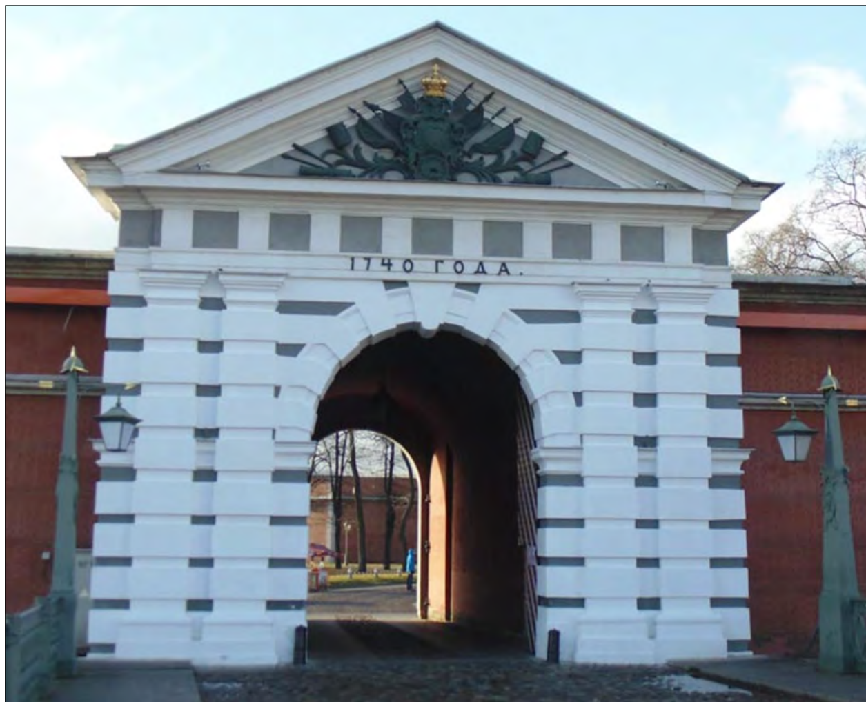
Иоанновские ворота Б.-Х. (Х.А.) фон Миних 1739-40 гг. 2016 г.

шпица бастиона устроили в виде бетонного перекрытия по земляной засыпке, из-за чего грунтовые воды стали разрушать кирпичную кладку валганговых 31 стен крепостного вала. В конце 2010 г. КГИОП Санкт-Петербурга 32 дал разрешение откопать грунт Меншикова бастиона, выполнить гидроизоляцию и укрепить кирпичную кладку стен, а также утвердил методику ремонтных работ. При реставрации этого бастиона в 2010-х гг. была снята бетонная плита валганга (верхней стены) над фасадами. При выемке засыпки пространства между эскарповой 33 и валганговой стеной обнажились деревянные ряжи, которые составляли основу дерево-земляной крепости. Очевидно, строительство бастиона велось «с поспешанием». Выяснилось, что опорные арки и контрфорсы были выложены достаточно быстро, без использования раствора, с подтеской кирпичей, арки выкладывались по мере того как производилась засыпка. При выборке грунта они потеряли устойчивостью и стали разрушаться. Реставраторы предположили, что при строительстве этого бастиона отработывались оптималь-