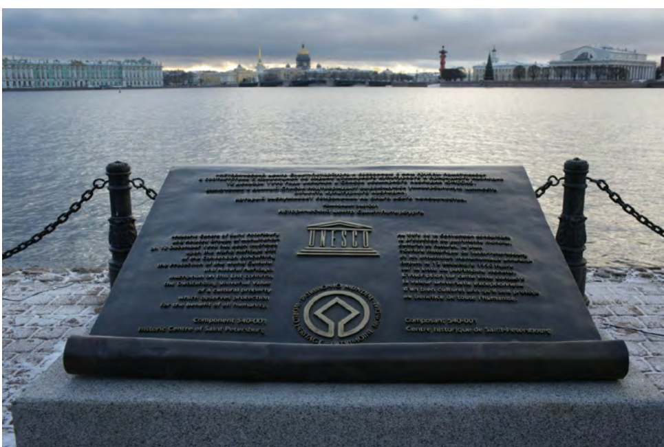
Памятный знак «Исторический центр Санкт-Петер- бурга и связанные с ним группы памят- ников», 2015.