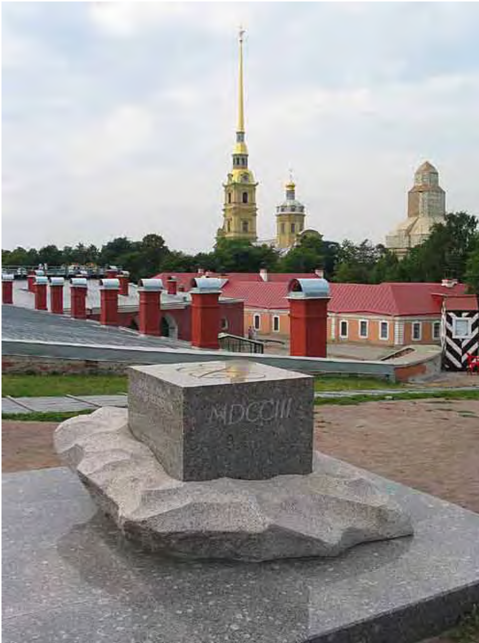
Памятный знак «Место начала стро- ительства Санкт-Пе- тербурга», 2003.