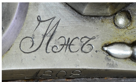
Ил. 10. Штуцер егерский обр. 1798 г. Надпись на замке. ВИМАИВиВС, ном. № 1/769