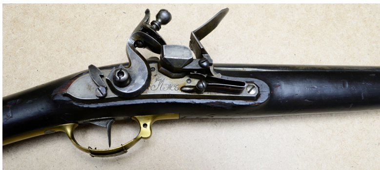
Ил. 14. Ружье пехотное обр. 1805 г. Средняя часть. ВИМАИВиВС, ном. № 1/672