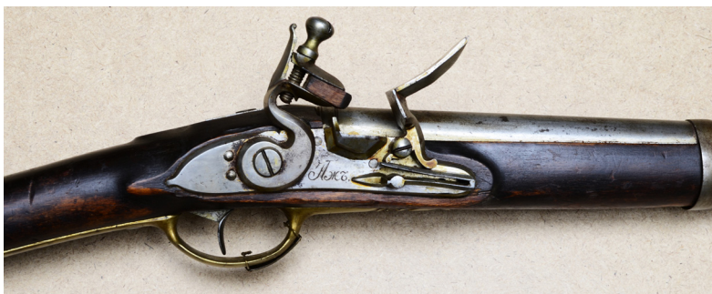
Ил. 12. Карбин кавалерийский обр. 1803 г. (?). Средняя часть. ВИМАИВиВС, ном. № 100Ф 1/690

Прицельные приспособления состоят из латунной овальной мушки, закрепленной на верхней части образующей ствола на расстоянии 66 мм от дульного среза, и прорези на хвостовике казенного винта.