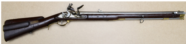
Ил. 7. Штуцер егерский обр. 1798 г. Общий вид. ВИМАИВиВС, ном. № 1/769