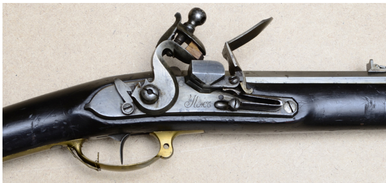
Ил. 16. Штуцер пехотный обр. 1805 г. Средняя часть. ВИМАИВиВС, ном. № 1/768