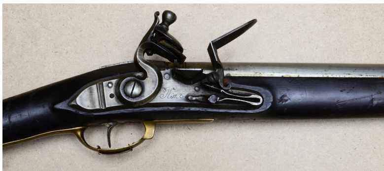
Ил. 6. Фузея егерская обр. 1765 г. Средняя часть. ВИМАИВиВС, ном. № 100Ф 1/325

1808». На прикладе с правой стороны – овалный штамп с надписью в две строки: «АМ // 1840». На прикладе с левой стороны – прямоугольный бумажный ярлык с двухлинейной рамкой и надписью «Ч.І, № 1771».