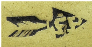
Ил. 21. Ружье пехотное обр. 1808 г. Клеймо на спусковой скобе. ВИМАИВиВС, инв. № 1/365

1809». На ложевых кольцах (верхнее кольцо не сохранилось), передней части спускового колена, спусковой личинке и затыльнике приклада нанесены клейма: «стрела с литерами «FP» в наконечнике». На затыльнике приклада сверху – двуглавый орел под императорской короной. На прикладе справа – овалный штамп с надписью в две строки: «АМ // 1619».