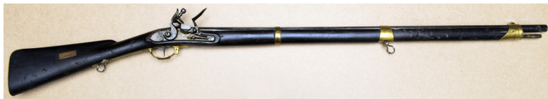
Ил. 13. Ружье пехотное обр. 1805 г. Общий вид. ВИМАИВиВС, ном. № 1/672

На казенной части ствола вырезано клеймо – переплетенные рукописные буквы «FP». На замочной доске – надпись в две строки: «Ижъ // 1808». На затыльнике приклада выбито казенное клеймо – двуглавый орел под короной. На прикладе с правой стороны – прямоугольный бумажный ярлык с двухлинейной рамкой и надписью «Ч.І, № 1770». Ствол, замок и шомпол оксидированы в черный цвет.