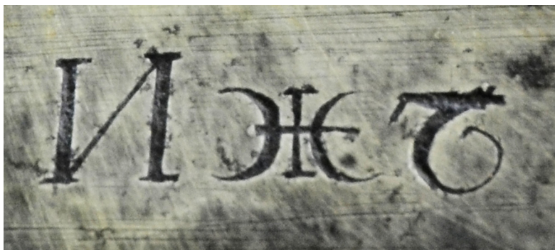
Ил. 3. Ружье винтовальное унтер-офицерское обр. 1805 г. Надпись на замке. ВИМАИВиВС, ном. № 100Ф 1/763