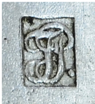
Ил. 9. Штуцер егерский обр. 1798 г. Клеймо на казенной части ствола. ВИМАИВиВС, ном. № 1/769