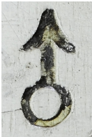
1808 г. Клеймо на казенной части ствола. ВИМАИВиВС, инв. № 1/365