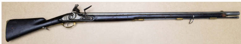
Ил. 5. Фузея егерская обр. 1765 г. Общий вид. ВИМАИВиВС, ном. № 100Ф 1/325