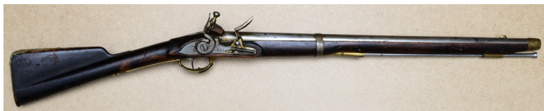
Ил. 11. Карбин кавалерийский обр. 1803 г. (?). Общий вид. ВИМАИВиВС, ном. № 100Ф 1/690