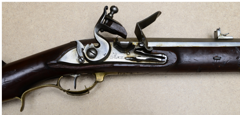
Ил. 8. Штуцер егерский обр. 1798 г. Средняя часть. ВИМАИВиВС, ном. № 1/769