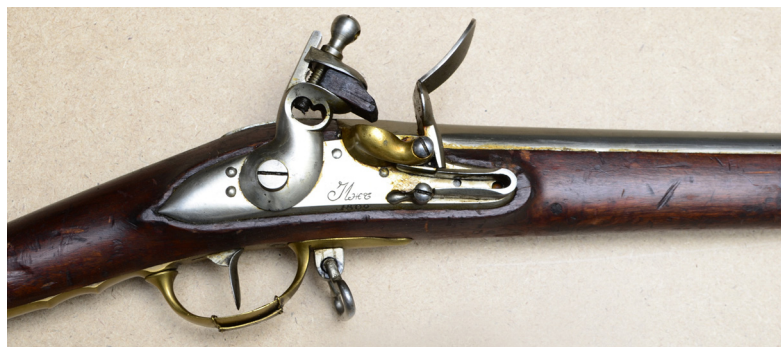
Ил. 18. Ружье пехотное обр. 1808 г. Средняя часть. ВИМАИВиВС, инв. № 1/365