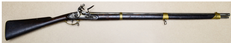
Ил. 1. Ружье винтовальное унтер-офицерское обр. 1805 г. Общий вид. ВИМАИВиВС, ном. № 100Ф 1/763

Ложа березовая (?) с длинным цевьем, закрытой шомпольной дорожкой, прикладом со щекой и с упорами для ложевых колец, окрашена в темно-коричневый цвет. На ложе упоры под ложевые кольца. Прибор латунный, состоит из трех ложевых колец, спусковой скобы, накладки под замочные винты и затыльника приклада. Верх-