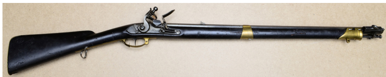
Ил. 15. Штуцер пехотный обр. 1805 г. Общий вид. ВИМАИВиВС, ном. № 1/768

Ствол железный, восьмигранный. Канал ствола нарезной, с 8 полукруглыми в плане нарезами. С правой стороны ствола, у дульного среза, укреплен трубчатый прилив, оканчивающийся полукруглым упором для крепления штыка, в приливе имеется винт-фиксатор штыка. На хвостовике казенного винта два полуцилиндрических выступа, разделенных узкой прорезью. На казенной части ствола нанесено клеймо – переплетенные рукописные буквы «FP».