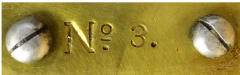
Ил. 4. Ружье винтовальное унтер-офицерское обр. 1805 г. Надпись на затыльнике приклада. ВИМАИВиВС, ном. № 100Ф 1/763

нее ложевое кольцо с воронкообразным приемником для шомпола и выпуклым пояском с узким фризом закреплено двумя железными