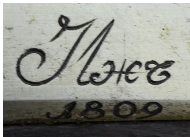
Ил. 20. Ружье пехотное обр. 1808 г. Надпись на замке. ВИМАИВиВС, инв. № 1/365