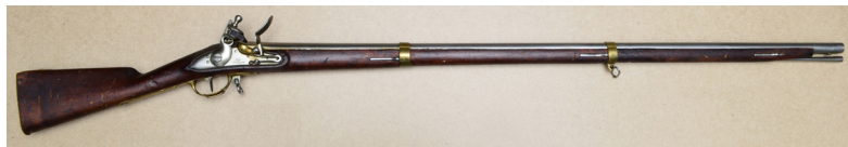
Ил. 17. Ружье пехотное обр. 1808 г. Общий вид. ВИМАИВиВС, инв. № 1/365

На казенной части ствола нанесено клеймо: «стрела, стоящая на круге». На замочной доске нанесена надпись в две строки: «Ижъ //