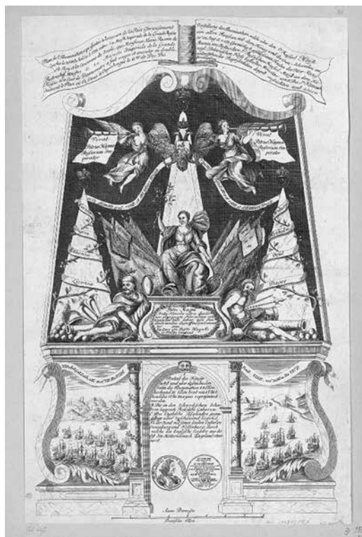
Ил. 2. И. Смит по проекту С. а Шинво. Изображение фейерверка и иллюминации, данных в Амстердаме 9 декабря 1721 года. 1721–1722 гг. Государственный Эрмитаж. Инв. № ЭРГ-33603

Особый интерес для исследователей может представлять нижняя часть изображения на транспаранте, где присутствует сидящая на постаменте женщина, в поднятой руке