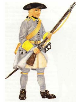
Рис.2 Униформа солдата Выборгского дублированного батальона 1708 г.