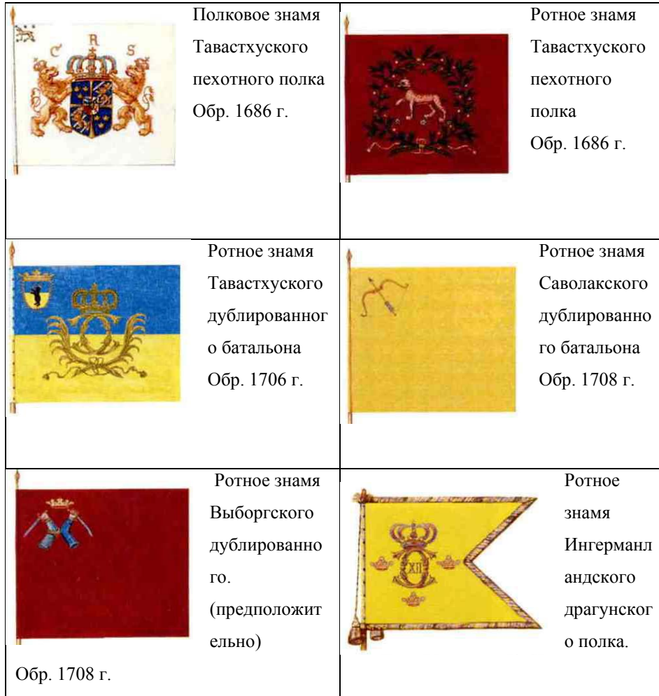
Таблица 1. Знамёна полков и батальонов из гарнизона Выборга в 1710г.

Из: Lars-Eric Höglund, Åke Sallnäs. The Great Northern War 1700-1721. Colours and Uniforms. Karlstad: Acedia Press, 2000