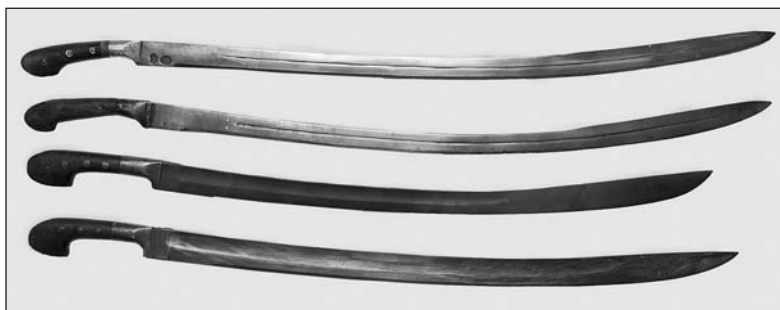
Рис. 4. Различные образцы «уставных» афганских шашек

Таким образом, во-первых, мы можем разделить все афганские «уставные» шашки на две группы по датам производства, соответственно до 1894 и после 1894 г. Во-вторых, образцы шашек, попадающие в эти две временные группы, отличаются визуально (рис. 4).