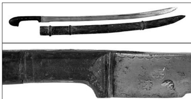
Рис. 7. «Переходный образец» афганской «уставной» шашки

Предположительно в это же время производились афганские «уставные» шашки, условно отнесенные к «переходным образцам». При сходных внешних габаритах с шашками с «квадратным» клеймом и датой производства, голомени «переходных» шашек разделаны узкими долами, как на образцах до 1894 г. Известен образец, где на голомени присутствуют как узкие доли, так и широкий, и образец без долов. Но на всех «переходных» шашках, известных нам, присутствуют «арочное» клеймо Машин-Хана и одно или два нечитаемых круглых клейма (надо отметить, что именно на шашках этого образца часто встречаются гравированные на рикассо надписи на фарси) (рис. 7).