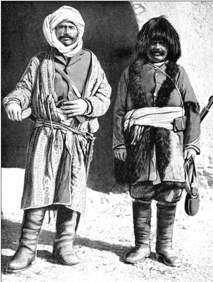
Рис. 9. Фотография афганских военных начала XX века с шашками