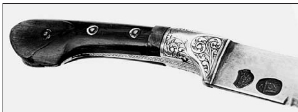
Рис. 3. Рукоять псевдо-шашки

фальшлезвием, слабо изогнут, менее широкий, чем у бухарской шашки. Ближе к обуху выражен один тонкий или широкий дол, идущий до фальшлезвия. Ближе к пяте на клинке часто можно обнаружить клейма арсенала в Кабуле «Машин Хана». Две накладки из дерева или рога, приклепанные к широкому хвостовику тремя стальными заклепками, под которые подложены серебряные или железные шайбы, занимают две трети от рукоятки. Головку рукояти образуют маленькие изящные «уши». Верхняя треть рукояти металлическая, чаще железная, а иногда серебряная, напаяна на хвостовик или приварена кузнечной сваркой (рис. 3). По спинке и брюшку могут проходить стальные