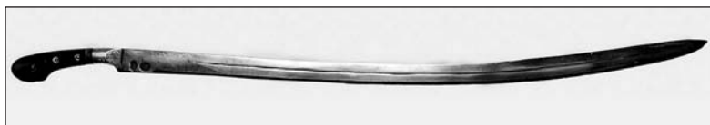
Рис. 5. Образец афганской шашки с клеймом, ставившимся до 1894 года

Шашки, клейменные в Машин-Хана до 1894 г. обладают рядом общих признаков. Их узкие длинные однолезвийные клинки изогнуты незначительно (см. таблицу). На некоторых образцах присутствует слабовыраженная елмань (рис. 5). Обе голомени симметрично разделаны простым узким долем, в основании которого (у рукояти) часто встречается насечка из желтого металла (вероятнее всего латуни)