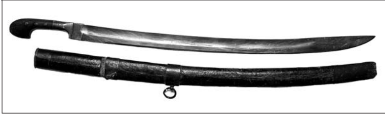
Рис. 8. Образец афганской шашки с клеймом, ставившимся после 1894 года