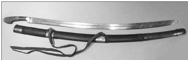
Рис. 2. Псевдо-шашка (по характеристике Я. Лебединского)

Второй тип — это, по характеристике Ярослава Лебединского, псевдо-шашка 13 (рис. 2). Клинок такой шашки однолезвийный, с