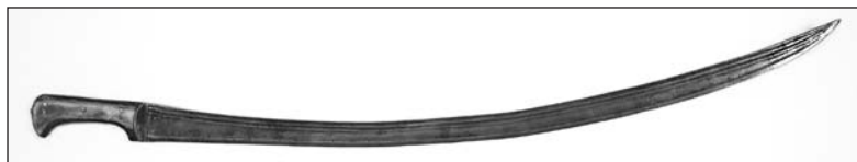
Рис. 1. Бухарская (среднеазиатская) шашка

Тогда было рассмотрено два основных типа шашек, встречающихся в Афганистане. Первый тип — это бухарская или среднеазиатская шашка (рис. 1). Клинок у нее однолезвийный, широкий и