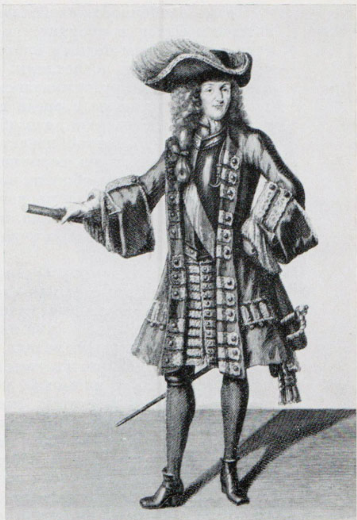
Рис. 2. Кафтан двубортный. Конец XVII в. (портрет маршала Франции Ф. де Монморанси. Гравюра Трувена. 1694)

Среди «новоманерных» вещей встречается также одна «французская» пара, состоящая из кафтана, камзола и штанов (вид 7) 28 . Она резко отличается от «староманерных» кафтанов с «французскими обшлагами». Все три вещи выполнены из алого сукна. Роль отделки играют пуговицы и петли черного цвета. Подкладка у кафтана из черного бархата, у камзола — из черной тафты. Как известно, изменения во французской моде, начиная с середины 1710-х гг., направлены на облегчение ткани, а также на использование более скромной декорировки. Золотое и серебряное шитье и галуны на французских мужских гражданских костюмах используются все реже. Они остаются только на официальных придворных одеждах. Отделка становится проще и переносится на пуговицы, петли, обшлага, которые выполняются из других тканей, нередко подкладочных материалов 29 . К такого типа одеждам и относится пара Меншикова, именуемая «французской».