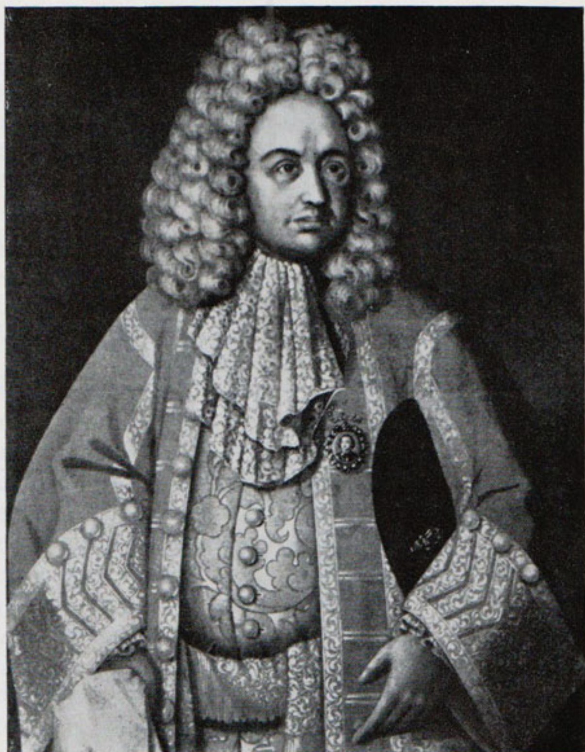
Рис. 1. Костюм 1700—1715 гг. (портрет Г. Д. Строганова работы Р. Н. Никитина [?]. Одесский художественный музей)

Помимо общих черт, характерных для большинства «пар» с кафтанами, следует упомянуть индивидуальные особенности некоторых из вещей. Так, среди ранних одежд находятся стеганый камзол из лазоревой «с насыпью» ткани и зимние стеганые штаны из тафты 16 . Стёганье с прокладкой ваты широко использовалось в России. В описях «мягкой рухляди» (одежды), относящихся к XVII в., нередко можно встретить стеганые кафтаны и штаны 17 . Продиктованные климатическими условиями, теплые стеганые одежды используются и при изменении покроя костюма на западноевропейский.