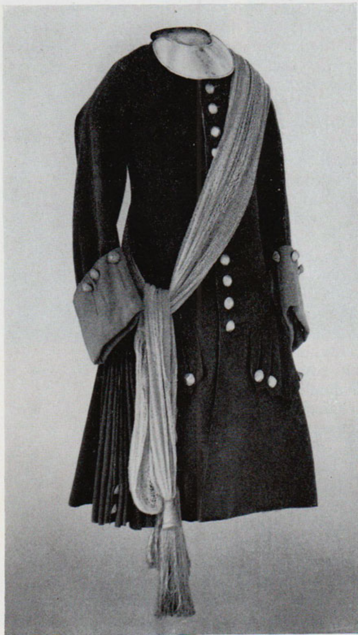
Рис. 8. Полтавский мундир Петра I. 1707—1709 гг. Гардероб Петра I

шнурами на полах). Одновременно в Англии возникает другой тип пальто — «редингот», одежда для верховой езды, также широкая, с большими рукавами с отворотами, имеющая два воротника 48 . «Епанчи с рукавами» Меншикова, вероятно, относятся к типу рединготов, так как бранденбуры или шнуры в описаниях одежд не упоминаются. Сшиты они из сукна или полумета, подложены бархатом или без подкладки; одни украшены золотым шитьем или позументом, другие — без отделки. При этом шитье или позумент располагались на обеих сторонах пол, в двух случаях — до подола. У всех епанчей один из воротников (а у некоторых — и обшлага) покрыт бархатом, которым они подбиты, и имеет ту же отделку, что и полы. В Описи упоминаются только «староманерные» епанчи, поэтому трудно говорить об изменении их покроя в дальнейшем. Можно лишь предположить, что их вид аналогичен епанче, записанной под № 156 без наименования. Она подшита бархатом по «краям», галун располагается не до подола, но по обеим сторонам пол, упомянут один воротник. Все епанчи названы «холодными», что позволяет предполагать существование и «теплых» епанчей на меху.