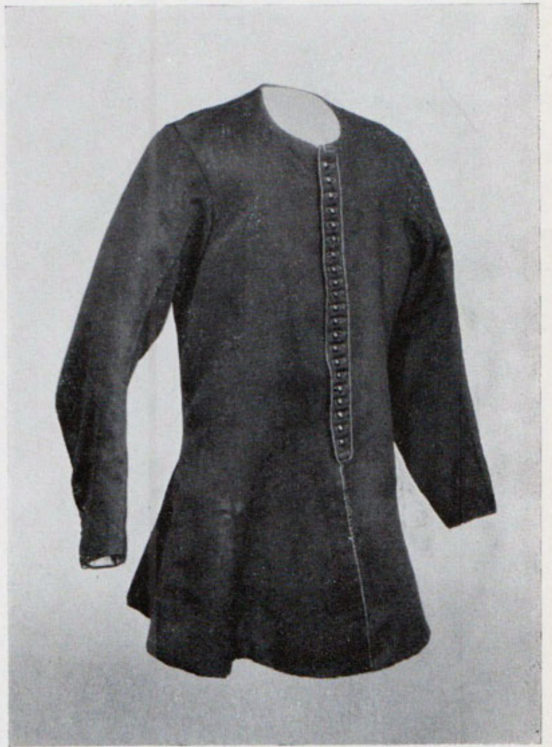
Рис. 11. Куртка-бострок. Первая четверть XVIII в. Гардероб Петра I

Головные уборы, обувь, чулки, шарфы и муфты, портупеи и другие дополнения к гражданскому и военному костюму, следующие в конце Описи , охарактеризованы менее подробно. Наибольший интерес представляют головные уборы — шапки, шляпы, картузы, шлафанцы. Шапки 62 , сшитые из сукна или бархата и опушенные мехом, являлись наиболее теплыми, зимними уборами. Возможно, в покрое шапок сохранились черты национальных русских шапок, хорошо приспособленных к зимним условиям. Шляпы Петровского времени хорошо известны. Отогнутые с трех сторон поля шляп придавали им форму треуголок. Шляпы Меншикова не только имели отделку из галуна, но расшивались серебряной ниткой. Выделкой шляп в России стали заниматься в начале XVIII в. для снабжения русской армии. Кроме шапок и треуголок (последние были как военными, так и гражданскими головными уборами и отличались лишь отделкой), носили и картузы. У Меншикова упоминаются картузы пуховые и покрытые бархатом. Различные виды картузов представлены в «Гардеробе Петра I» 63 . Картузы имели круглую головку и отвороты или лопасти-околыши; один обязательно спереди, другие — в разных вариантах: сзади или сзади и с боков, т. е. вокруг головки. Покрытые сукном, бархатом, тафтой или валяные, картузы могли служить как летним, так и зимним головным убором, в зависимости от материалов и покроя. Картузы также использовались в армии как более практичные убора, по сравнению со шляпами.