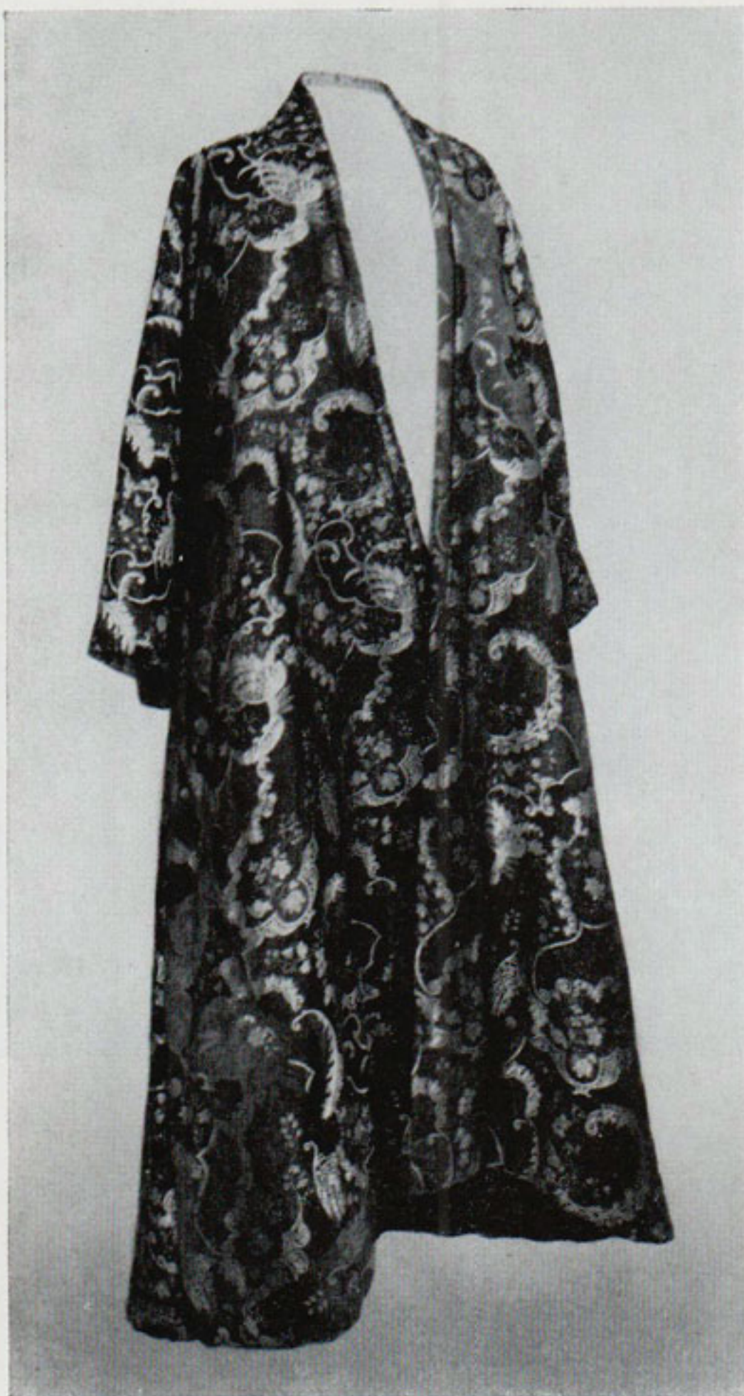
Рис. 12. Халат. Первая четверть XVIII в. Гардероб Петра I

Помимо перечисленных головных уборов, надевавшихся при выходе на улицу, существовали специальные домашние уборы. Снимаемая официальный парик, мужчина покрывал голову «шляфанцом». «Шляфанцы» — ночные колпаки, встречаются довольно часто среди приобретенных в начале XVIII в. вещей. Они шились из различных материалов, нередко богато отделывались. Шляфанцы Меншикова выполнены из бархата.