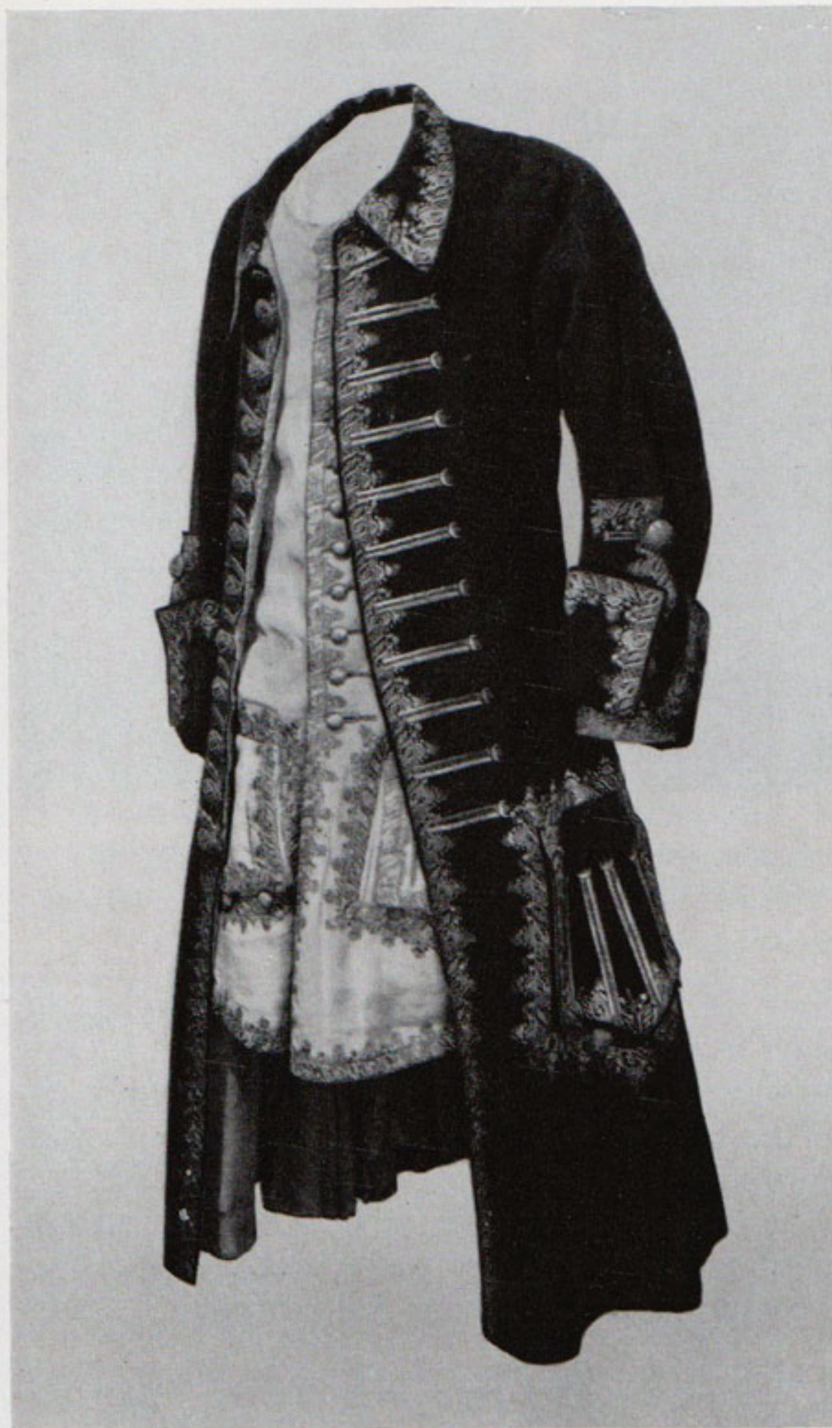
Рис. 3. «Берлинская» пара. 1715—1720 гг. Гардероб Петра I