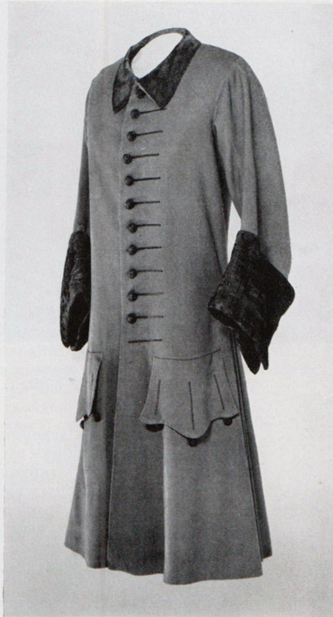
Рис. 4. «Новоманерный французский» кафтан 1715—1720 гг. Гардероб Петра I

tout —буквально «поверх всего») и материалам, сюртуки появляются именно в качестве верхней одежды. Они подчинялись тем же изменениям в моде, которым следовали комплекты с кафтанами. Однако между ними можно обнаружить и различия. Так, в начале XVIII в. сюртуки никогда не связывались с определенным камзолом. В некоторых случаях им сопутствуют лишь штаны, шитые из той же ткани. Следовательно, сюртуки могли носиться с любым камзолом, бешметом, бостроком или другими одеждами. В качестве теплого верхнего платья они выполнялись из плотных практичных тканей—сукна, полумета. Что касается покроя, то им свойственны были круглые обшлага-отвороты, нередко из ткани подкладки или меха. Круглыми обшлагами снабжены не только ранние, но и «новоманерные» сюртуки. Почти половина вещей имеет галунные петли на обеих сторонах пол, в двух случаях украшенные кисточками. Такие петли нередко применялись в мужской одежде начала XVIII в.