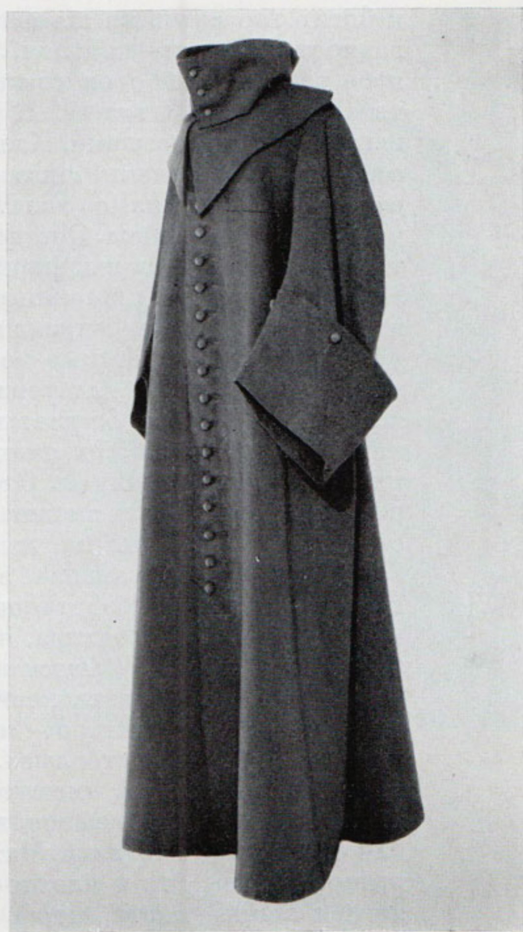
Рис. 10. Епанча с рукавами. Первая четверть XVIII в. Гардероб Петра I

койной расцветкой. Почти все шубы, занесенные в Опись , покрыты сукном и отделаны галуном. Об их покрое сведений очень мало. Но, учитывая, что в тексте мы не находим указаний на шубу «польскую» или «русскую», можно полагать, что шубы также подчинились «немецкому» влиянию и выполнялись, сообразуясь с европейскими модами 51 .