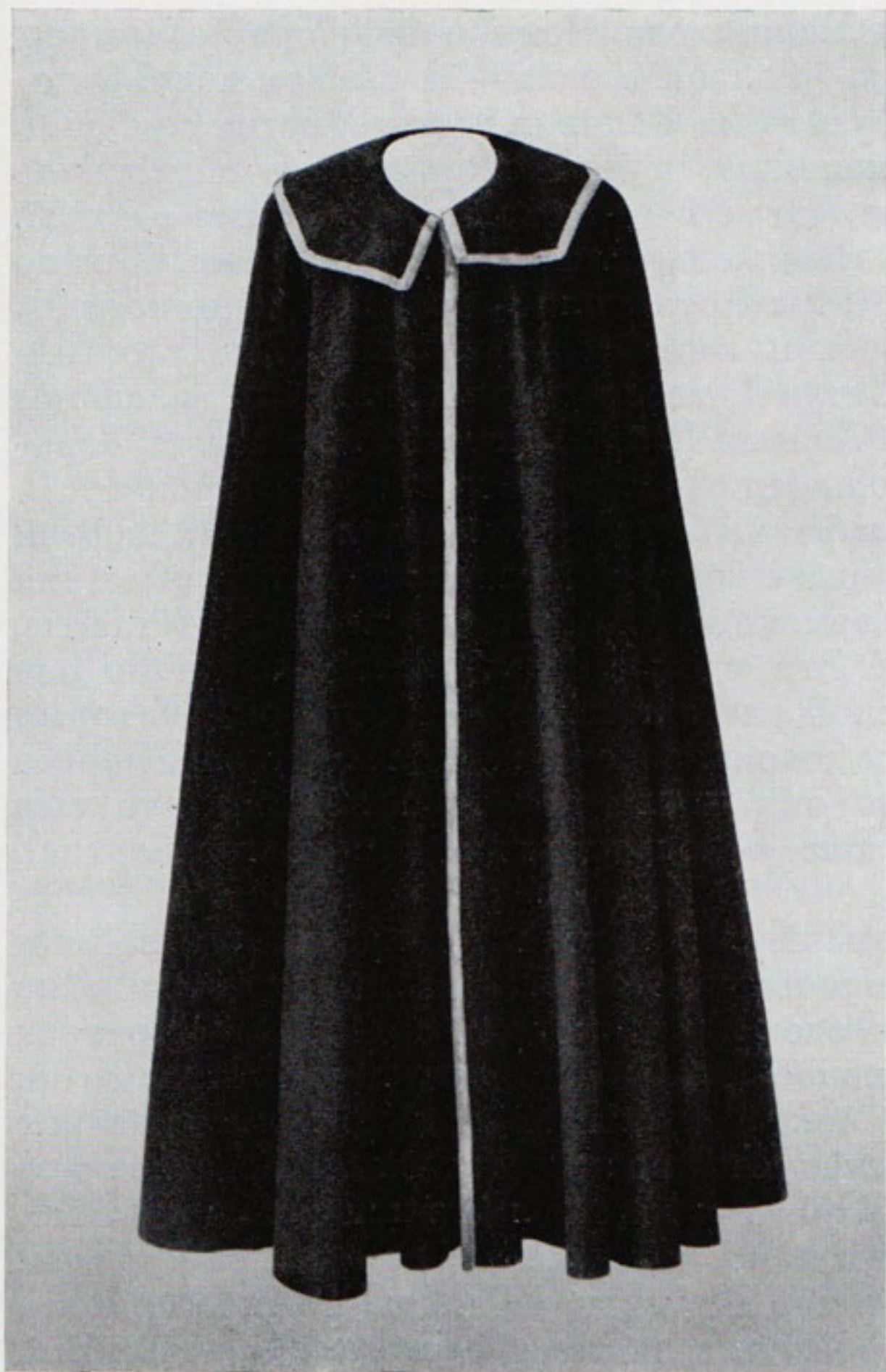
Рис. 9. Епанча круглая. Первая четверть XVIII в. Гардероб Петра I