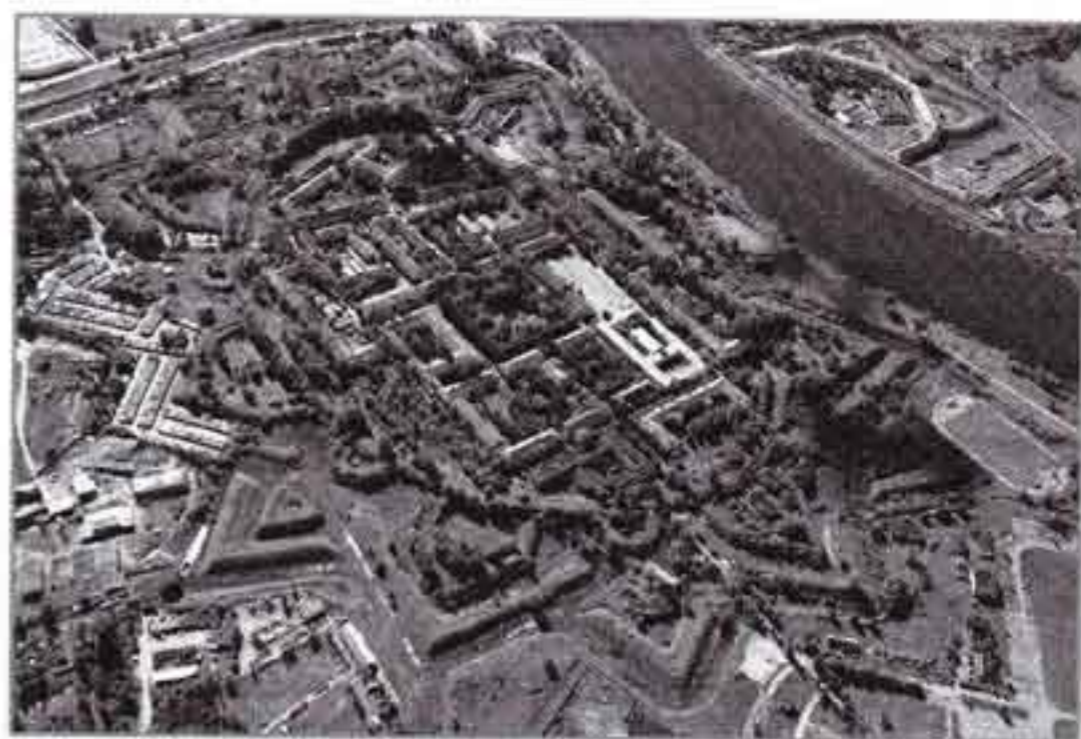
Динабургская (Двинская) крепость. Современное фото Ю. Калниньша

империи требовалось в спешном порядке строить казармы, провиантские магазины, интендантские склады и другие воинские здания.