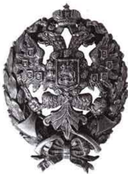
Знак офицеров, окончивших Николаевскую Инженерную академию. Частная коллекция