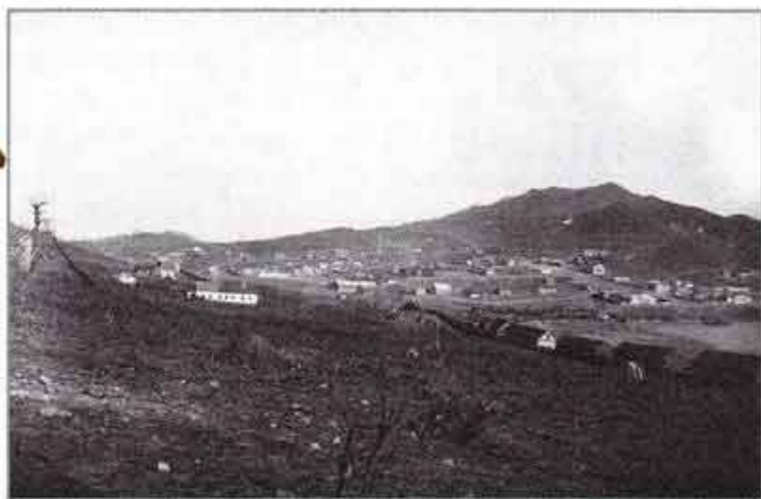
Вид поста и порта Владивостока в 1870-е годы.

топографическое черчение, химия, военная администрация, механика, военная история, железные дороги, минералогия. Кроме своих преподавателей, к проведению лекций и занятий активно привлекались ведущие преподаватели и профессора академий Генерального штаба и Артиллерийской, Санкт-Петербургского университета и институтов Технологического и Путей Сообщения. 14 июня 1866 года для выпускников академии был утверждён специальный серебряный нагрудный знак. Знак представлял собой Государственный герб, наложенный на венок из дубовых и лавровых листьев. Под орлом размещалась эмблема инженерных войск – два скрещённых топора.