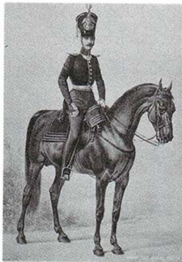
Обер-офицер артиллерии 1833-1844 гг.