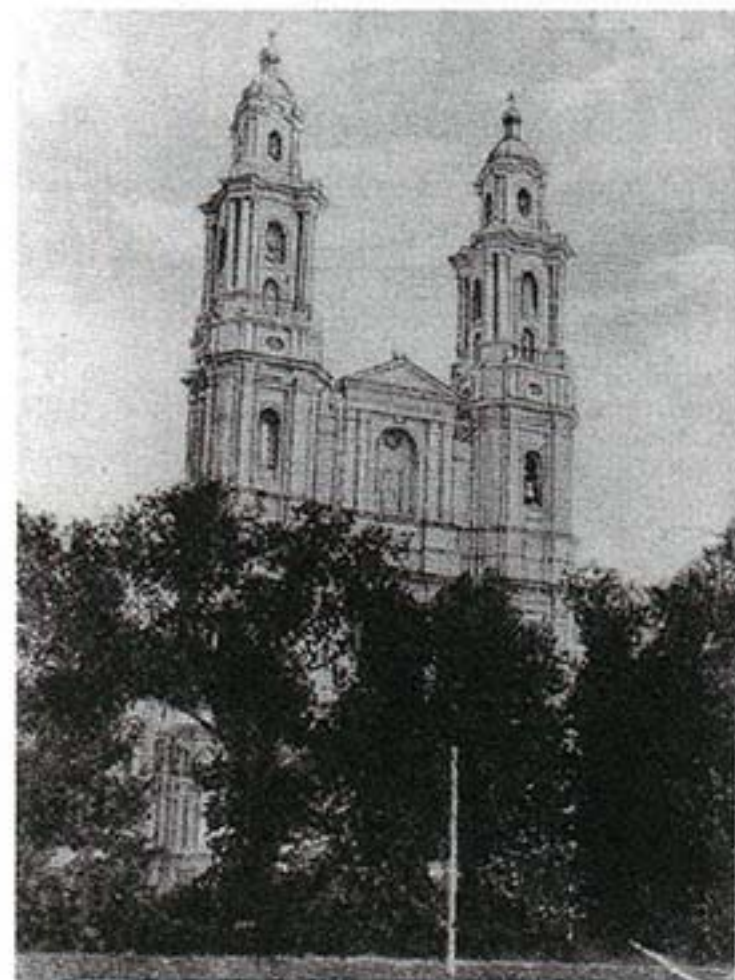
Динабургский крепостной собор в честь Рождества Христова (взорван немецкой армией в 1944 г.)