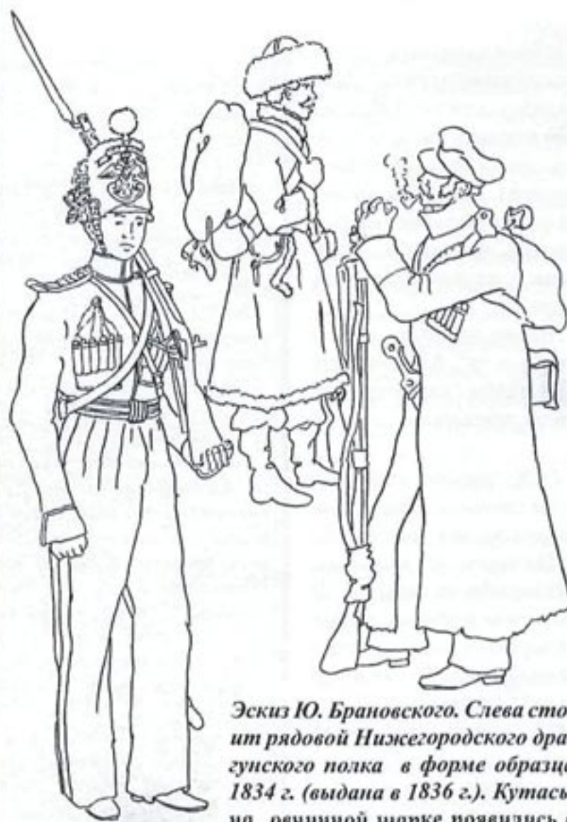
Эскиз Ю. Брановского. Слева стоит рядовой Нижегородского драгунского полка в форме образца 1834 г. (выдана в 1836 г.). Кутасы на овчинной шапке появились в

Для усиления ОКК в годы Крымской войны 1853-1856 гг. на Кавказ была командирована сводная драгунская бригада в составе Новороссийского и Тверского драгунских полков. Очевидец походов сводной бригады вспоминал, что «драгуны в своих медных касках млели и падали с лошадей, да и труд-