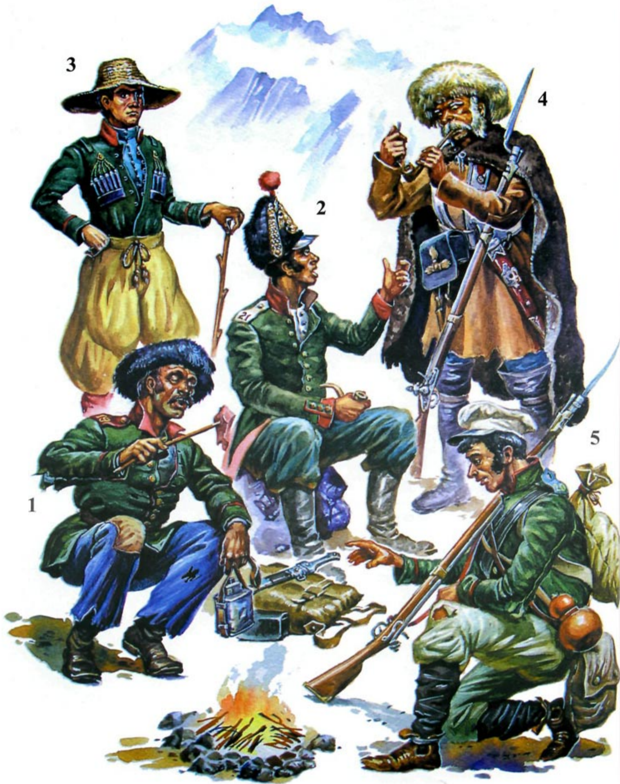
А.Н. Ежов. Кавказские солдаты в походной форме. 1. Солдат пехотного полка в мундире образца 1848 г. 2. Гренадер Ширванского полка в мундире образца 1826 г. и “кавказской” шапке образца 1829 г. 3. Юнкер Нижегородского драгунского полка, лето 1850 г. 4. Солдат Ширванского полка в походной зимней форме, аул Куссары в Дагестане, 1849 г. (по рисунку В. Тимма). 5. Солдат в летней походной форме. (Иллюстрация выполнена с эскиза Ю. Брановского).