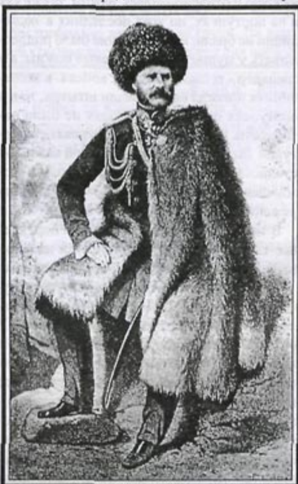
Князь А.И. Барятинский. Литография В. Тимма.

Вообще в холодное время кавказская армия сильно страдала от холода. Поэтому в