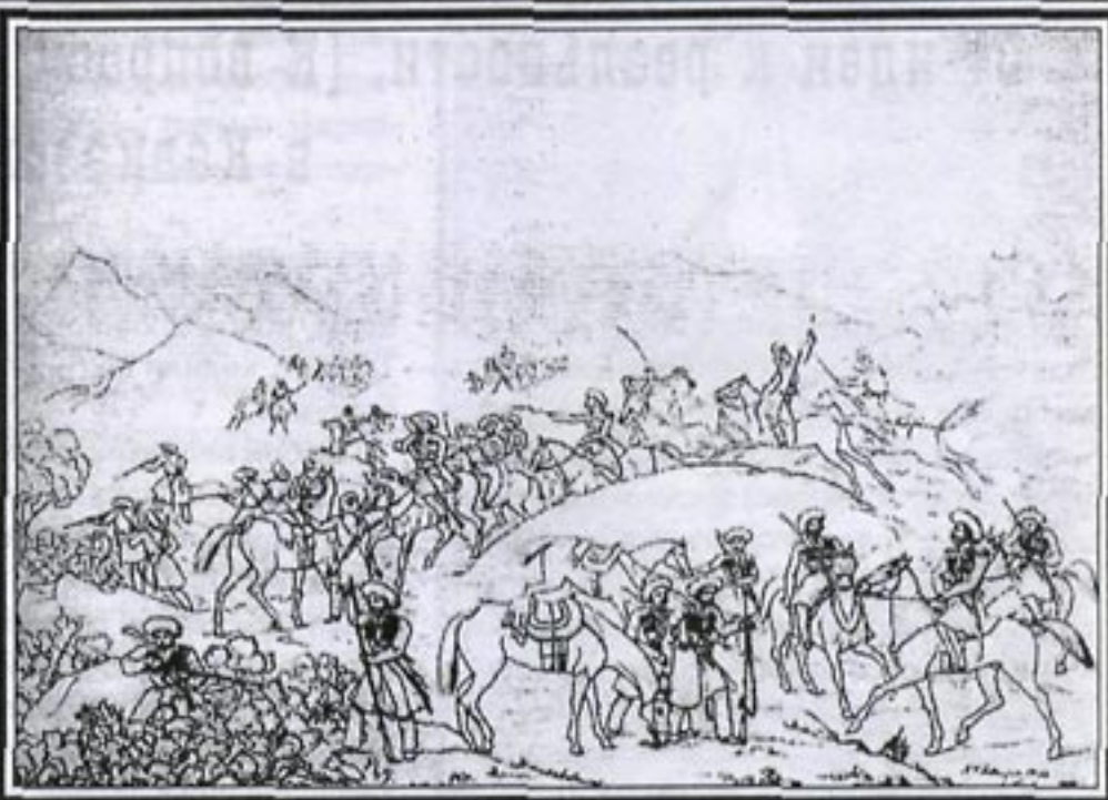
Рисунок Александра II. «Батальная сцена».

Состояние войны требовало от войск постоянной готовности вступить в бой, быстро вести огонь по противнику. Однако солдаты теряли много патронов "по неудобству