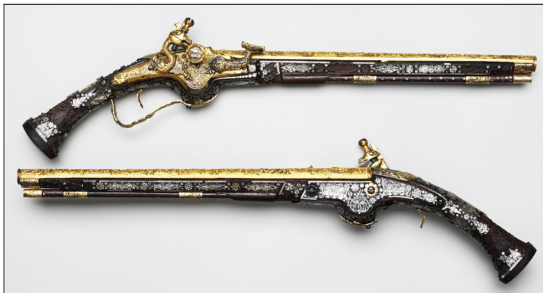
Рис. 3. Пистолеты, пара. Москва, Оружейная палата, вторая половина XVII в. Григорий Вяткин (ствол, замок); Евтихий Кузовлев (станок). Инв. № Ор-2095/1-2; 2096/1-2