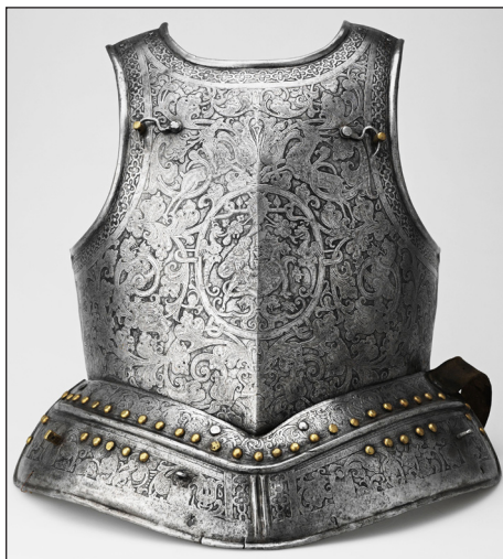
Рис. 8. Кираса. Москва, Оружейная палата, первая половина XVII в. Никита Давыдов (?). Инв. № Ор- 127/1-2

казне образцам. В одном случае это роскошные турецкие наручи времени Сулеймана великолепного, в другом – западноевропейский доспех – предположительно, дар Морица Оранского царю Михаилу Федоровичу 50 .