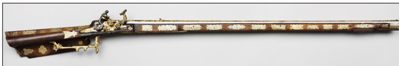
Рис. 10. Пищаль. Москва, Оружейная палата, 1673 г. (?) Григорий Вяткин. Инв. № Ор-100/1-2