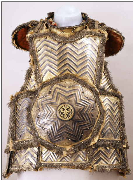
Рис. 6. Доспех зеркальный. Москва, Оружейная палата, 1661–1663 гг. Никита Давыдов. Инв. № Ор-125/1-2

Работа Никиты Давыдова над зеркальным доспехом царя Алексея Ми-